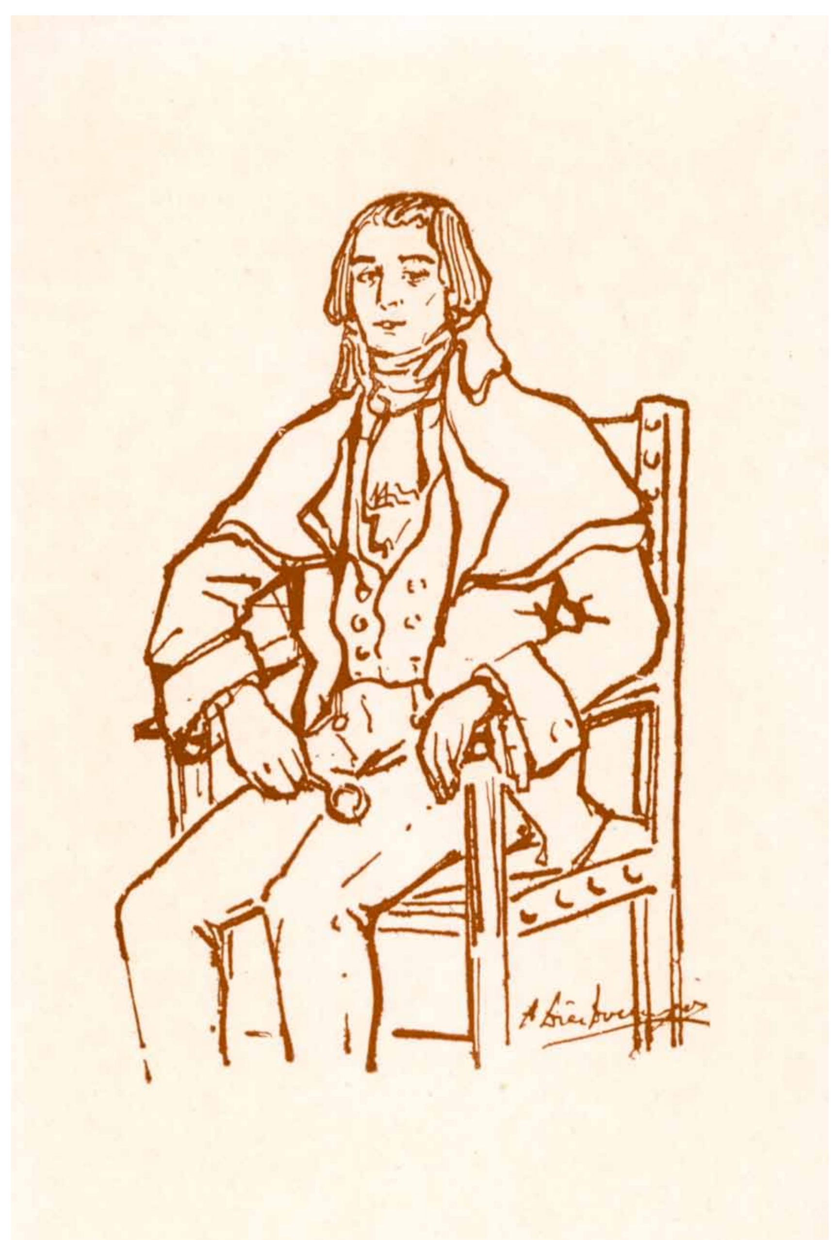
Dibujo de Ignacio Jordán de Asso. Archivo Municipal de Zaragoza, G4174.

Pendant les deux Sièges de Saragosse, il fut conseiller du général Palafox et écrivit la publication La Gaceta Extraordinaria de Zaragoza , contribuant par ses informations à prévenir la résistance populaire. Le palais Asso est conservé sur la place, où vivait cet illustre Aragonais.