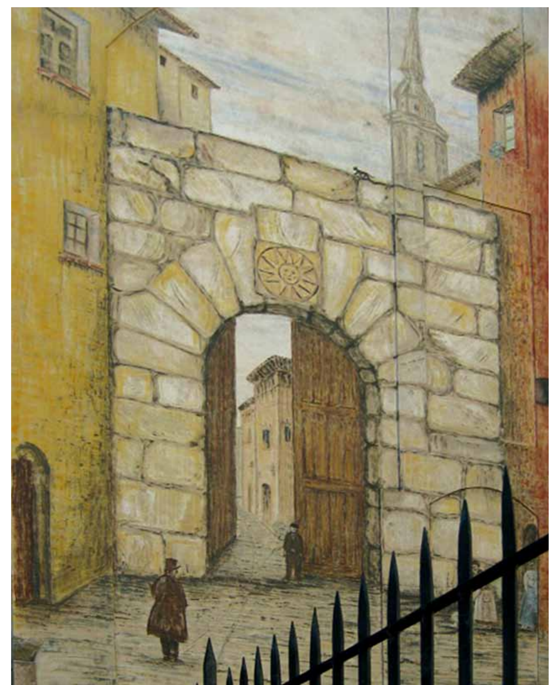
Pintura mural representando la Puerta del Sol.

En plus de celle de Valence, d'autres portes s'ouvraient dans la muraille qui entourait la ville, des points importants dans la défense de Saragosse. Tout près de la place se trouvait la Puerta del Sol, qui laissait le quartier de Tenerías hors des murs, et dans le quartier voisin de San Miguel se trouvait la Puerta Quemada (Porte Brûlée), qui fut connue sous le nom de Puerta del Heroísmo (Porte de l'Héroïsme) après les sièges en raison de la résistance acharnée de ses habitants.