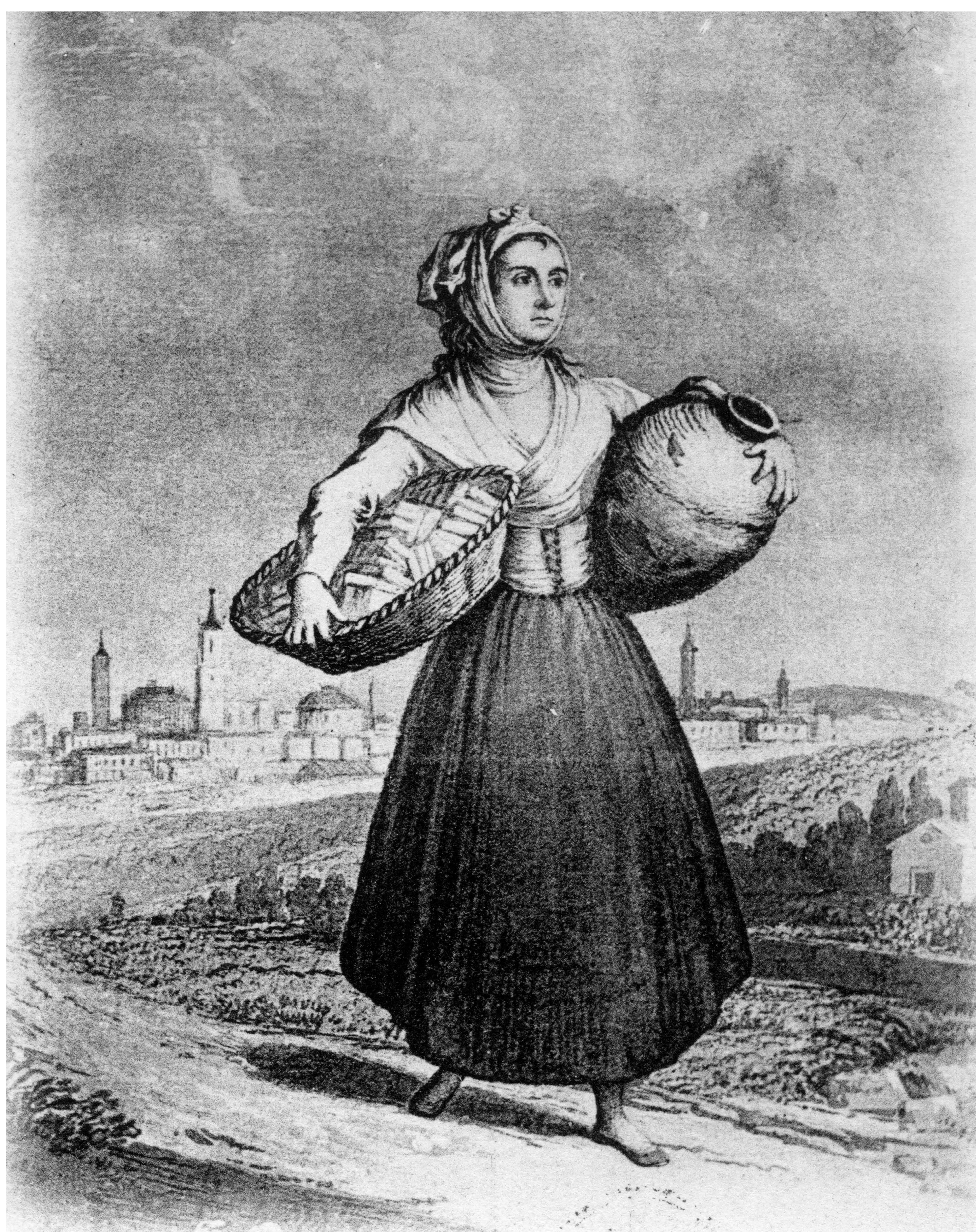
Ruinas de Zaragoza. 1808 y 1809. María Agustín. Archivo Municipal de Zaragoza, 4-1_03584.

La batalla de las Eras, el 15 de junio de 1808, tuvo lugar en la explanada que ocupa la antigua estación de ferrocarril y anexos, desde el Portillo hasta el Paseo de Teruel. El resultado de la acción fue la pérdida por parte francesa de varios cientos de vidas. La Puerta del Carmen fue rebasada otras dos veces, obligándose a los defensores a recuperarla.