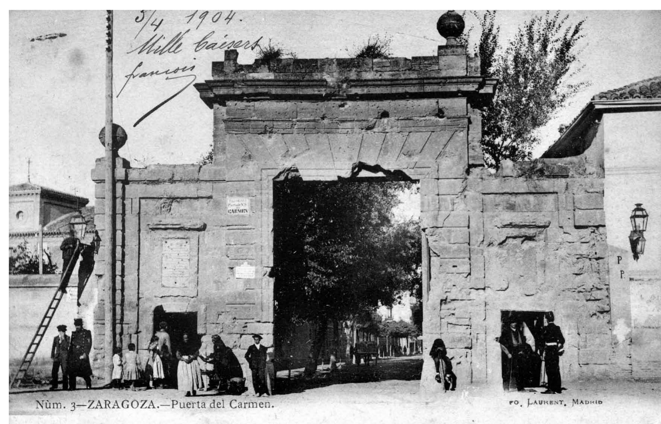
Núm. 3—ZARAGOZA.—Puerta del Carmen.