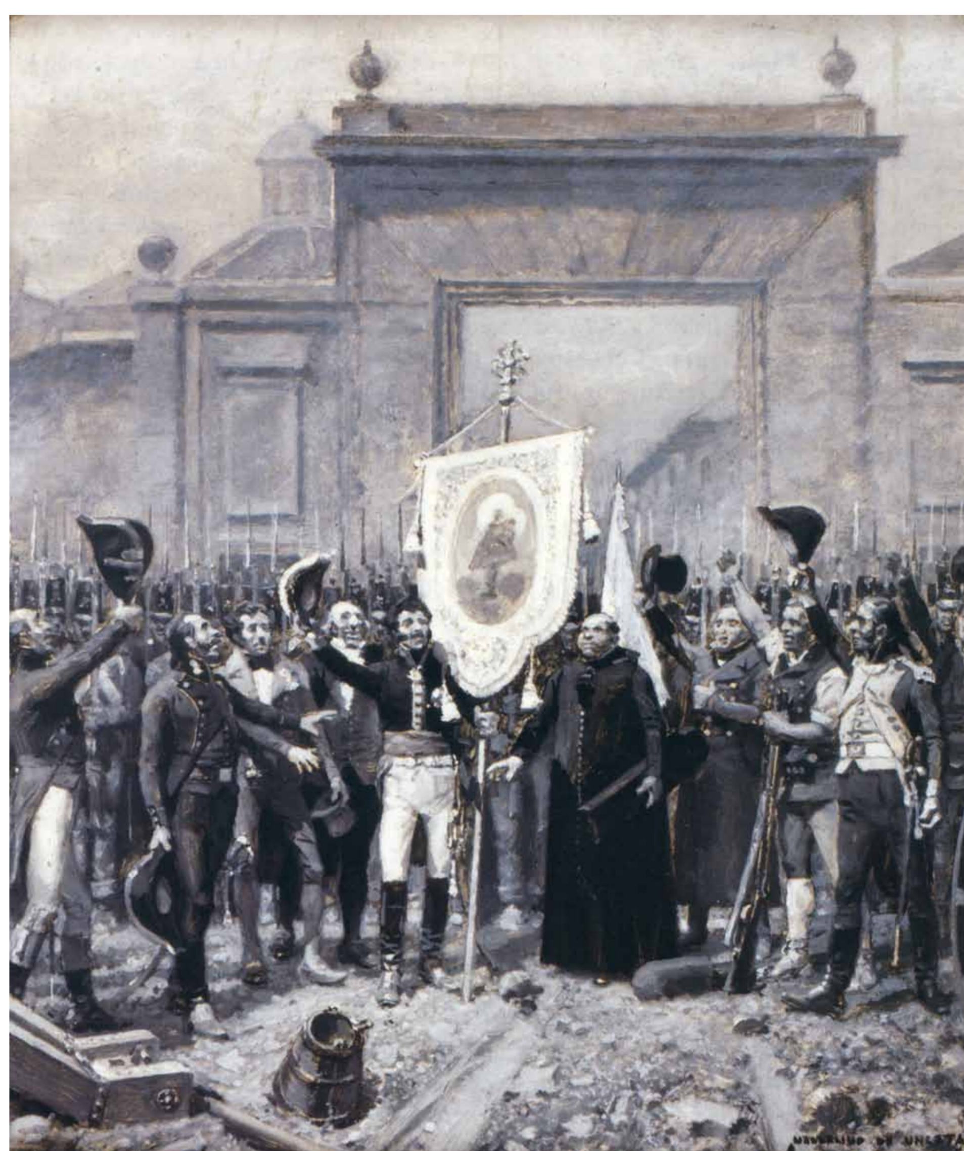
26 de junio de 1808. Solemne juramento cívico en Zaragoza. Marcelino de Unceta, 1898. Colección particular. Madrid.

En los muros de la puerta se pueden ver todavía los numerosos impactos de artillería que sufrió durante los enfrentamientos. Por un lado, algunos orificios de bala de fusil y numerosas señales de los cañones franceses; por el otro, el que miraba al interior de la ciudad, solo señales de fusiles aragoneses.