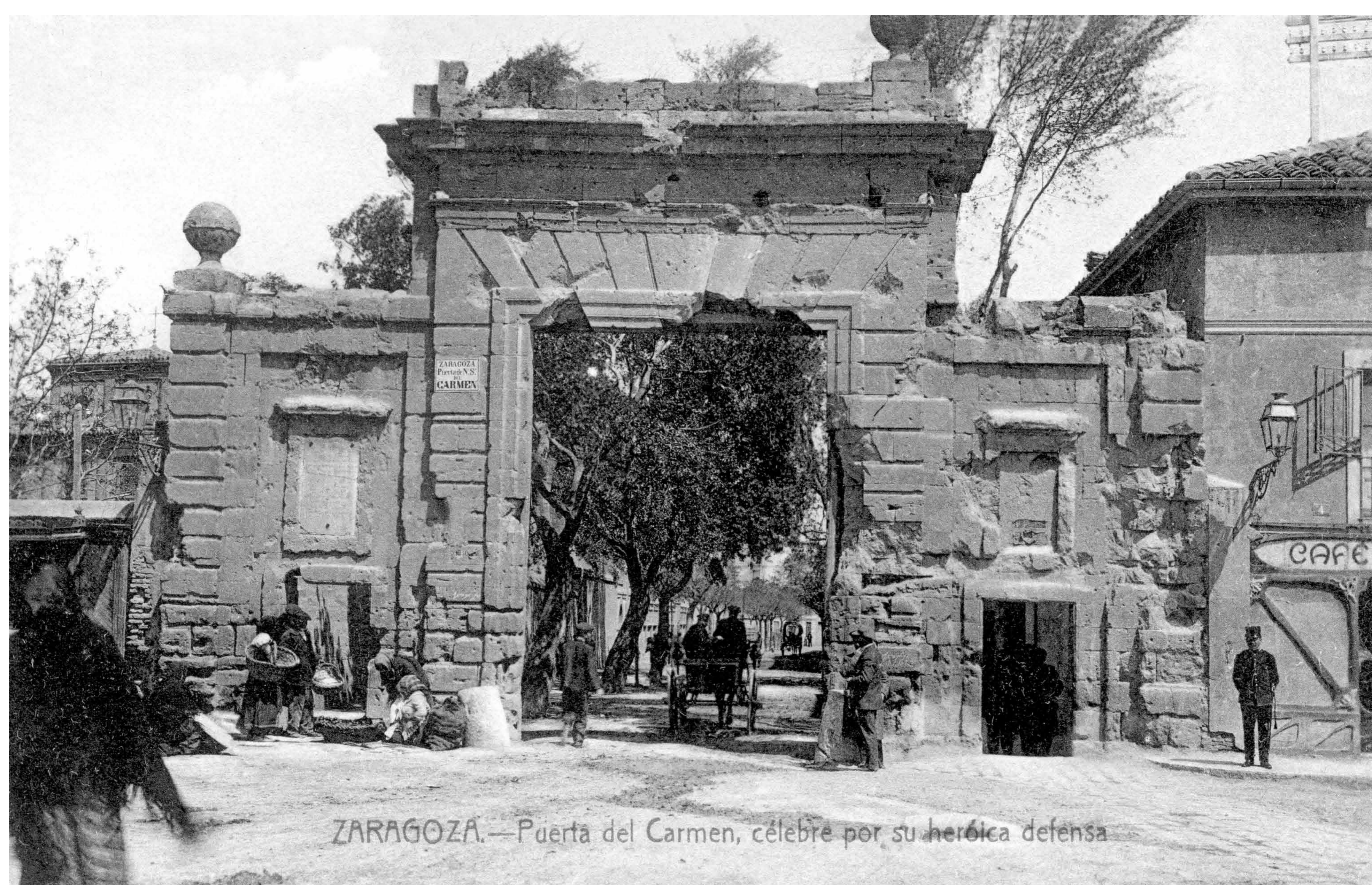
Zaragoza. Puerta del Carmen, célebre por su heroica defensa. Archivo Municipal de Zaragoza, 4-1_057.

Es una de las históricas puertas de entrada de la ciudad de Zaragoza. Fue construida por el arquitecto Agustín Sanz en el año 1792. Su estructura, a modo de arco triunfal romano, sufrió una intensa actividad bélica durante los Sitios de Zaragoza, en la Guerra de la Independencia.