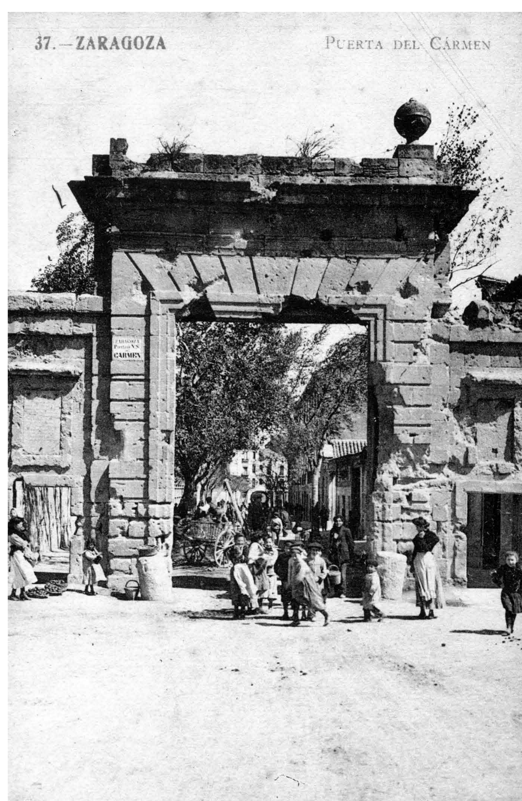
Zaragoza. Puerta del Carmen