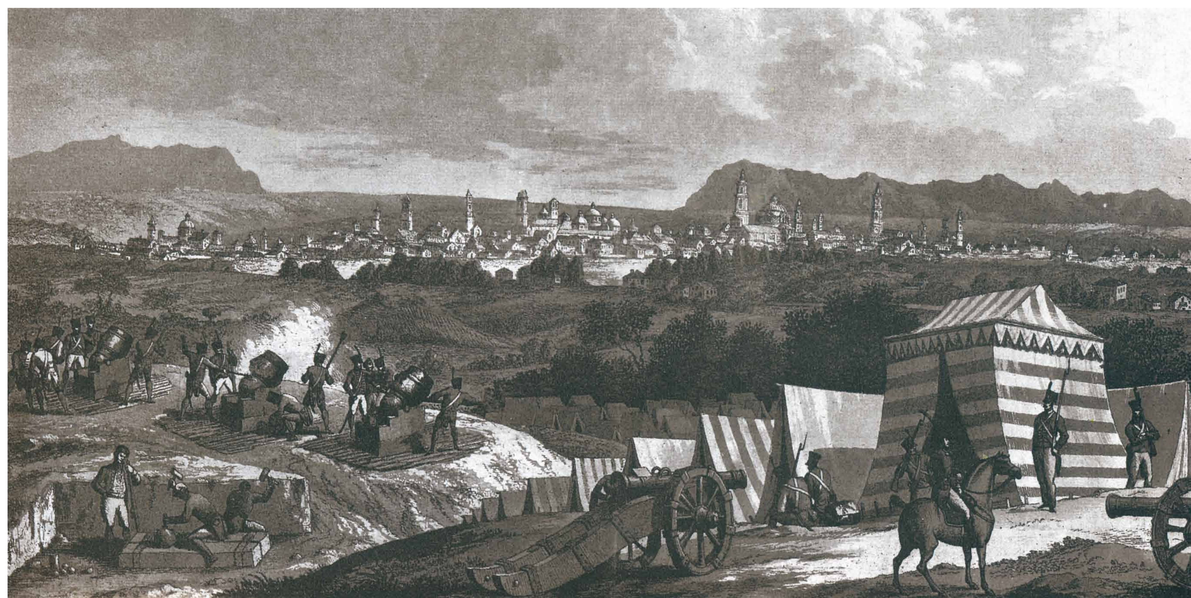
Grabado de Gálvez y Brambila. Vista general de Zaragoza tomada desde el monte Torrero.

El invencible ejército napoleónico había sido incapaz de ocupar Zaragoza durante el primer Sitio. La experiencia del asedio reveló que la zona de Santa Engracia, y sus proximidades, era una de las más débiles para acceder a la ciudad, por lo que se fortaleció la defensa de cara a un previsible segundo ataque.