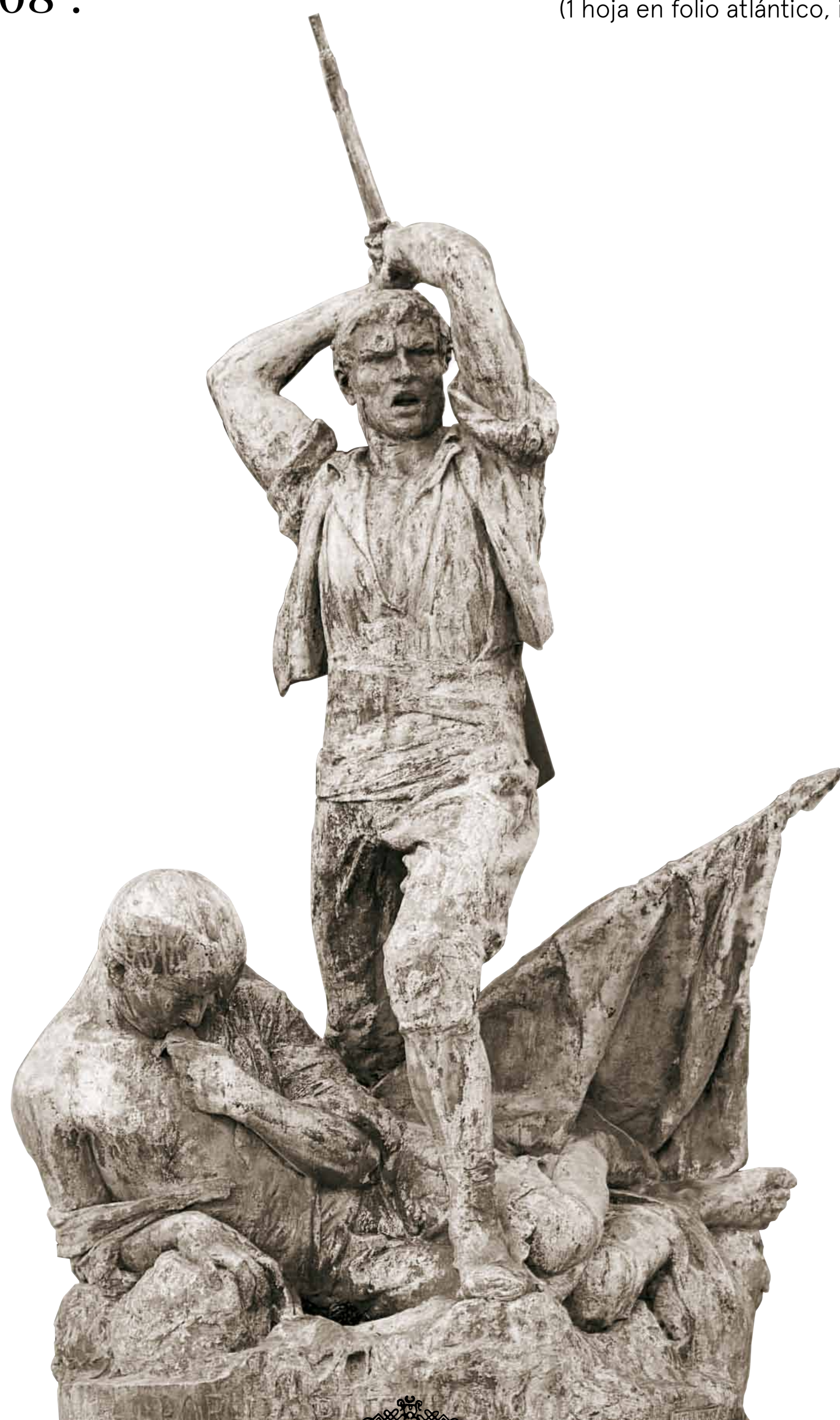
Escultura de bronce de Federico Amutio, titulada Por la Patria , 1808.

Posteriormente sería sustituido por el actual grupo escultórico de Federico Amutio titulado: "Por la Patria. 1808".