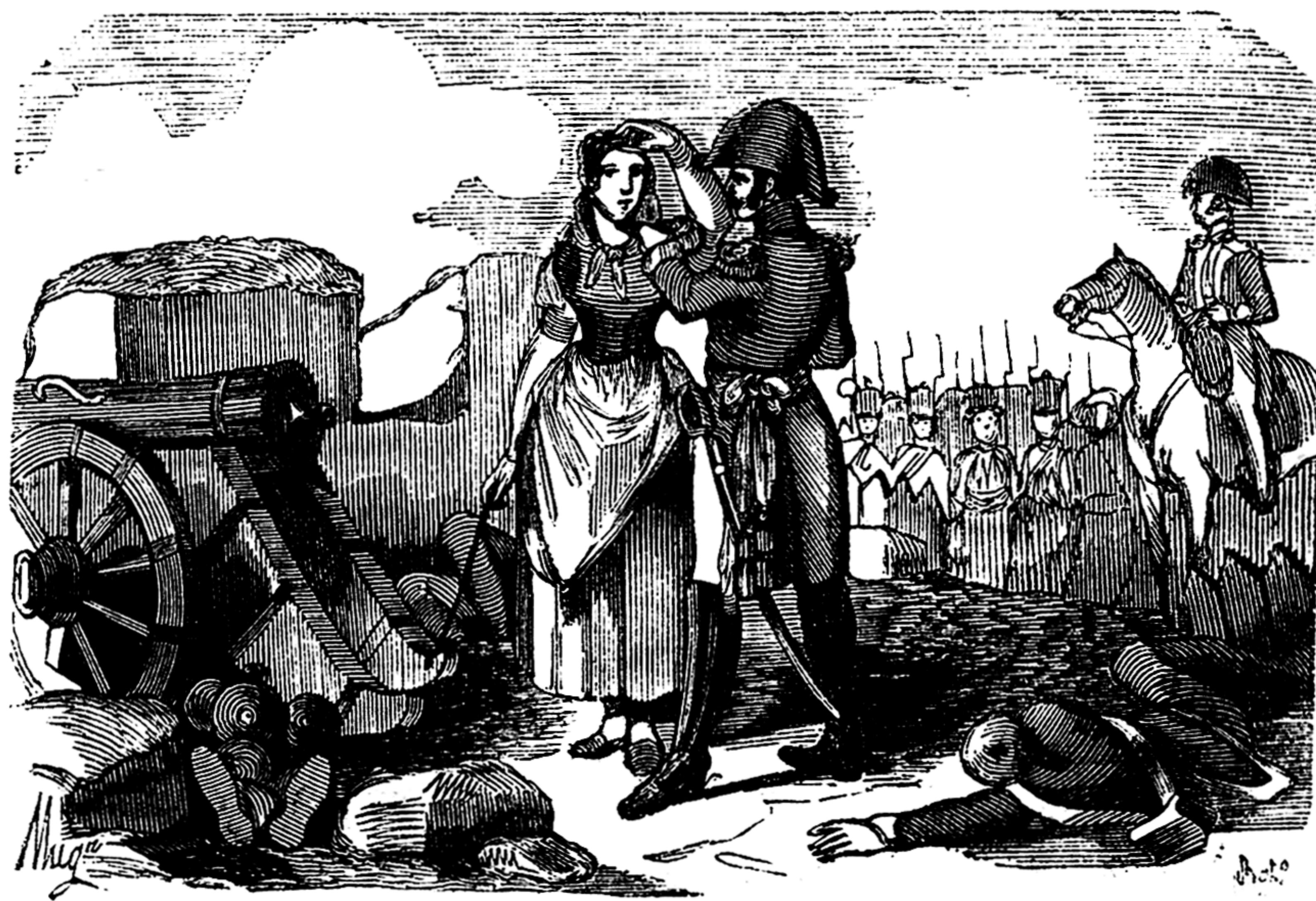
El premio de la heroína. Ilustración de la obra de Miguel Agustín Príncipe, 1846.

En el lugar que hoy ocupa el Hotel Palafox, se levantaba la iglesia de Nuestra Señora del Carmen, arruinada durante los Sitios.