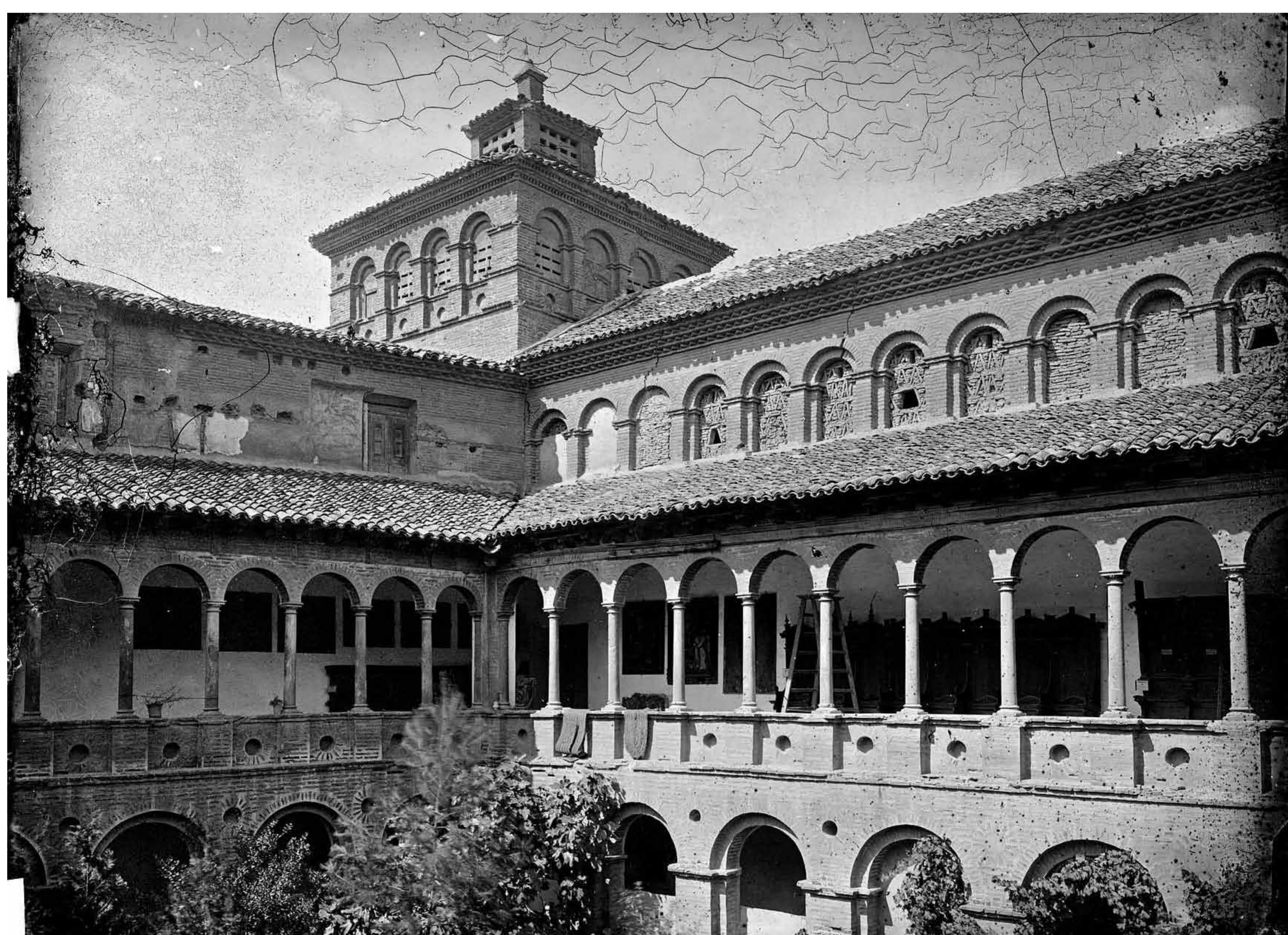
Claustro del antiguo convento de Santa Fé.

El día 4 de agosto de 1808, una columna francesa bordeó la calle del Azoque, adueñándose del convento de Santa Rosa y de las casas vecinas de Santa Fe. En ese punto se entabló un fiero combate.