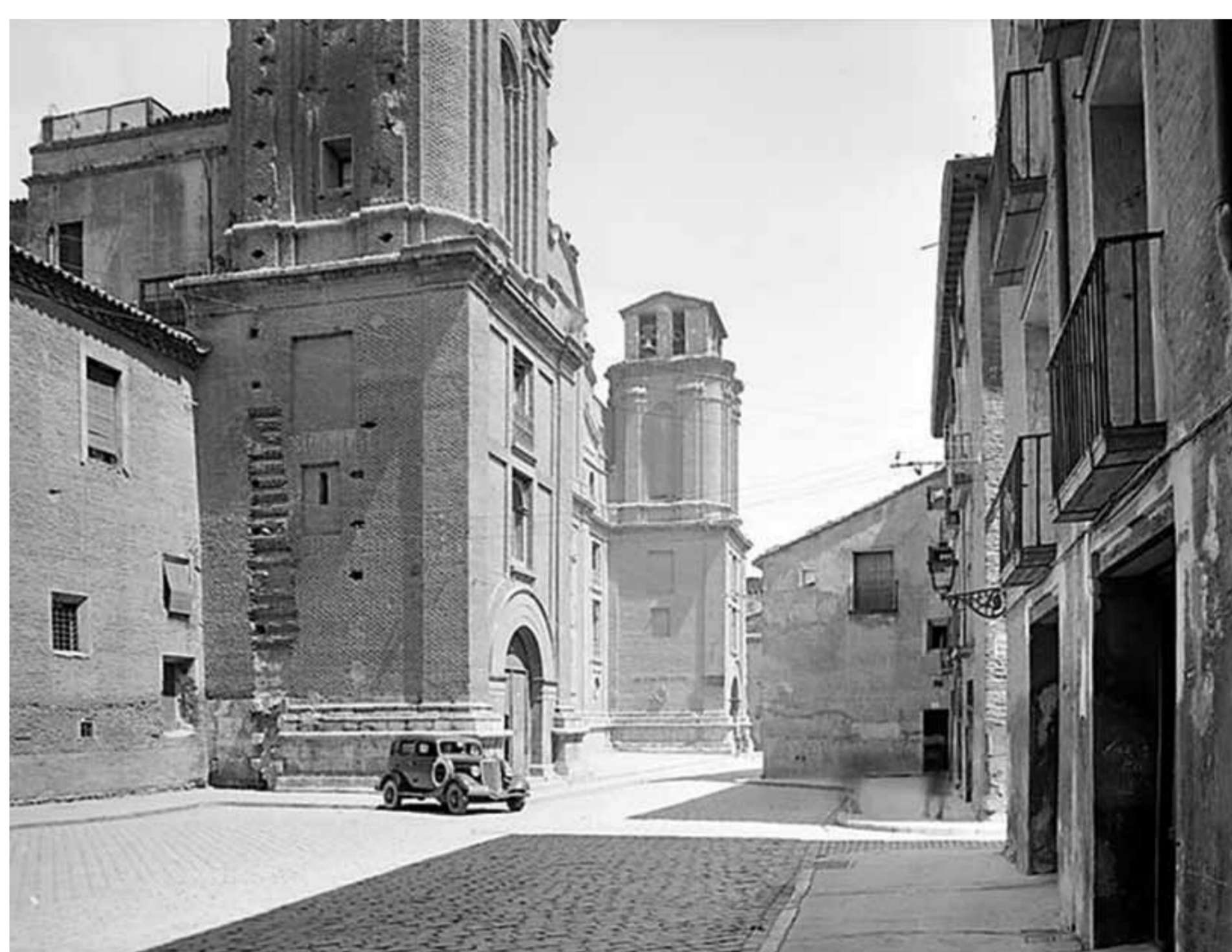
Iglesia de Santiago el Mayor.

Frente a esta plaza, llamada popularmente “del Carbón”, se levantaba el convento de San Ildefonso, un amplio edificio del que sólo se conserva su iglesia, llamada hoy de Santiago el Mayor. Durante el asedio francés el convento, como casi todos los de la ciudad, acogió a numerosos heridos y más tarde fue el lugar elegido por el general francés Lafebvre para instalar su cuartel general.