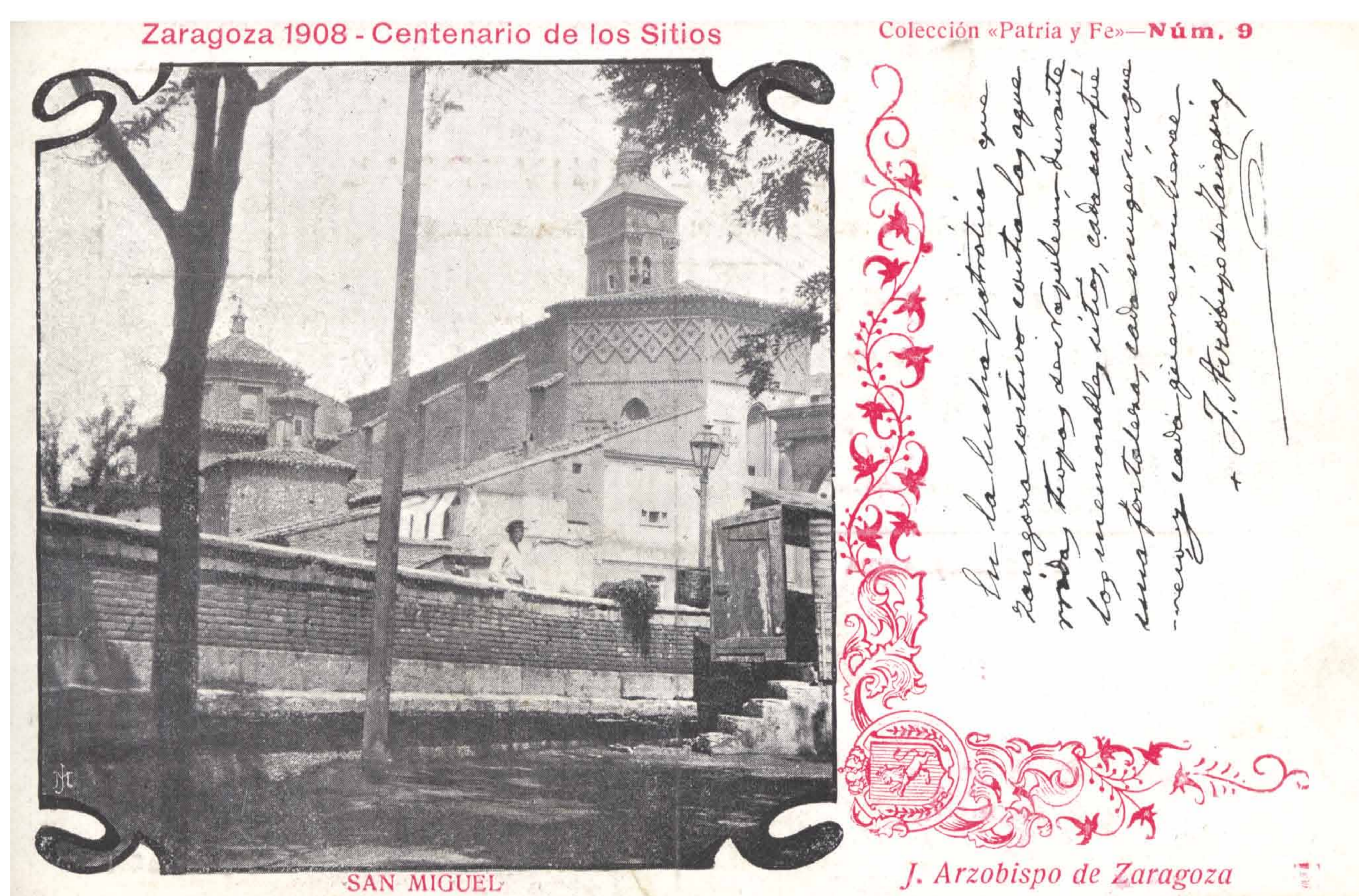
Carte postale éditée à l'occasion du centenaire des Sièges de Saragosse, 1908. San Miguel. Archivo Municipal de Zaragoza, 4-1_0163073.

La porte du Duque de la Victoria était également située sur la place San Miguel. Il s'agissait en fait d'un arc de triomphe pour commémorer la visite du général Espartero dans la ville. Elle a été démolie en 1919 et il reste aujourd'hui une fresque peinte sur un bâtiment voisin à titre de témoignage.