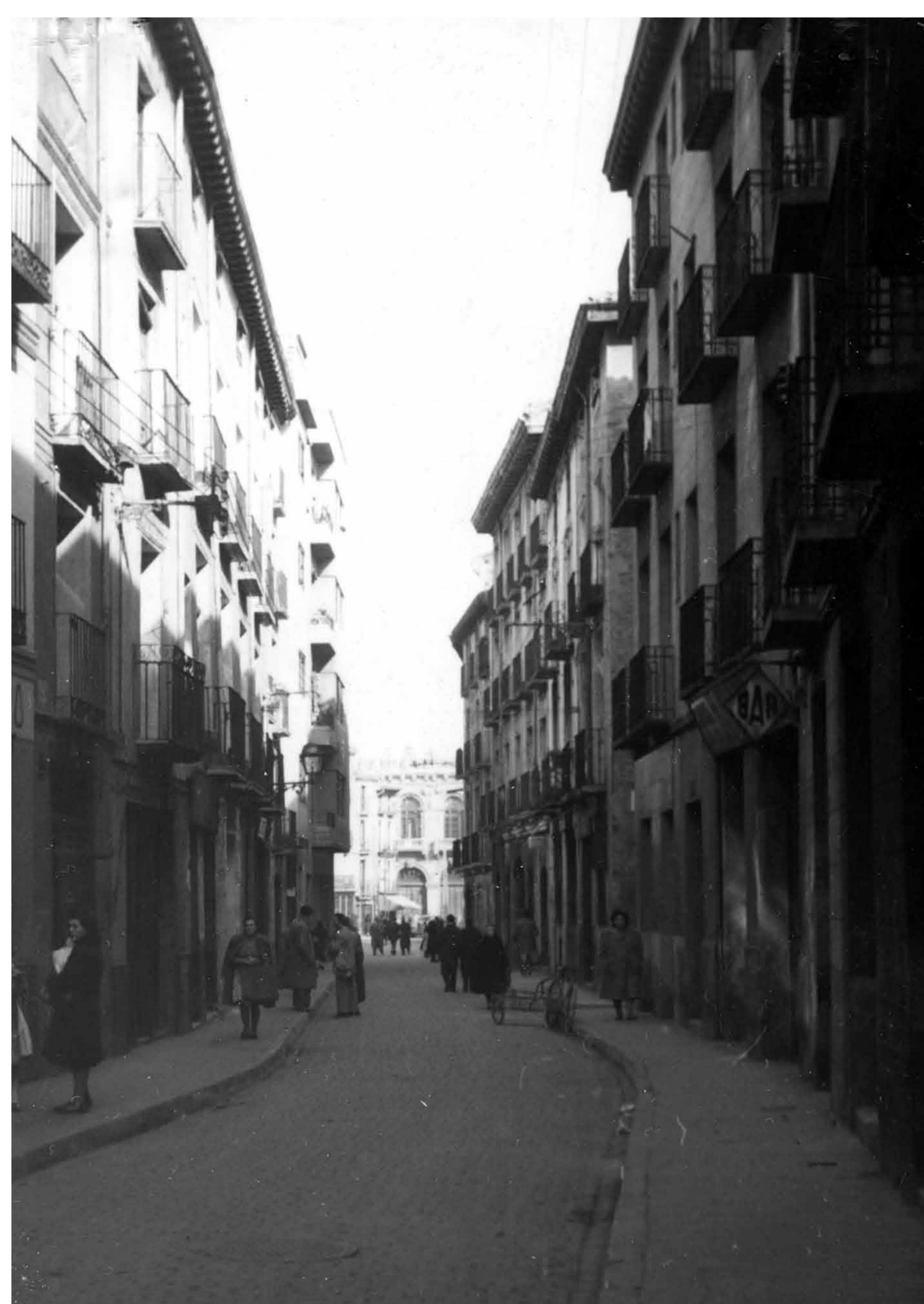
Calle [de] Heroísmo 4-1_0977.

Au bout de la rue se trouvait l'une des portes de la ville, la Puerta Quemada (la Porte brûlée). Cette rue a changé de nom après les sièges pour devenir Heroísmo, en mémoire de la résistance des défenseurs de Saragosse.