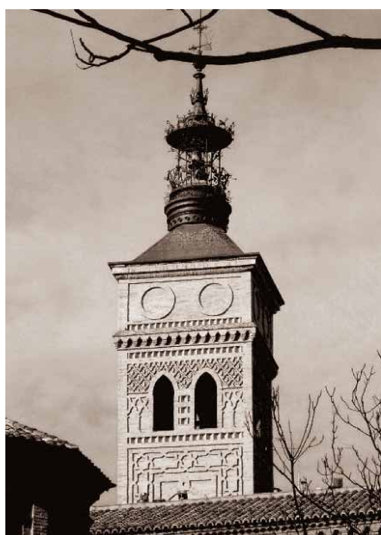
Torre mudéjar de la Iglesia de San Miguel de los Navarros.

La splendide tour mudéjare de l'église de San Miguel abritait une cloche appelée cloche des Perdus qui, depuis le XVI e siècle, sonnait trente-trois fois à la tombée de la nuit afin de guider ceux qui se trouvaient dans les champs à l'extérieur des murs, car il était fréquent que les gens ne puissent pas retrouver leur chemin vers la ville à cause du brouillard et du manque d'éclairage. Au début du XVI e siècle, le clergé de San Miguel a décidé de placer une grande lampe au sommet du clocher afin que, aidée par des miroirs, elle fasse office de phare dont la lumière servirait de point de référence dans la campagne. Mais lors d'une tempête, le vent a frappé le phare en 1556.