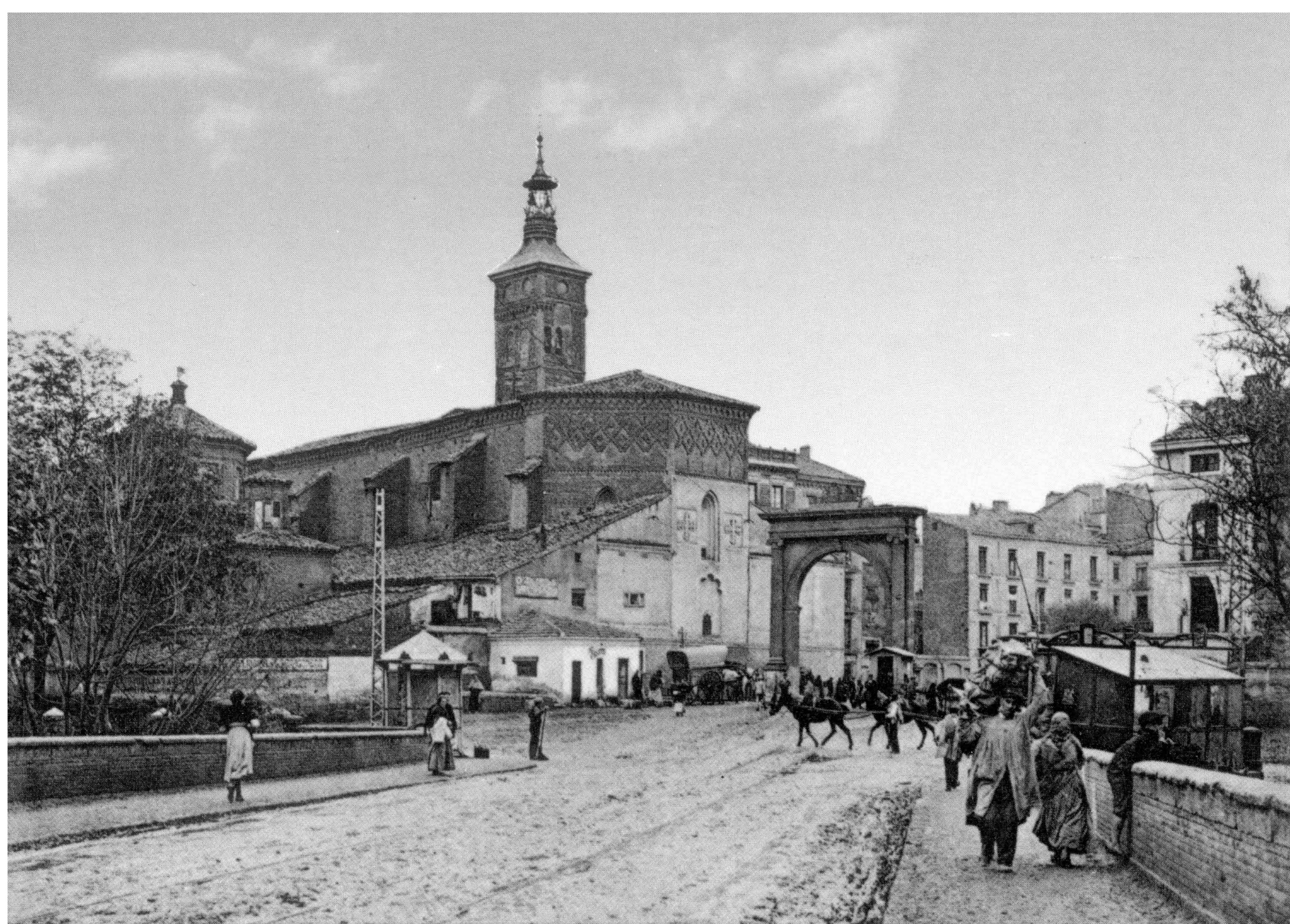
Iglesia de San Miguel y Puerta del Duque.

Le quartier de San Miguel a joué un rôle important dans la lutte que Saragosse a menée contre les troupes françaises pendant la guerre d'Indépendance.