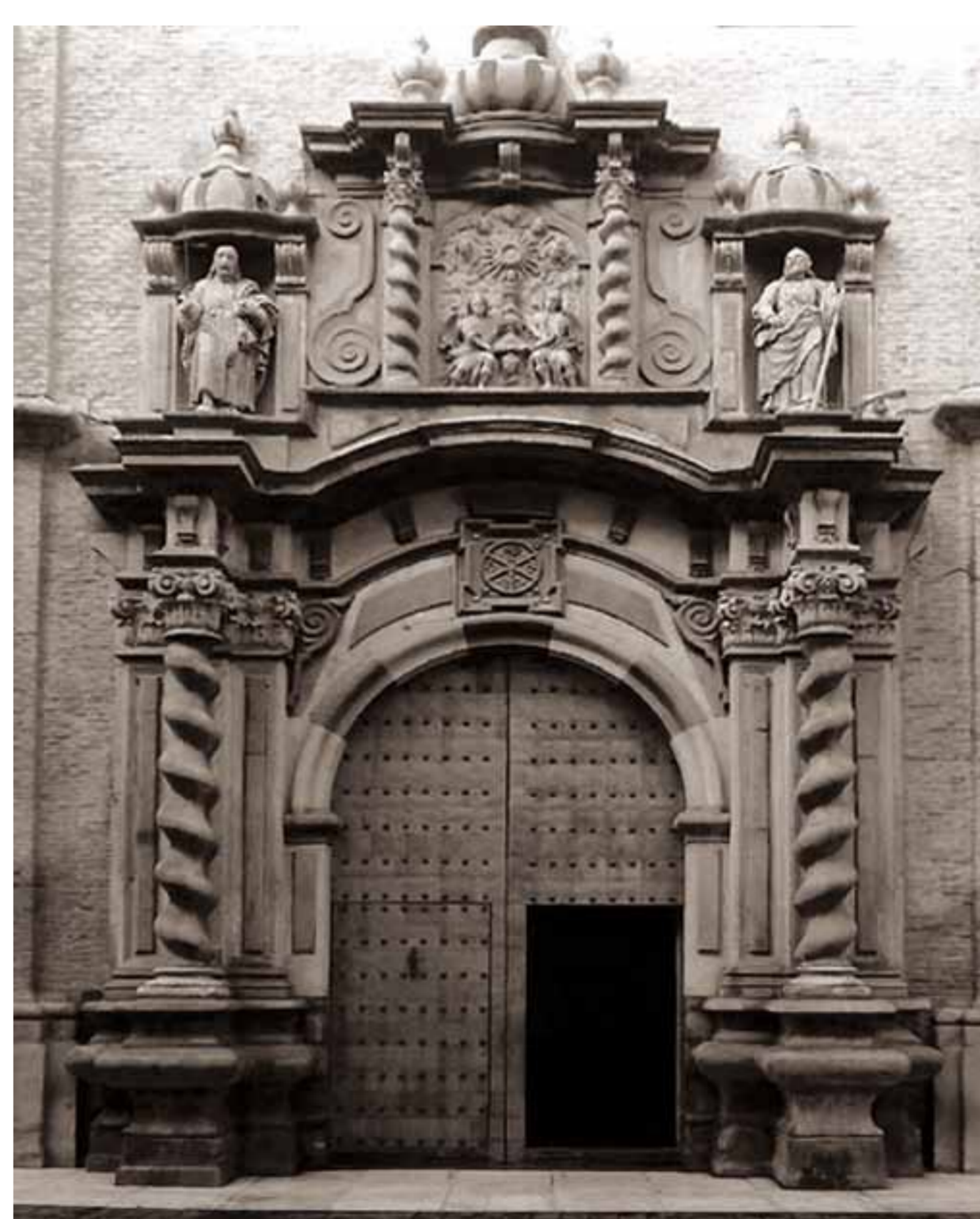
Iglesia de San Felipe y Santiago el Menor.