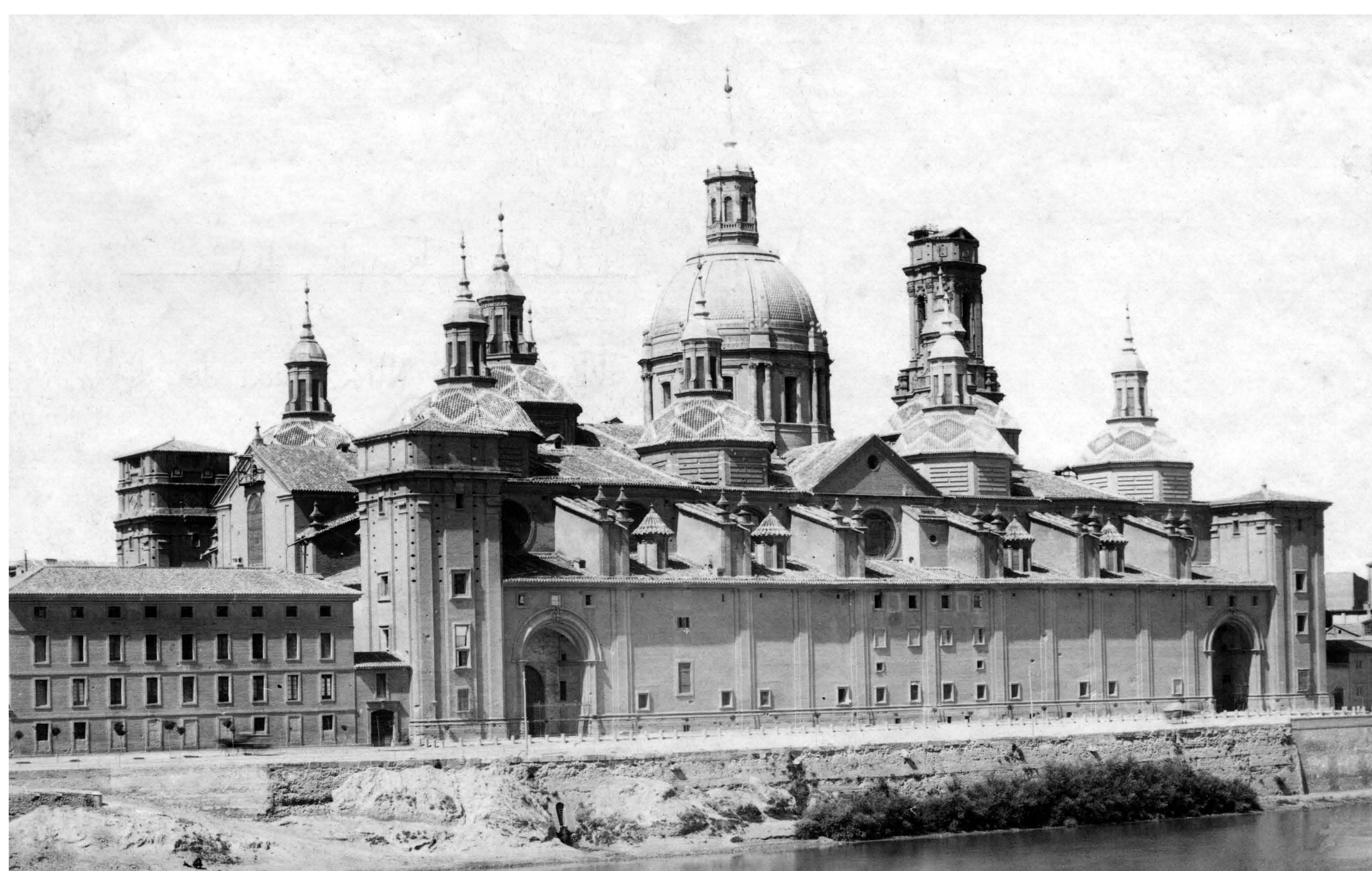
Vista exterior del templo del Pilar, tomada desde la ribera izquierda del Ebro. Charles Clifford. Hacia 1860. Archivo Municipal de Zaragoza, 4-1_01067.

Era muy importante su valor como símbolo, a la hora de enardecer a los zaragozanos. Y los franceses no desconocían este hecho, por lo que fue bombardeado el templo con especial atención por sus artilleros.