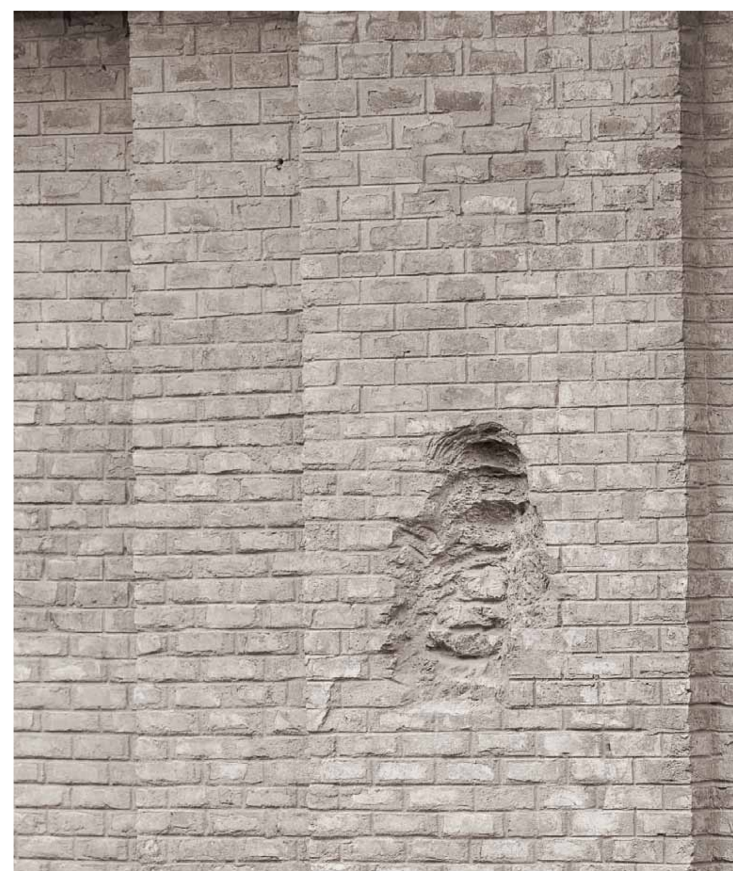
Basílica del Pilar que da a la ribera del Ebro, donde se muestran los impactos de las bombas de los cañones franceses.