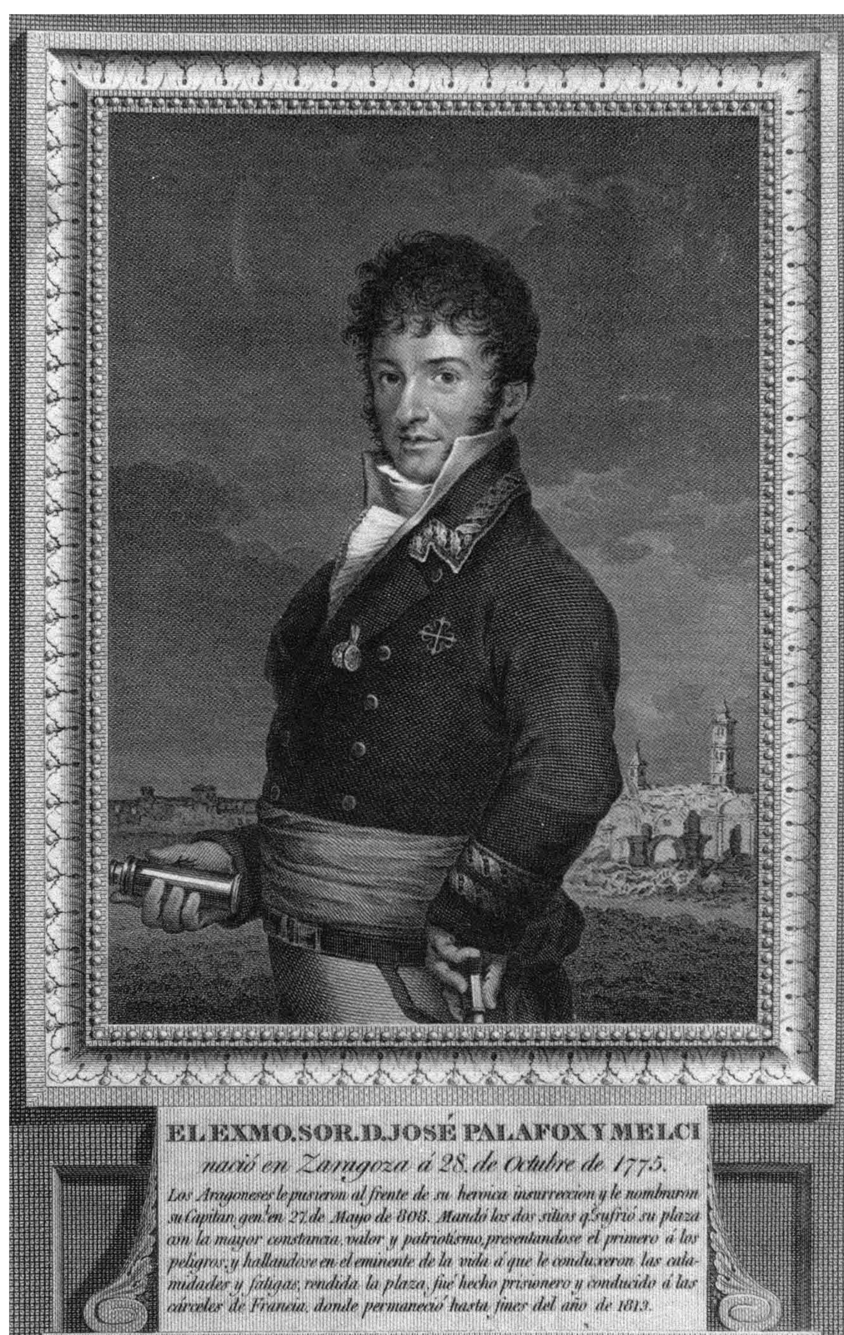
Excelentísimo Señor Don José Palafox y Melci.