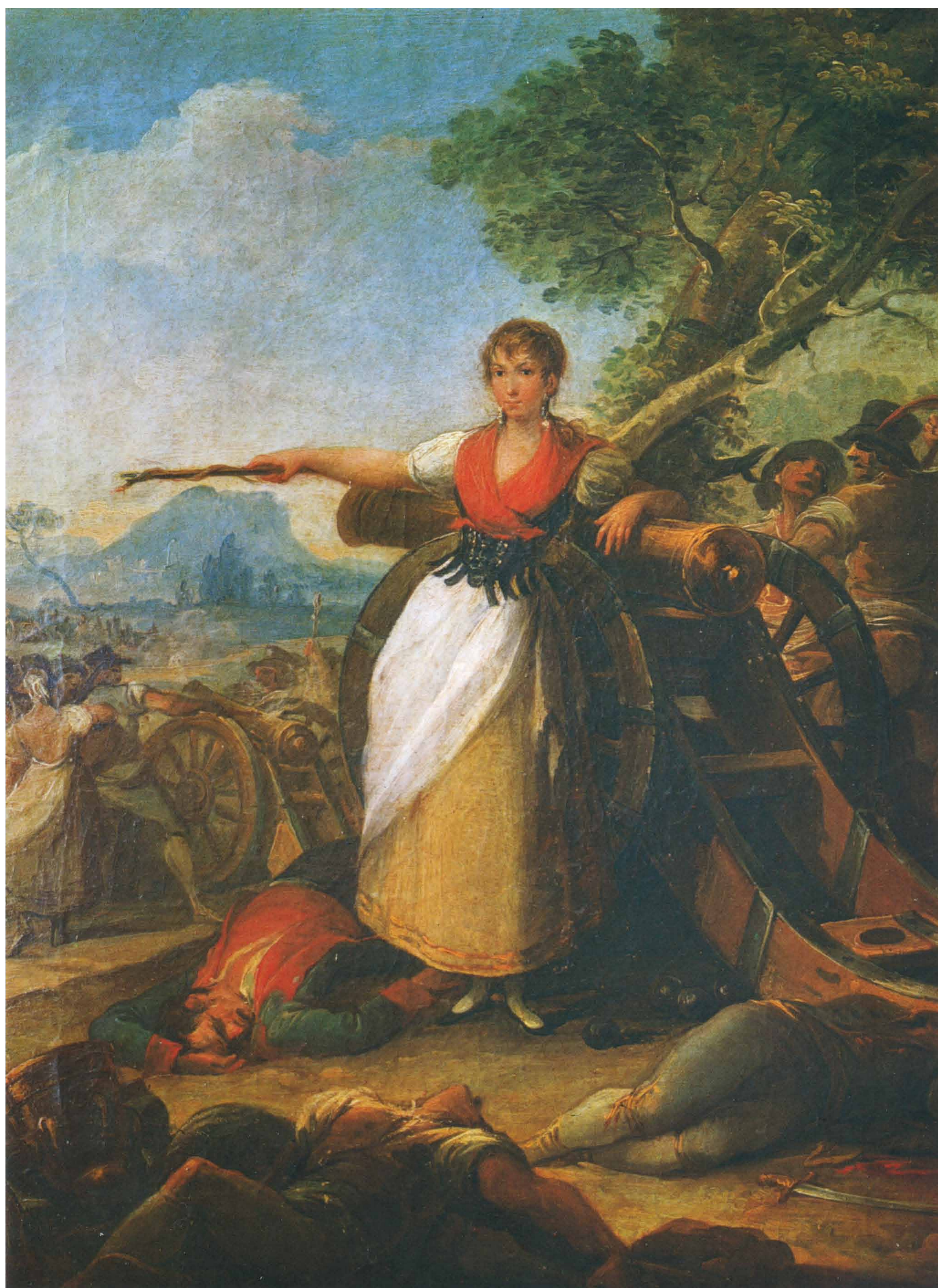
Retrato de Agustina Zaragoza y Domènech. Fernando Brambila y Ferrari (a). Primera mitad del siglo XIX. Óleo sobre lienzo.

Les rues de ce quartier de la ville ont été le scénario de lourds combats pendant les Sièges de Saragosse car c'était l'une des enclaves les plus importantes dans la défense de Saragosse contre les troupes napoléoniennes.