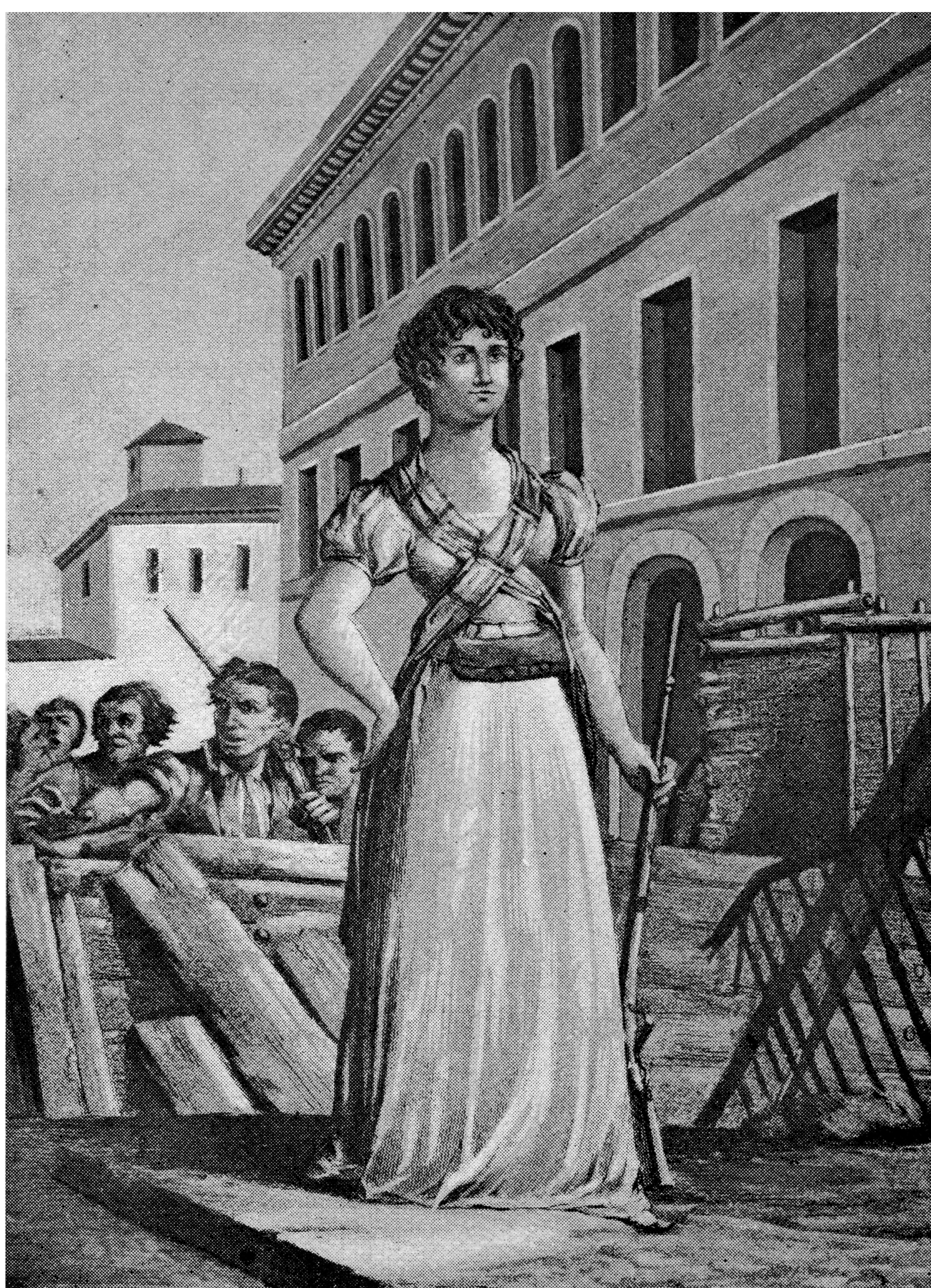
Comtesse de Bureta, grande héroïne et infatigable défenseur des barricades. 4-1_02936.

Les restes de María de la Consolación de Azlor y Villavicencio, comtesse de Bureta, reposent dans l'église de San Felipe. Sur une plaque placée à gauche du maître-autel à l'occasion du premier centenaire.