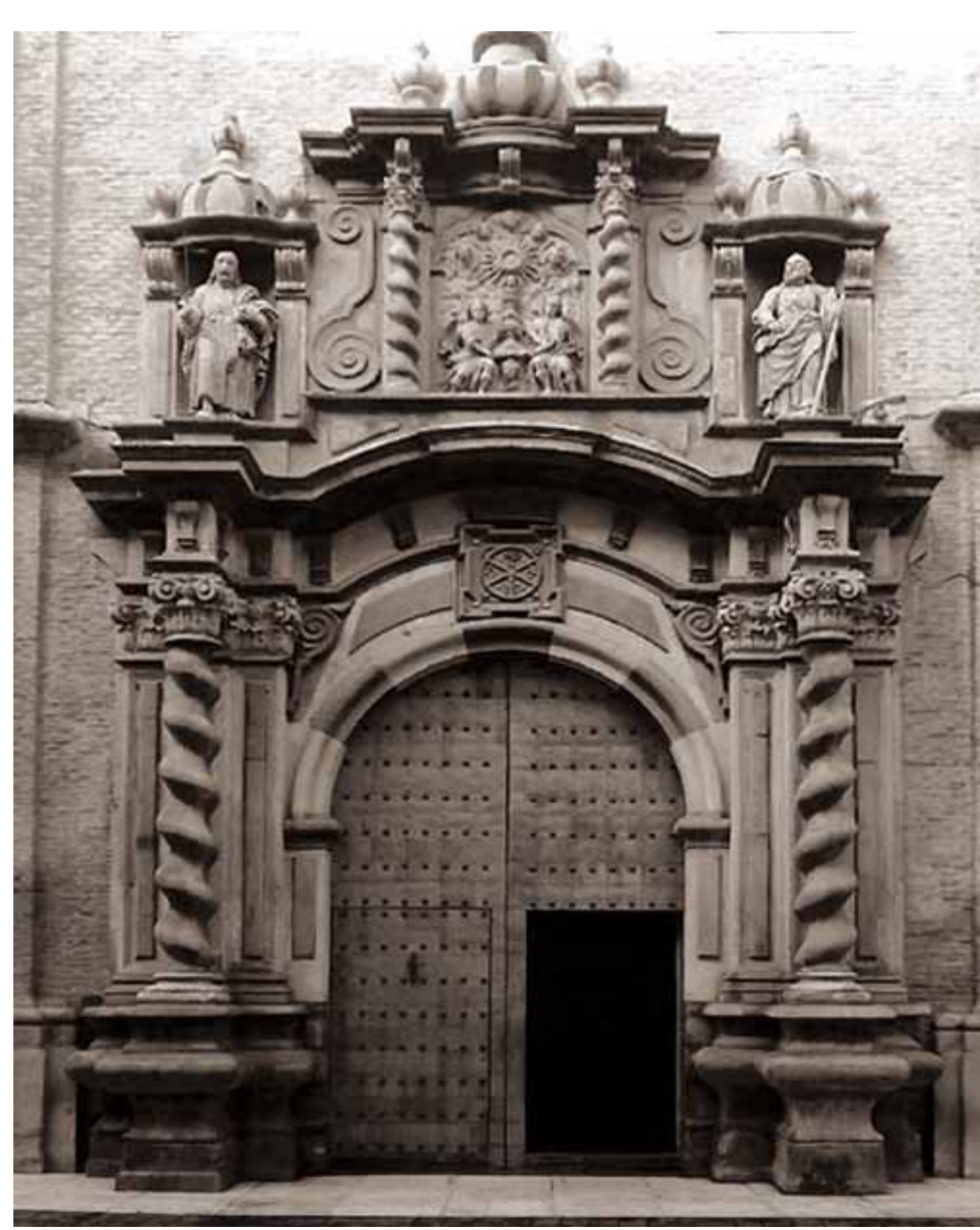
Iglesia de San Felipe y Santiago el Menor.

María Consolación de Azlor y Villavicencio (Gerona, 1773-Zaragoza, 1814), comtesse de Bureta et cousine de Palafox, a reçu une éducation soignée. À la mort de son père en 1787, la famille s'installe à Saragosse. Le 12 mai 1794, elle épouse Juan Crisóstomo López-Fernández de Heredia, 6e comte de Bureta, de qui elle devient veuve en décembre 1804. En 1808, lorsque Saragosse fut assiégée par les armées françaises, elle refusa d'abandonner la ville, collaborant activement à sa défense et mettant sa maison à la disposition de tous ceux qui en avaient besoin. Elle créa et dirigea le Corpus Amazonas, un corpus spécial de femmes qui apportait des secours aux blessés et était chargé de fournir aux combattants de la nourriture et des munitions. Elle transforma sa maison de la rue Torrenueva, qui porte le nom de la tour aujourd'hui disparue, en un hôpital et a même pris les armes lors de situations dangereuses. À la fin du premier siège, le 1er octobre 1808, elle se remarie avec Pedro María Ric. Lorsque la ville a capitulé, Lannes a permis à la comtesse et à sa famille de quitter Saragosse pour s'installer à Cadix. À la fin de la guerre, elle rentre à Saragosse.