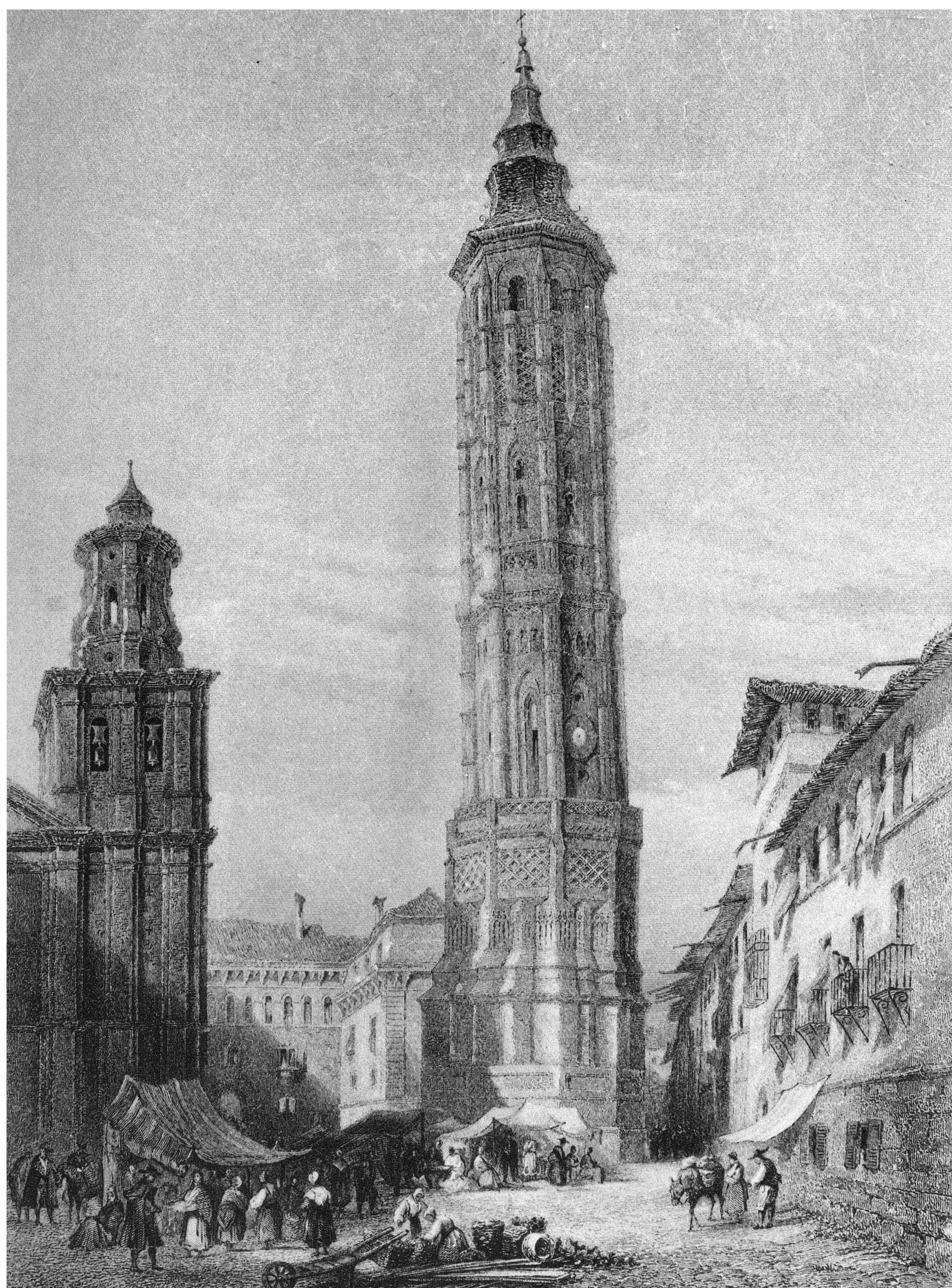
Vue de la Torre Nueva (Nouvelle Tour) démolie, dont l'emplacement stratégique au centre ville a conduit le commandement à la considérer comme la Commanderie de la tour de guet. (Dessin de E. George et lithographie de T. Heawood vers 1837).

La place San Felipe est l'une des places les plus charmantes de la vieille ville, entourée d'anciens palais de la Renaissance. C'est là que se dressait la torre Nueva (Nouvelle tour), la seule tour mudéjare de caractère civil en Espagne, qui a joué en grand rôle pendant les Sièges de Saragosse.