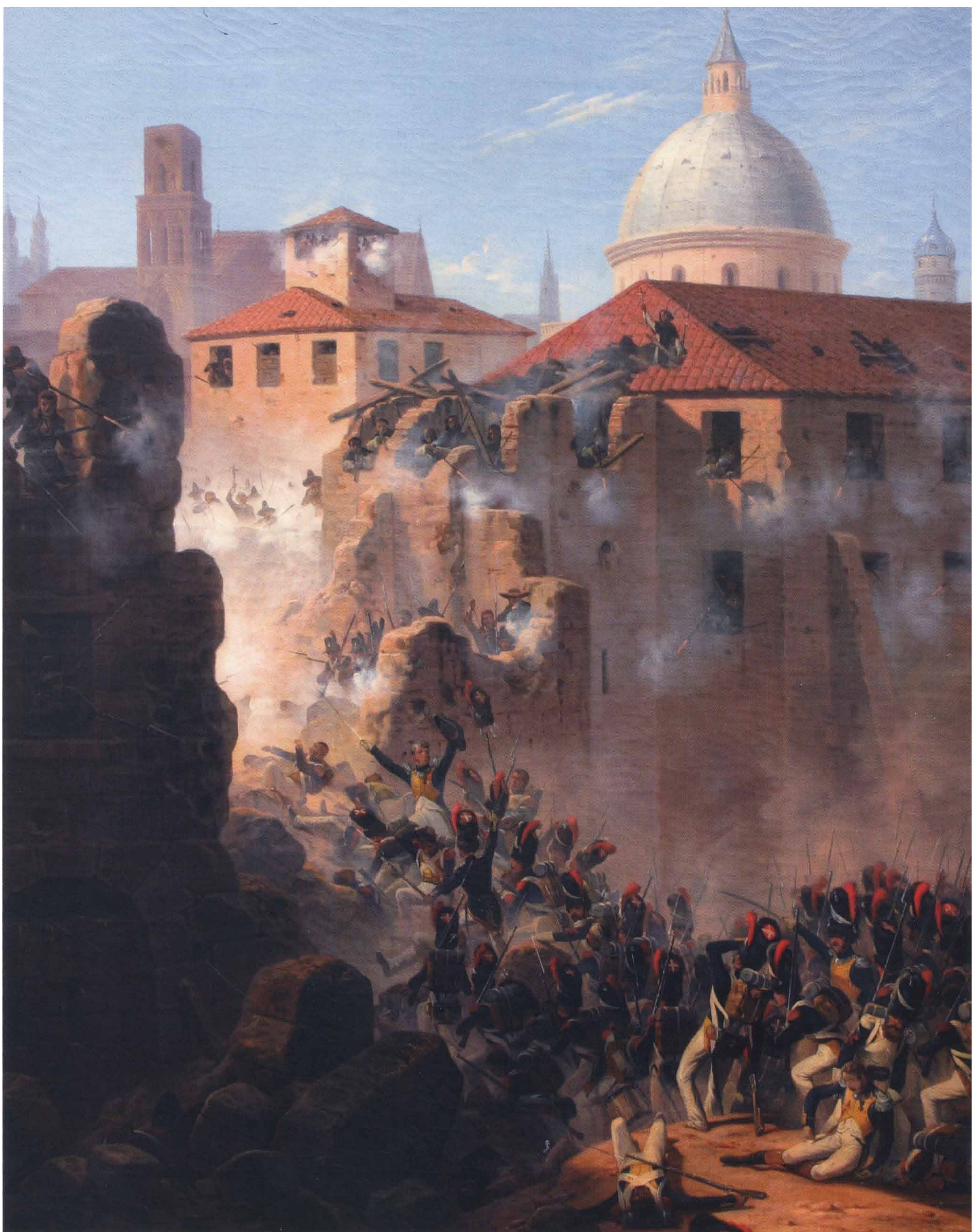
Asalto a Zaragoza , 1809. January Suchodolsky, 1845. Muzeum Wojska Polskiego, Varsovia.

Cette place se trouvait au centre de ce qui était autrefois un quartier appelé Trenque de Gimeno Gordo, un enchevêtrement de rues étroites qui commençaient à la porte Cinegia et se terminaient à l'esplanade du Pilar.