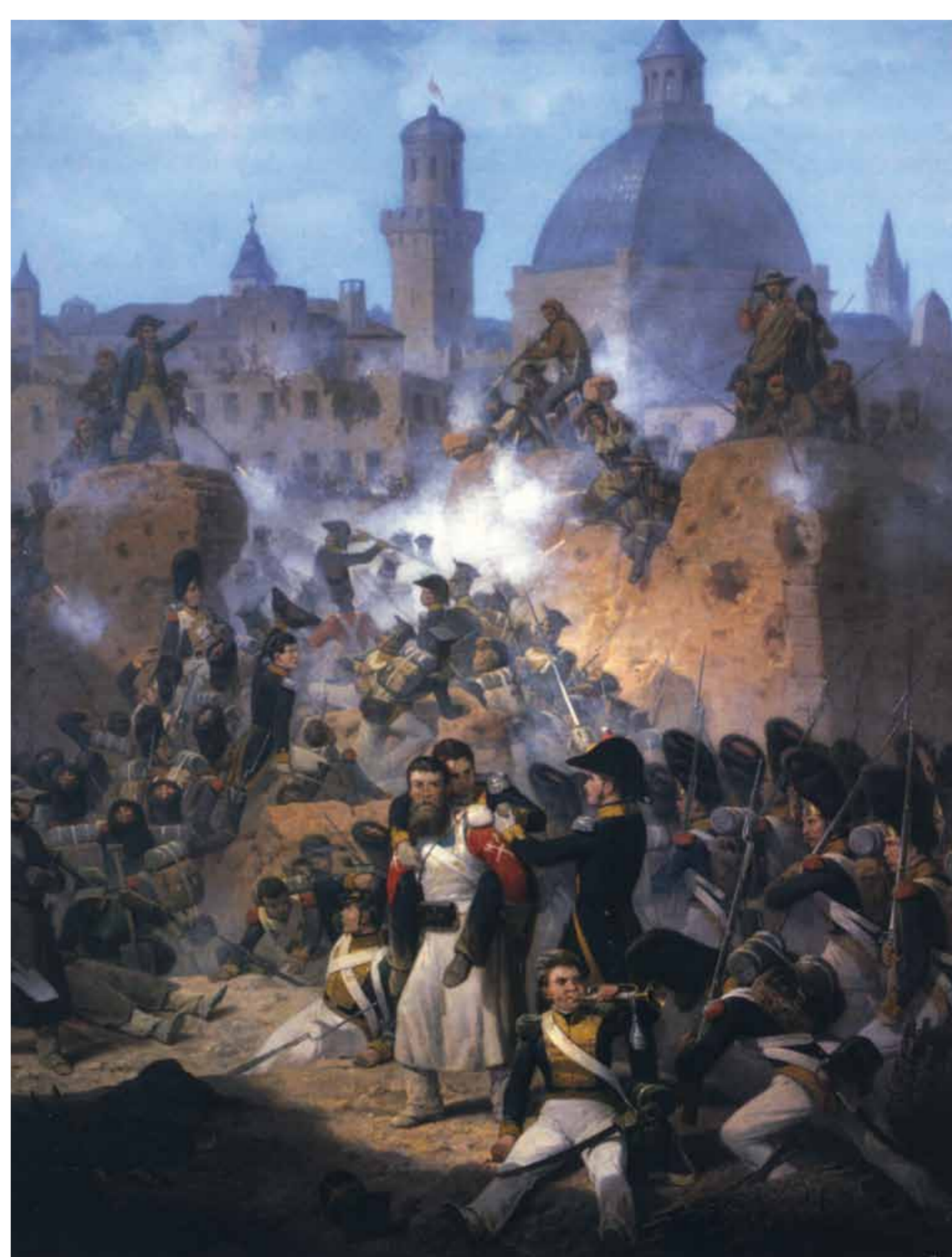
Asalto a Zaragoza, 1809. January Suchodolsky, 1870. Muzeum Wojska Polskiego, Varsovia.

Il meurt trois jours après la capitulation de la ville, assassiné par les Français, malgré le document de capitulation reflétant le respect des vies. Son corps a été jeté dans l'Èbre par le pont de Pierre, en même temps que celui du père Basilio Boggiero. À l'emplacement du pont de pierre où ils ont été tués, un monolithe les commémore.