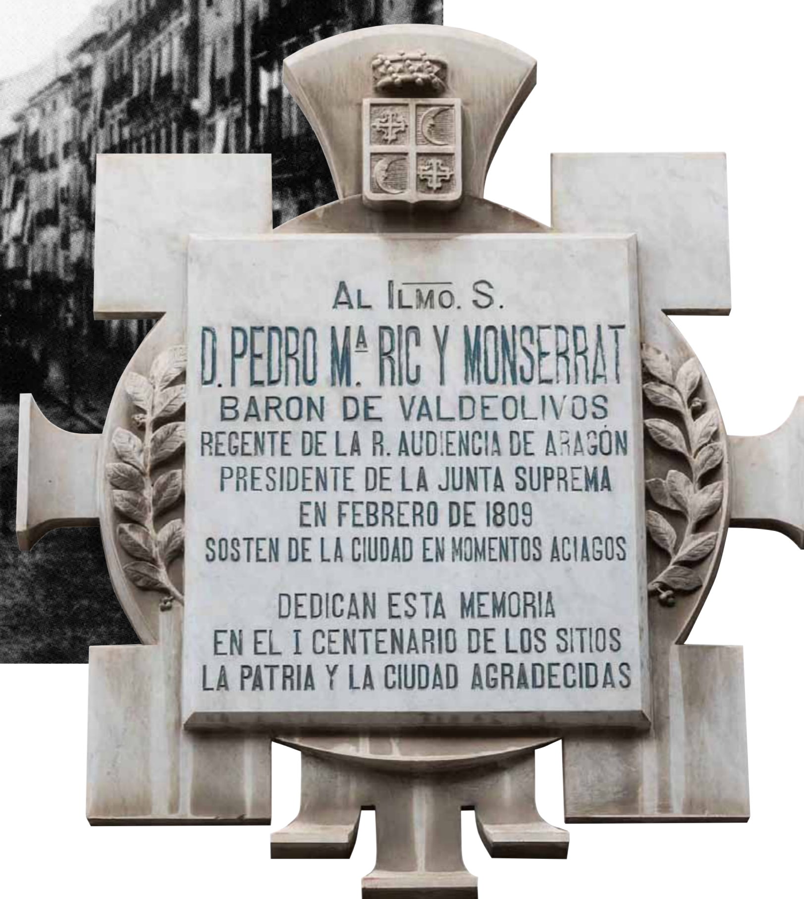
Plaque de la façade. Rappelant la figure de Pedro María Ric, baron de Valdeolivos, régent de la Cour Royale d'Aragon.