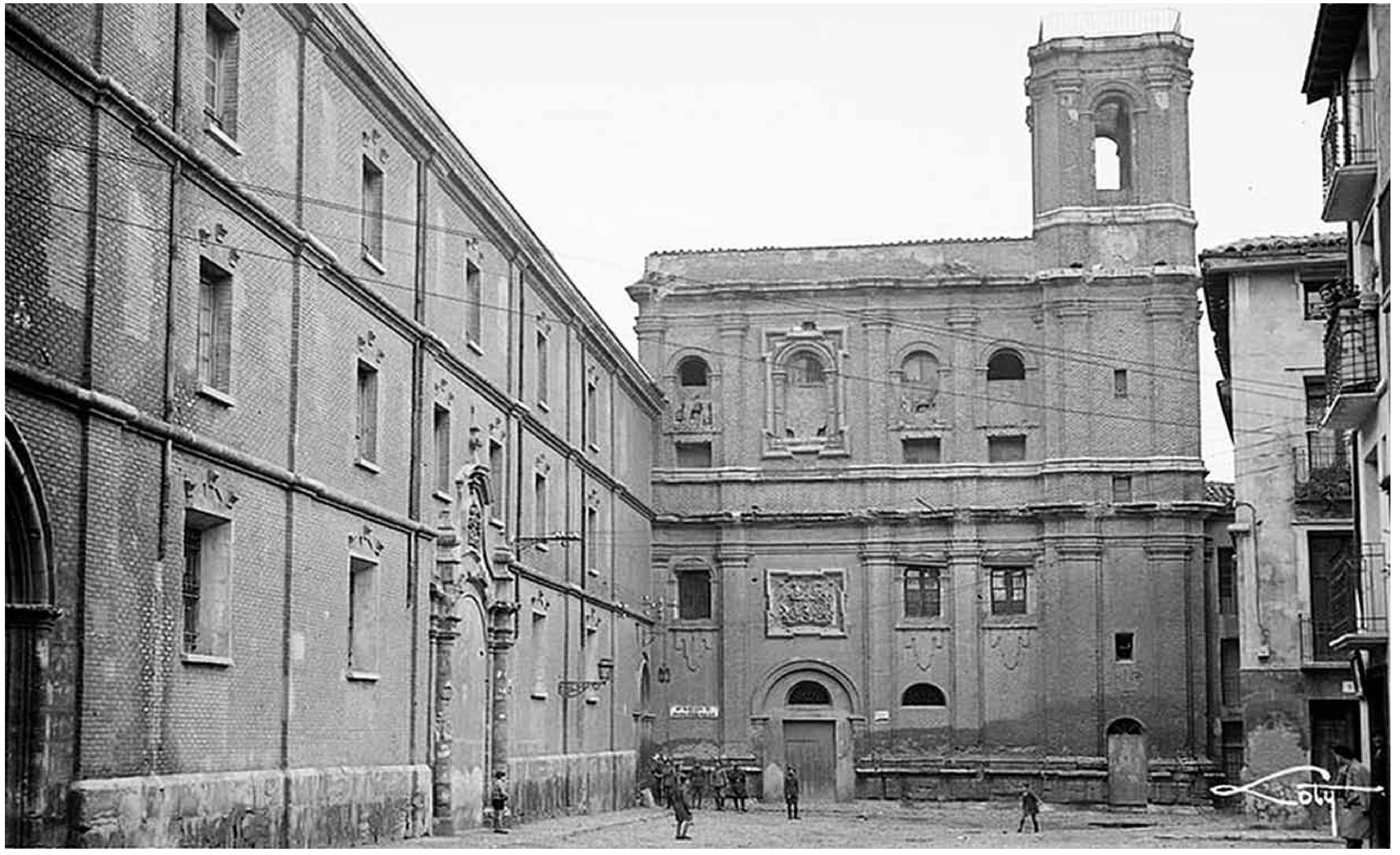
Couvent de san Agustín, 1930.

La place de San Agustín est l'un des rares espaces conservés pratiquement tels qu'ils étaient lors des sièges de la ville de Saragosse pendant la guerre d'Indépendance.