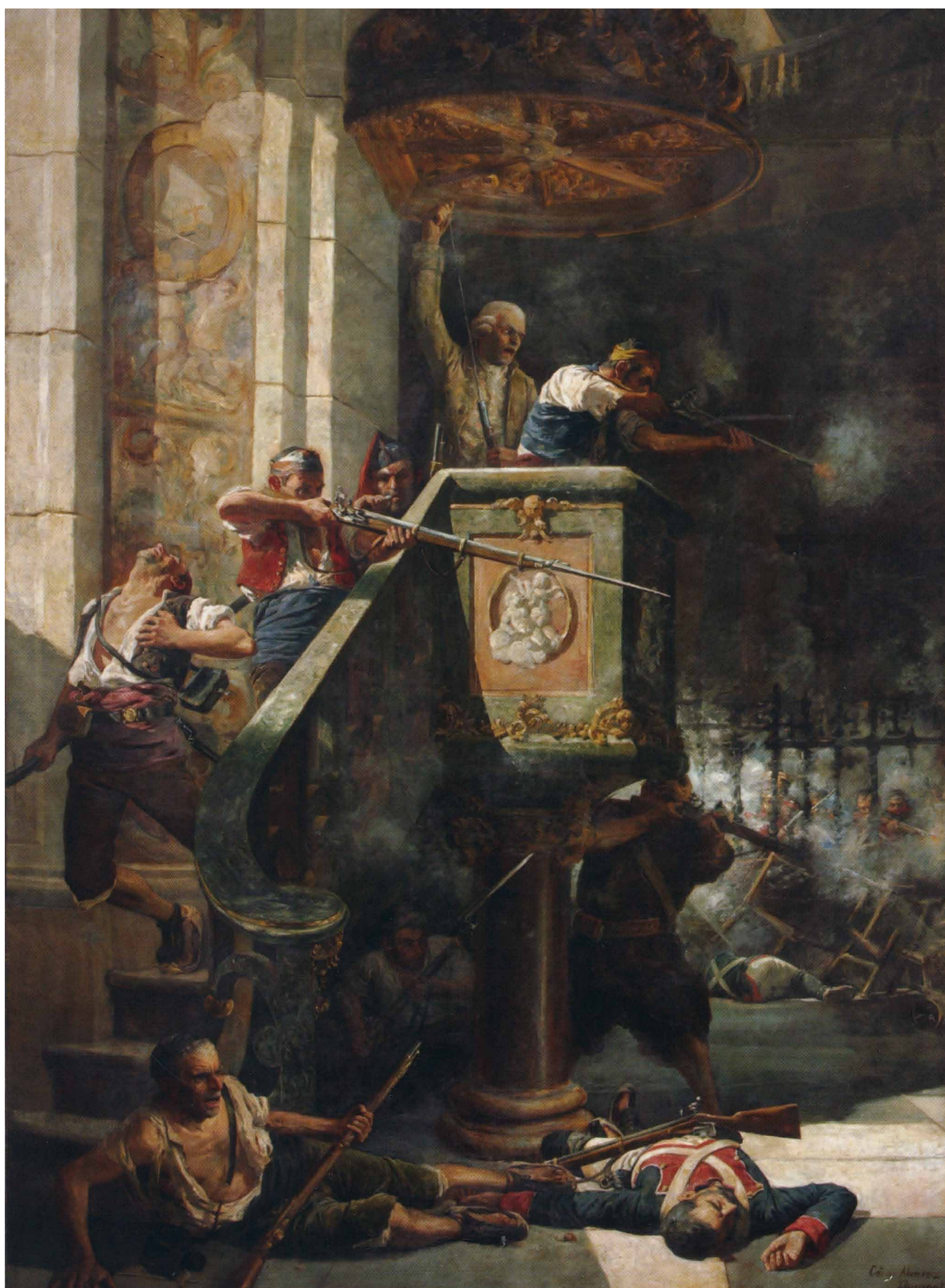
Défense héroïque de la tour de San Agustín pendant la guerre d'Indépendance. César Álvarez Dumont, 1887.

Un quartier où des batailles acharnées ont été livrées et où les Saragossais ont fait preuve d'une grande résistance dans la lutte et où les noms de ses rues, Manuela Sancho, Heroísmo, Asalto... nous parlent de ses défenseurs et de leur détermination.