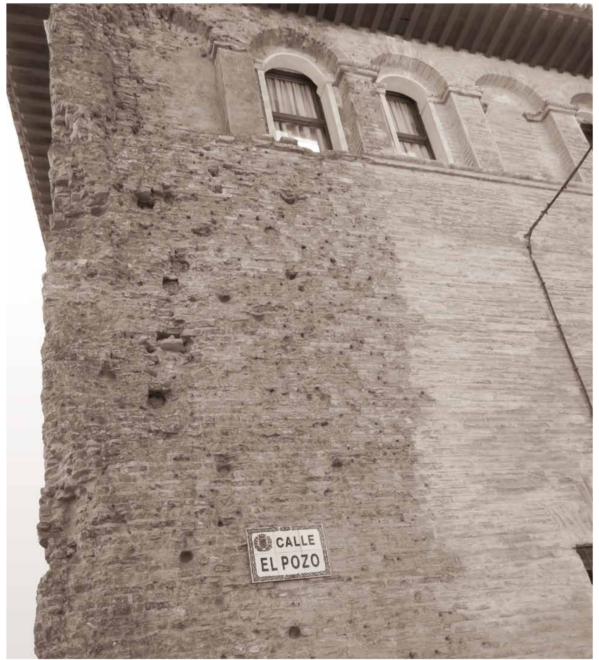
Pavillon situé au coin de Doctor Palomar n° 16 et de la rue Pozo.

Dans la rue voisine du Docteur Palomar, un magnifique manoir conserve encore les impacts des fusils français deux siècles plus tard.