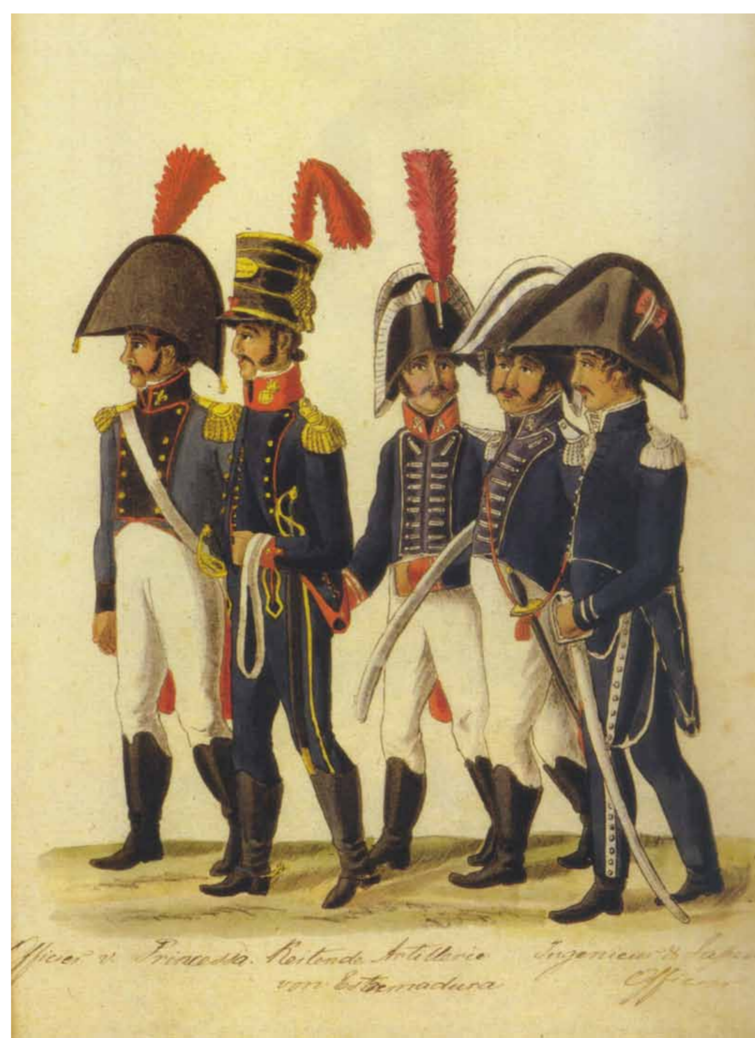
Manuscrito El Burgués de Hamburgo. Ejército español 1807-1808.

(Sevilla, 1734-Zaragoza, 1809). Capitaine général d'Aragon en 1808 et gouverneur militaire de Saragosse. Chevalier de l'Ordre de Saint-Jacques et lieutenant général. Il occupait cette fonction depuis 1797 et était un officier d'artillerie vétérinaire qui avait appris les techniques de tir sous Frédéric le Grand. Il a combattu lors du siège de Gibraltar et des îles Baléares et contre la France en 1795, et fut gravement blessé au combat. Il s'est distingué comme un sage professeur de mathématiques à l'Académie de Ségovie de 1781 à 1790. Célèbre est le voyage scientifique qu'il a commencé avec Tomás de Morla en 1787. Il meurt le 9 mars 1809 dans le château de la Aljafería où il était enfermé depuis le 24 mai 1808.