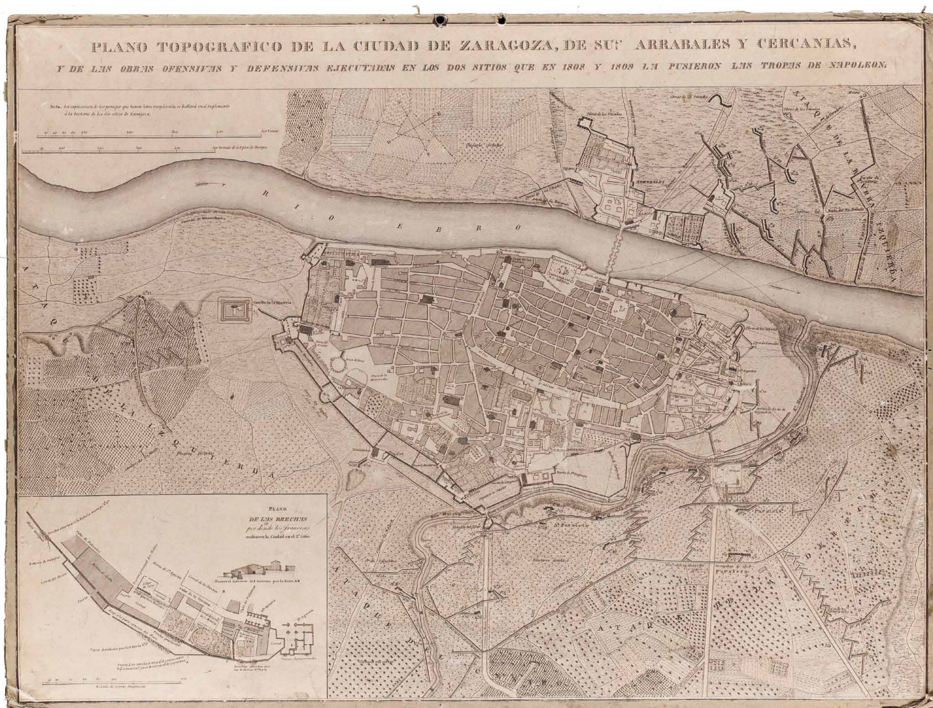
Plan du Siège de Saragosse. Archivo Municipal de Zaragoza, 4-2-0244.

Après les événements du 2 mai 1808 à Madrid, et alors que les nouvelles atteignaient toutes les capitales espagnoles, des émeutes anti-françaises éclatèrent dans beaucoup d'entre elles. Celle de Saragosse eut lieu le 23 mai.