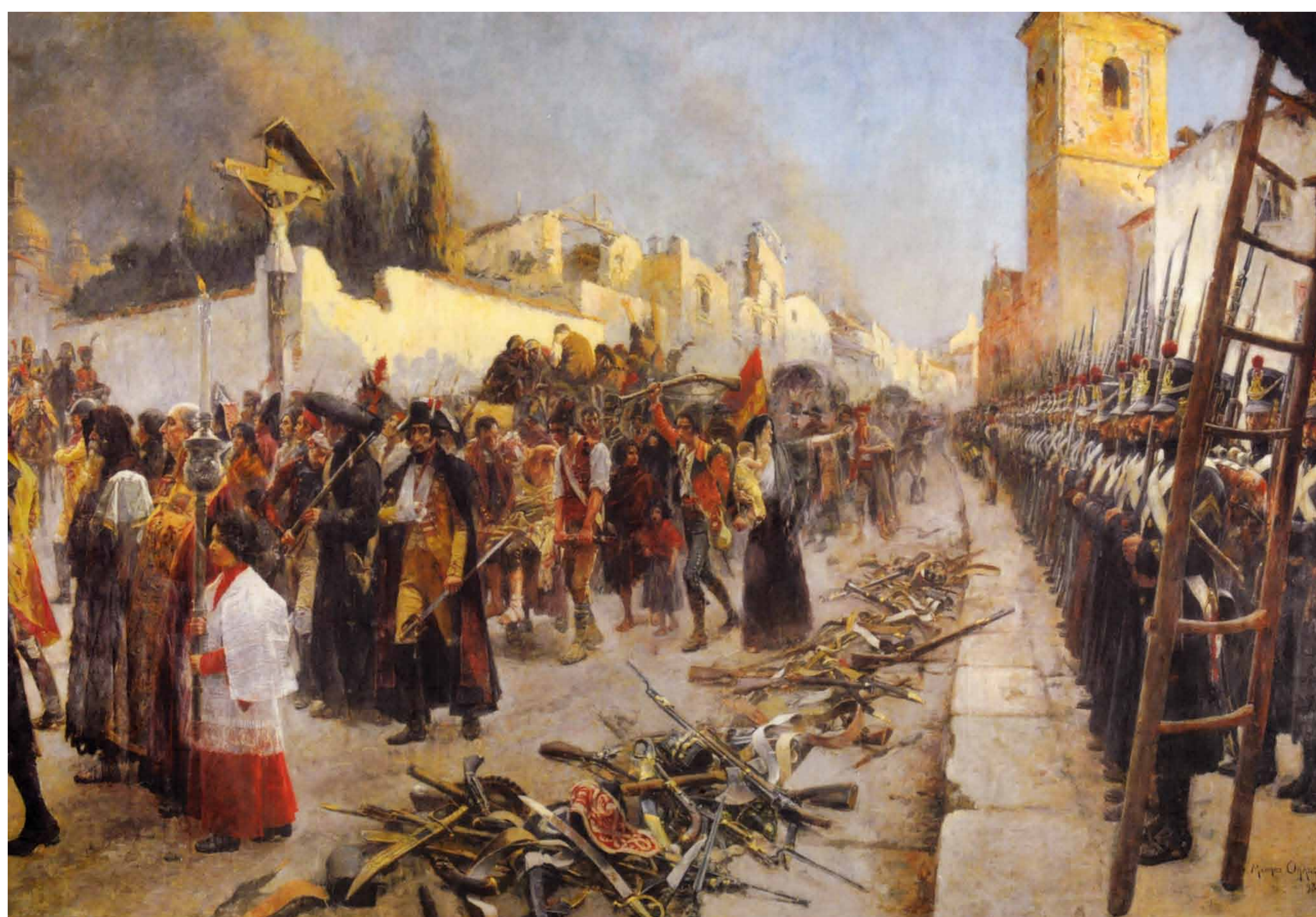
Les défenseurs de Saragosse sortant de la ville le 21 février 1809, Maurice Orange. 1893. Musée d'Art Thomas Henry Cherbourg-Octeville.

L'armée française, dans l'attente de l'évolution de la situation, avait lentement occupé certaines places stratégiques. Après avoir pris Pampelune, ils ont jeté leur dévolu sur Saragosse, la clé de la vallée de l'Ebre et un jalon important sur la route de la Basse Catalogne et de Valence.