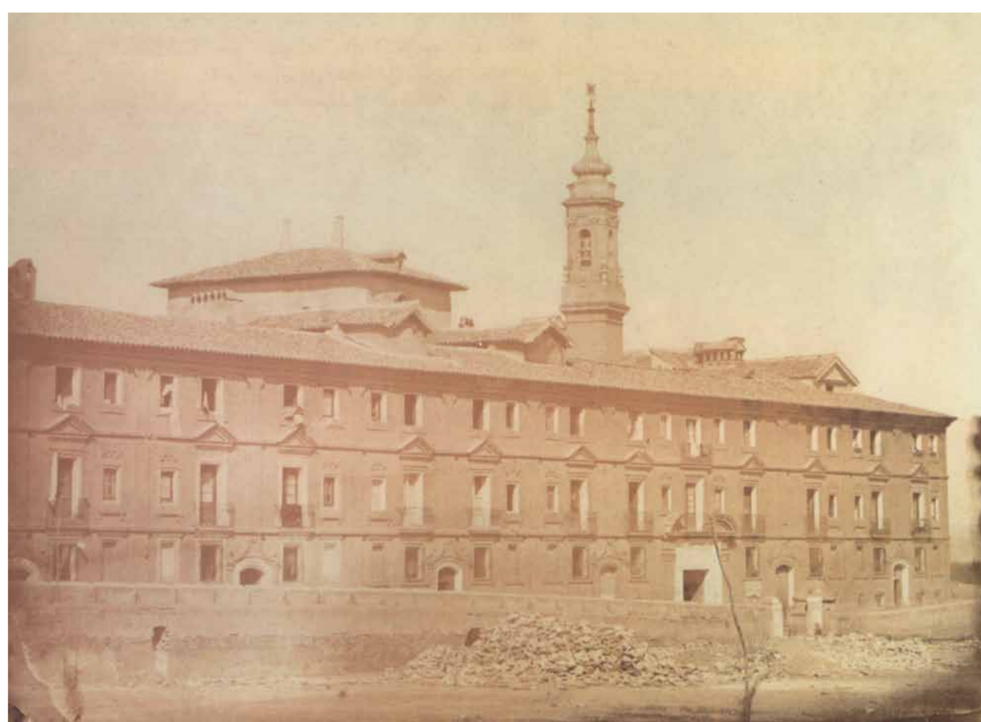
Fachada principal del Castillo de la Aljafería de Zaragoza. Mariano Júdez y Ortiz, 1859-60. Álbum de Andrés Martín e Ipas. Colección Mariano Martín Casadelrey, Zaragoza.

C'est au Castillo de la Aljafería, que la capitulation de la ville aux Français est signée le 22 février 1809 après deux sièges. Les combattants qui pouvaient encore se tenir debout ont dû rendre leurs armes sur l'esplanade de la Aljafería devant la formation des troupes françaises.