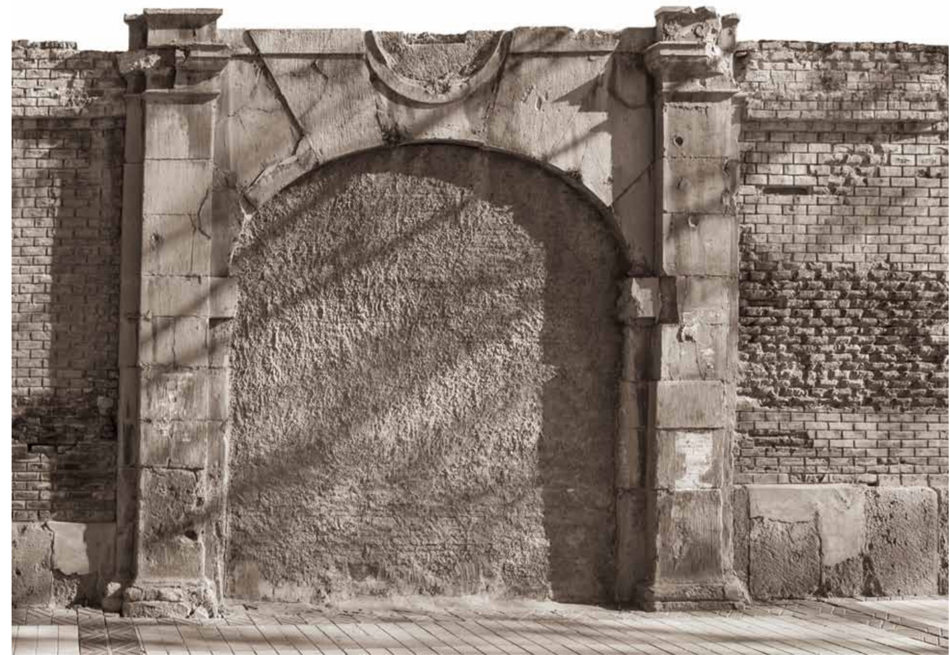
Toile de ce qu'était la Caserne de la Cavalerie, appelée Cuartel del Cid (Caserne du Cid) en face de l'usine Averly État actuel.