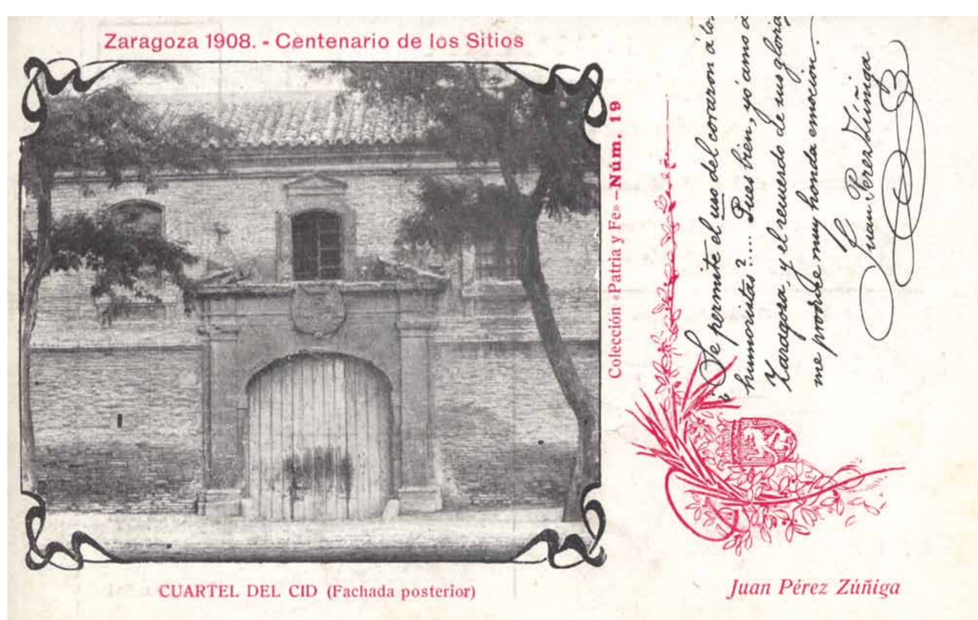
Carte postale éditée à l'occasion du Centenaire des Sièges de Saragosse, 1908. Cuartel del Cid. Archivo Municipal de Zaragoza, 4-1_016308.

Sur Paseo de María Agustín, on peut encore voir le tableau de la façade arrière de l'ancienne caserne de cavalerie. Cette caserne a été construite entre 1774 et 1775 et était connue plus tard sous le nom de « caserne du Cid ». L'une des attaques françaises, celle du 15 juin 1808, a eu lieu à cette caserne. C'est par cette porte et ces fenêtres que les soldats français sont entrés dans la ville, mais les habitants de Saragosse les ont arrêtés après une bataille sanglante.