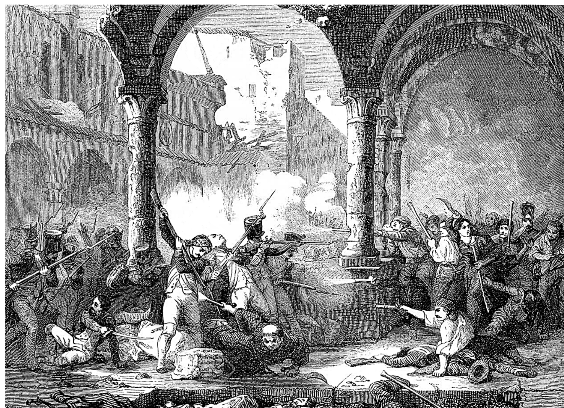
Sitio de Zaragoza, grabado ilustración de la Historia de Francia . 1885.

Sur le site de l'actuel Banco de España se trouvait l'Hôpital Général de Nuestra Señora de Gracia, le seul grand hôpital de la ville. À la suite des destructions subies lors du premier Siègle, les internés ont été transférés à l'hôpital dit de Convalescence, mieux connu aujourd'hui sous le nom d'Hôpital Provincial. Lors du second Siègle, il s'est complètement effondré à cause des bombardements français.