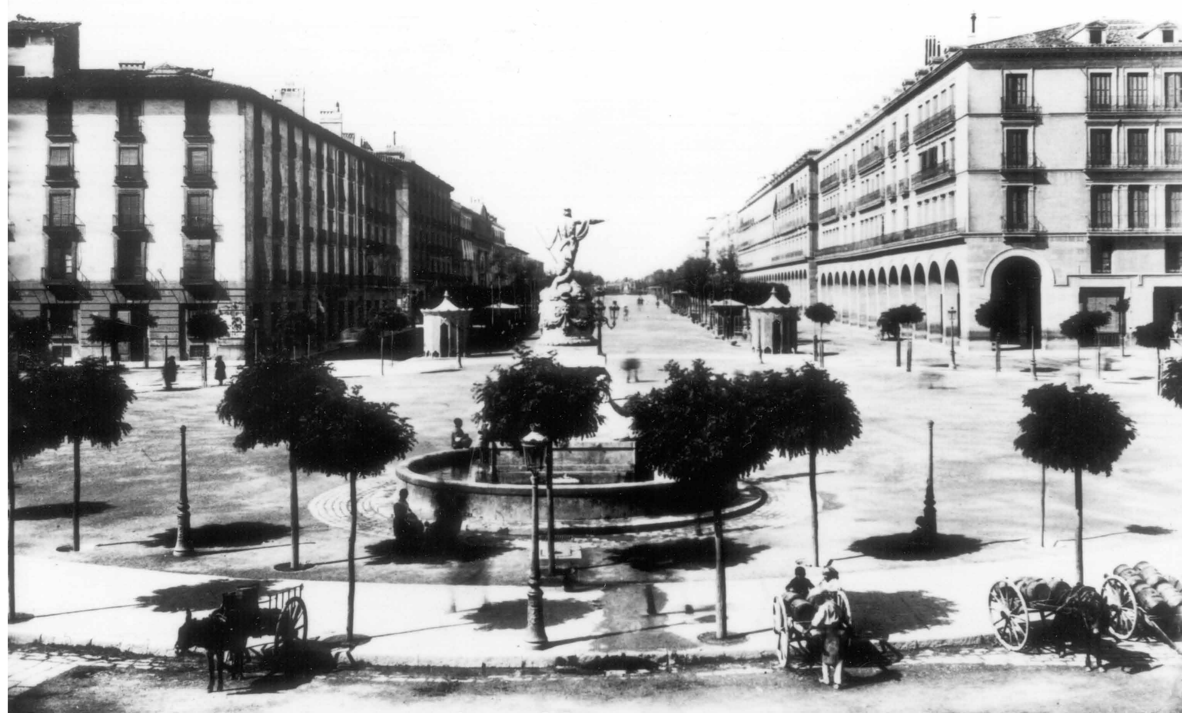
Place de la Constitution, actuelle Place d'Espagne. Paseo de Santa Engracia, actuel Paseo de la Independencia. Fontaine de la Princesse ou de Neptune. Dans les années 1900. Archivo Municipal de Zaragoza, 4-1_0454.

L'hôpital Nuestra Señora de Gracia est connu dans le monde entier pour son assistance aux malades mentaux, et surtout à la fin du XVIIIe siècle pour les possibilités thérapeutiques du travail sur les malades mentaux, observées et pratiquées ici.