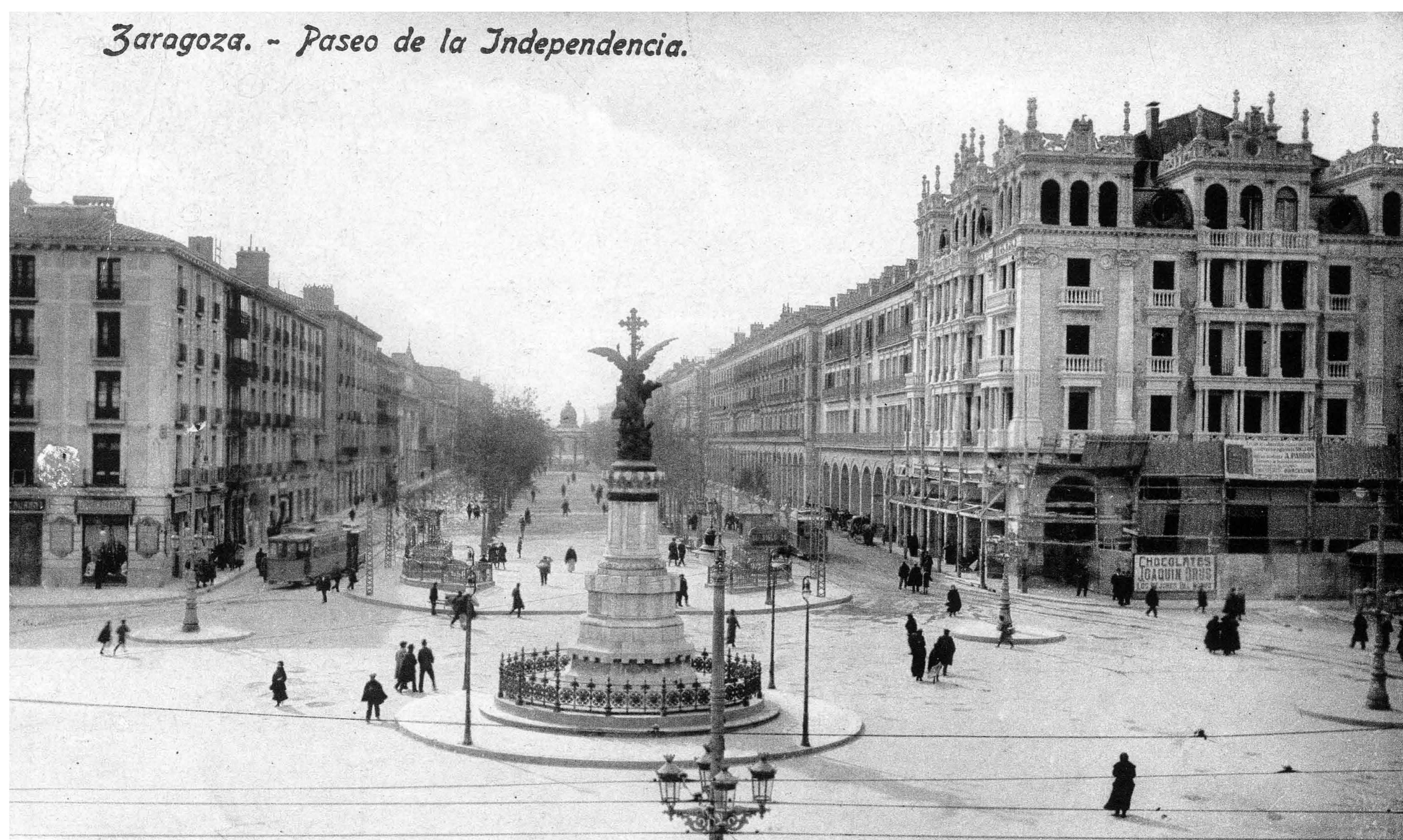
Le Monument aux Martyrs a été inauguré le 23 octobre 1904. Il a été conçu par Ricardo Magdalena et l'ensemble sculptural, coulé en bronze, est l'œuvre d'Agustín Querol. Archivo Municipal de Zaragoza, 4-1_0148.

À droite se trouvent les ruines de la Cruz del Coso, détruite par un coup de canon français lors du premier Siège. Aujourd'hui, au même endroit, se dresse depuis 1908 le monument aux Martyrs de la Religion et de la Patrie, une sculpture représentant la Foi tenant un défenseur blessé avec un fusil à ses pieds.