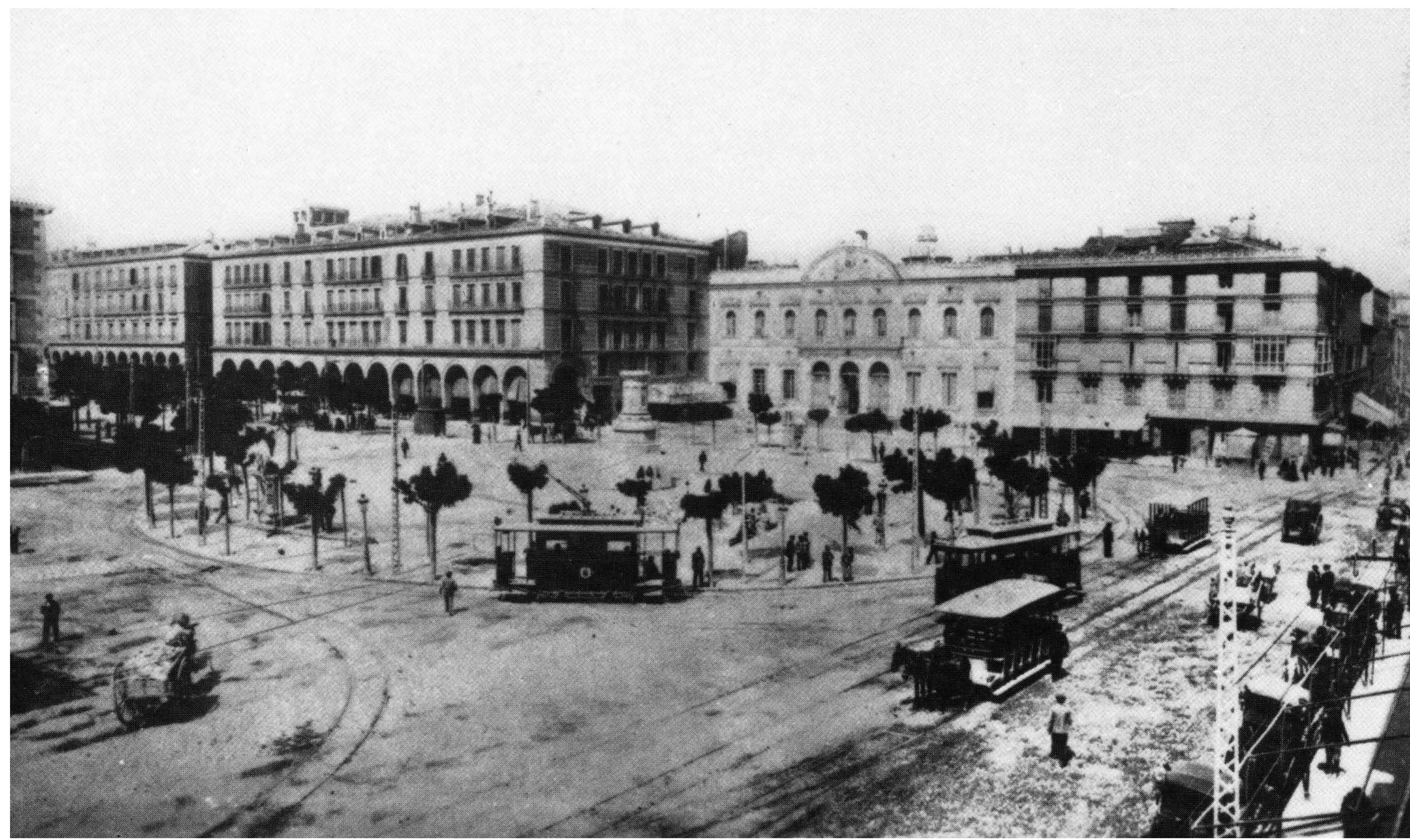
Place de la Constitution, actuelle Place d'Espagne. Vers 1902. Archivo Municipal de Zaragoza, 4-1_0190.

La rue voisine de Cuatro de Agosto , dans le populaire Tubo, commémore le jour où les soldats de Napoléon y sont passés après avoir occupé le monastère des Jerónimos, sur l'actuelle Place de Santa Engracia. Ce jour de 1808, les envahisseurs furent repoussés par les défenseurs qui, avec de maigres moyens, livrèrent l'une des batailles les plus sanglantes du premier Siègle.