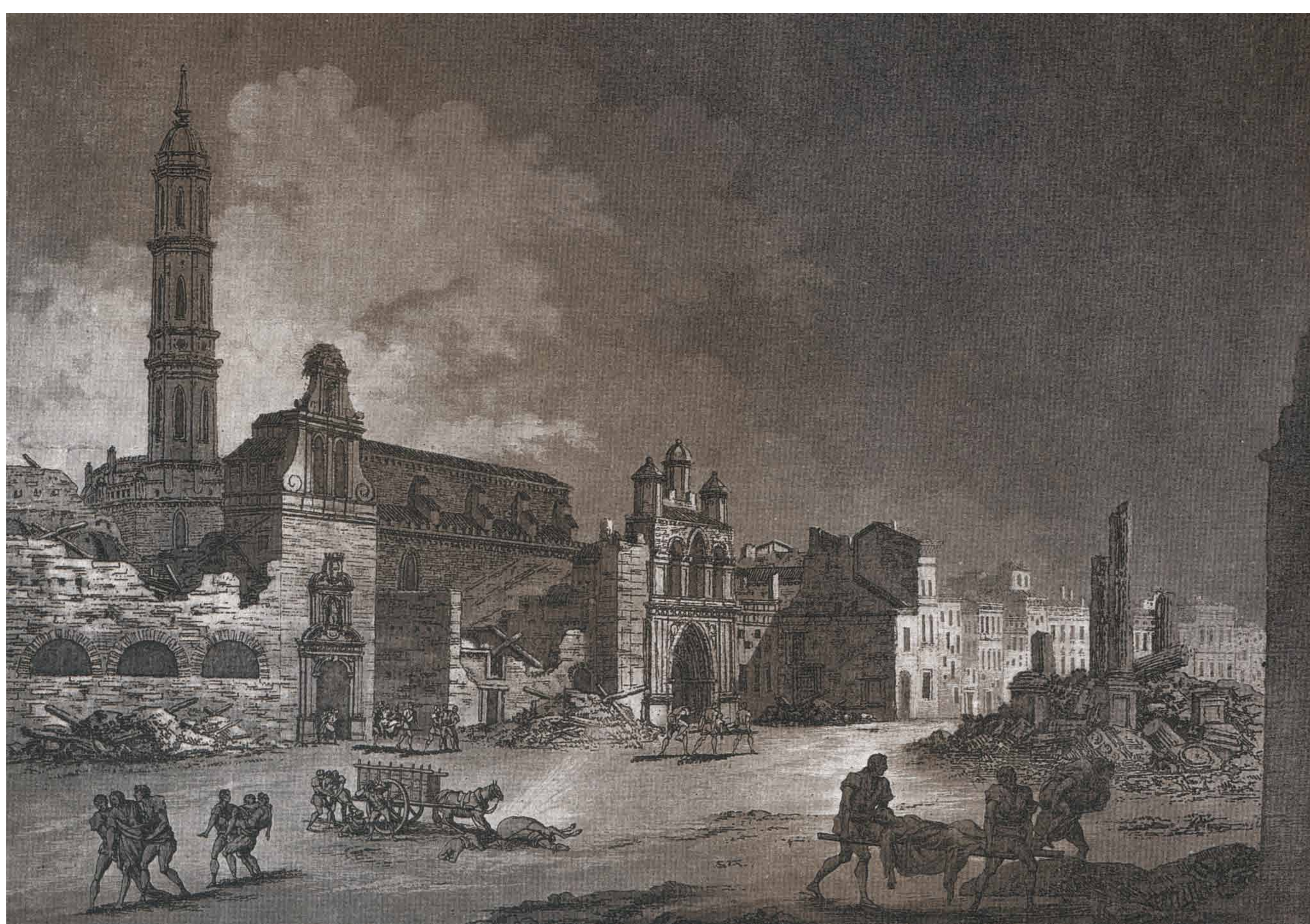
Grabado de Gálvez y Brambila. Vista de la calle del Coso.

L'actuelle place d'Espagne était appelée place de San Francisco à l'époque des Sièges. Une zone où se sont livrées des batailles décisives, un point de pénétration maximale des Français lors du premier Siège.