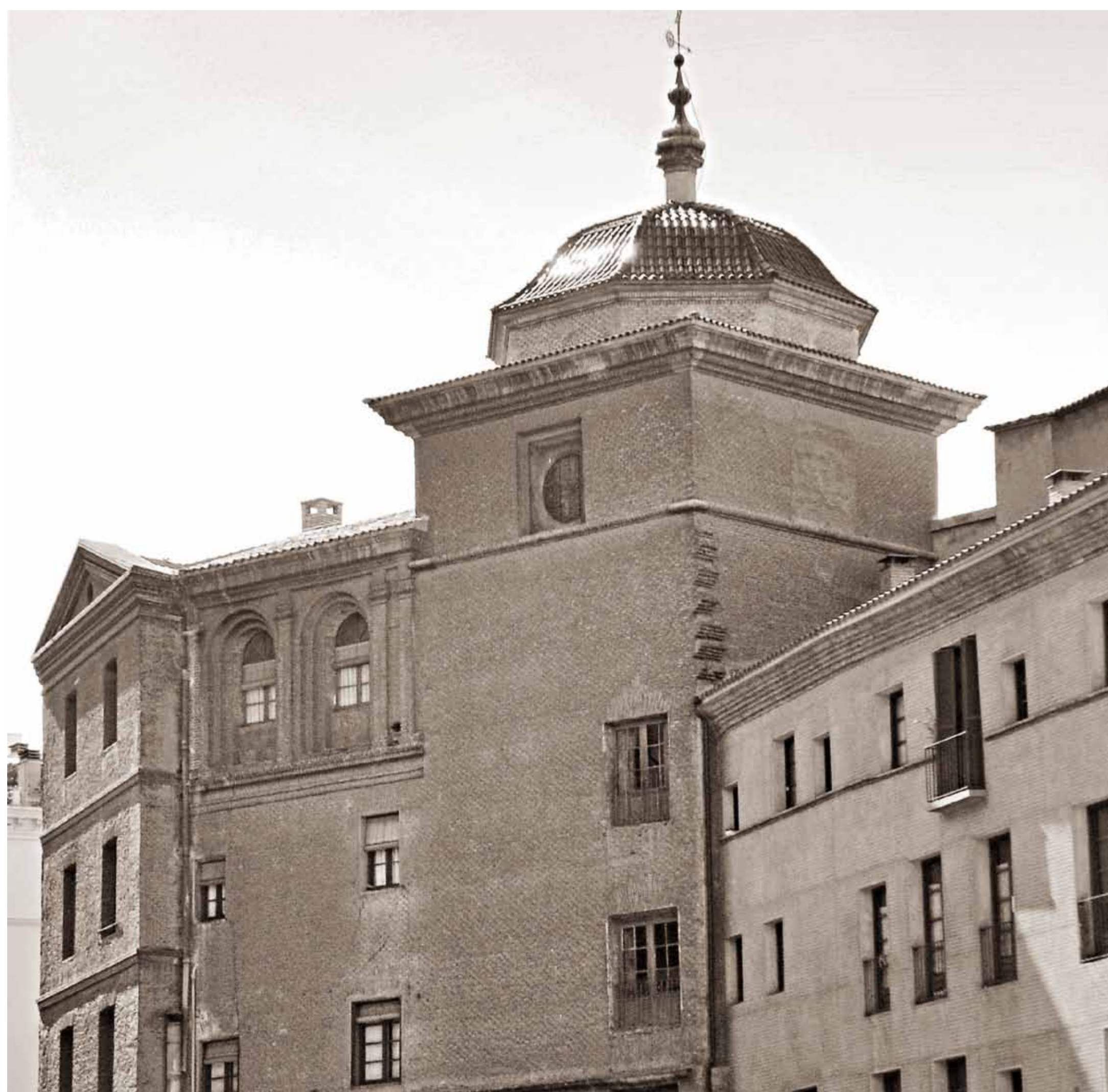
Fachada posterior del Seminario de San Carlos.

« Le 27 juin, à trois heures de l'après-midi, tous les bâtiments ont tremblé et les habitants ont cru qu'ils allaient être ensevelis dans leurs ruines. Ni le tonnerre le plus violent, ni le bruit de cent canons tirés en même temps ne sont comparables à cette explosion. Le frisson fut universel, une fumée dense obscurcissait l'atmosphère ; les gens sortaient de leurs maisons saisis par la peur et, incapables de verser une larme, pâles et confus, ils ne savaient pas où aller ».