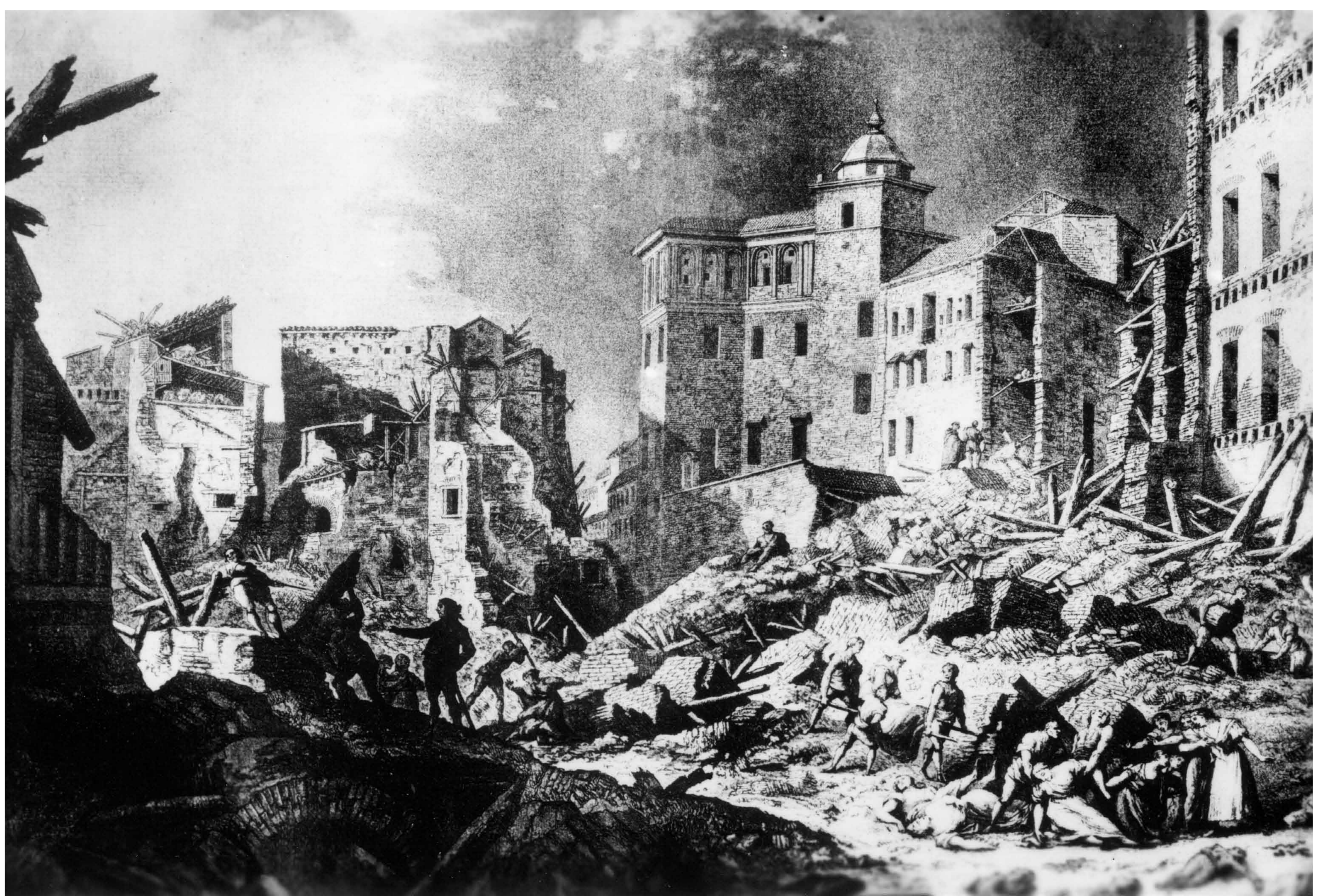
Grabado de Gálvez y Brambila. Ruinas del Seminario. Archivo Municipal de Zaragoza, 4-1_01523.

Le 27 juin 1808, lors du premier Siège français de la ville de Saragosse, il y a eu une énorme explosion dans la poudrière générale de la ville située dans ce bâtiment, aujourd'hui Séminaire de San Carlos.