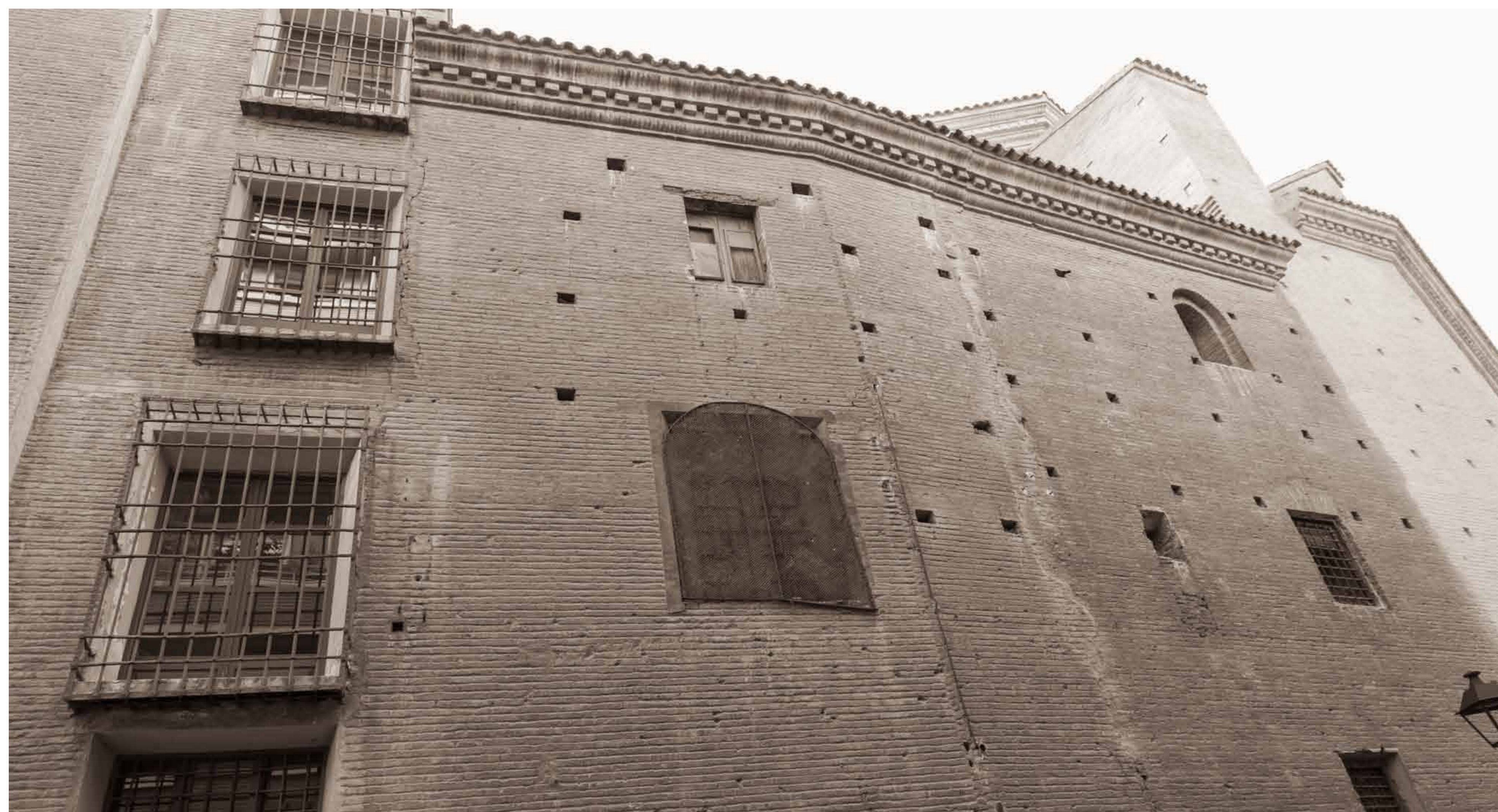
Un des côtés de l'église de San Carlos montrant les impacts de balles de l'époque des Sièges.