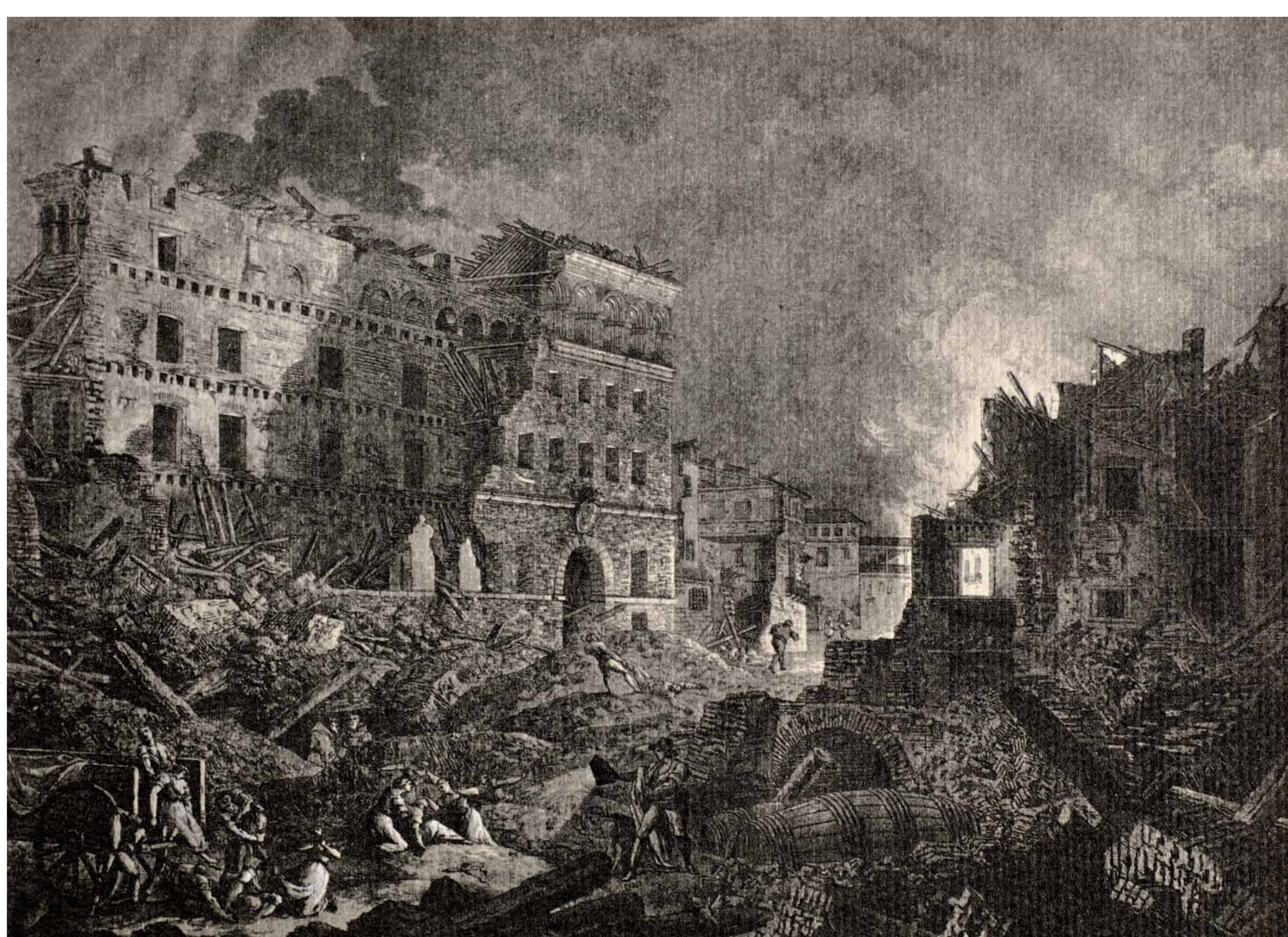
Gravure de Gálvez y Brambila. Vue des ruines du Séminaire de San Carlos après l'explosion du 27 juin 1808.

Le Séminaire Royal de San Carlos a commencé à être construit sur ordre de la Compagnie de Jésus, sous le nom de l'Église de Inmaculada y el Padre Eterno, au XVIIe siècle, sur l'emplacement de l'ancienne synagogue du quartier juif.