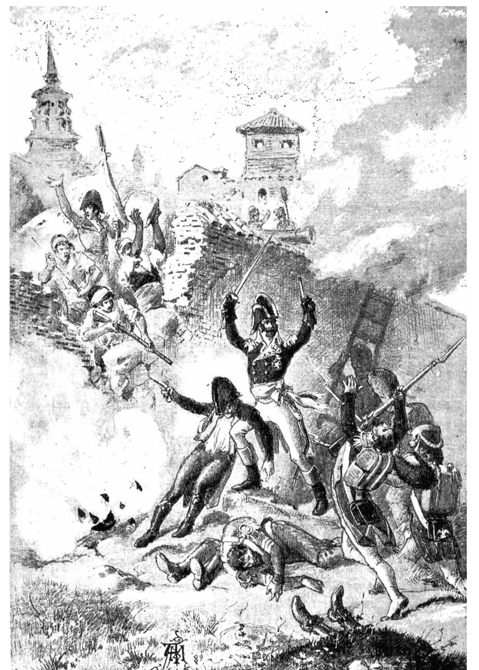
Defensa heroica de Zaragoza. Ilustración de Arturo Mérida, para la edición Episodio nacional , Zaragoza de Pérez Galdós, publicado en 1882.