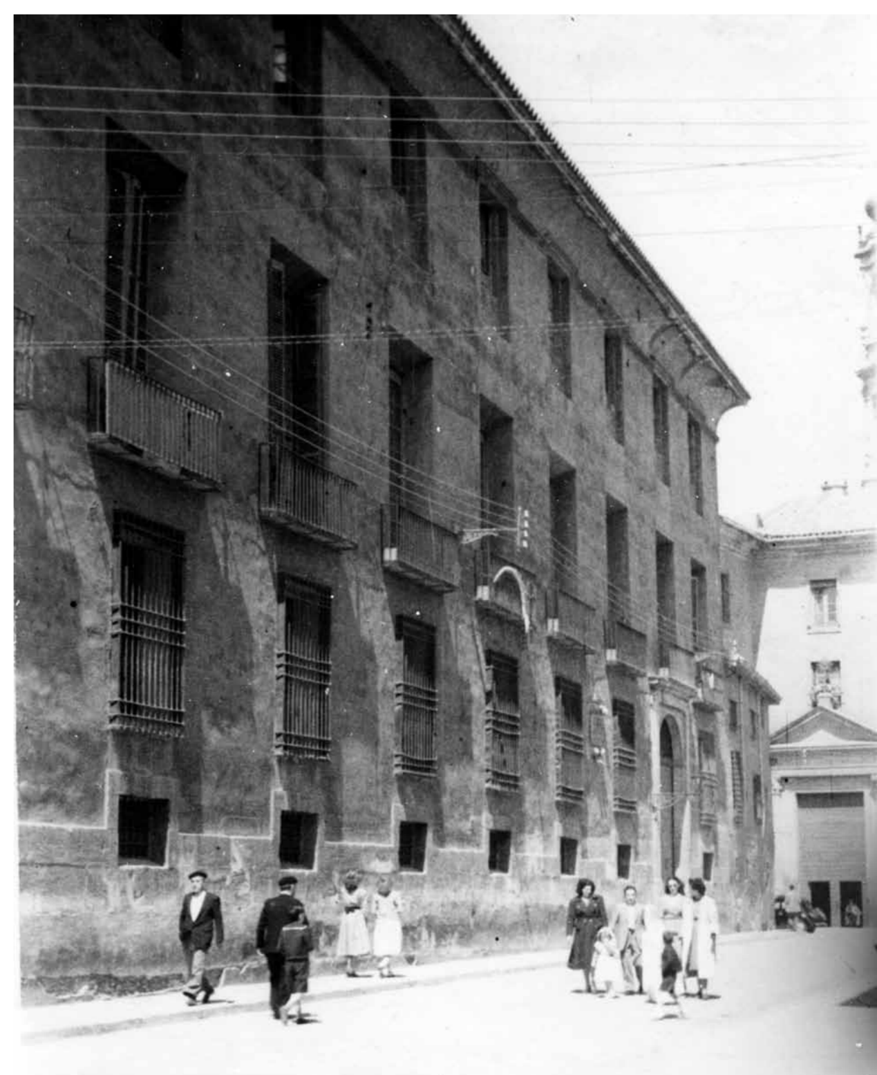
Maison natale de Palafox. Au fond, la cathédrale de San Salvador.