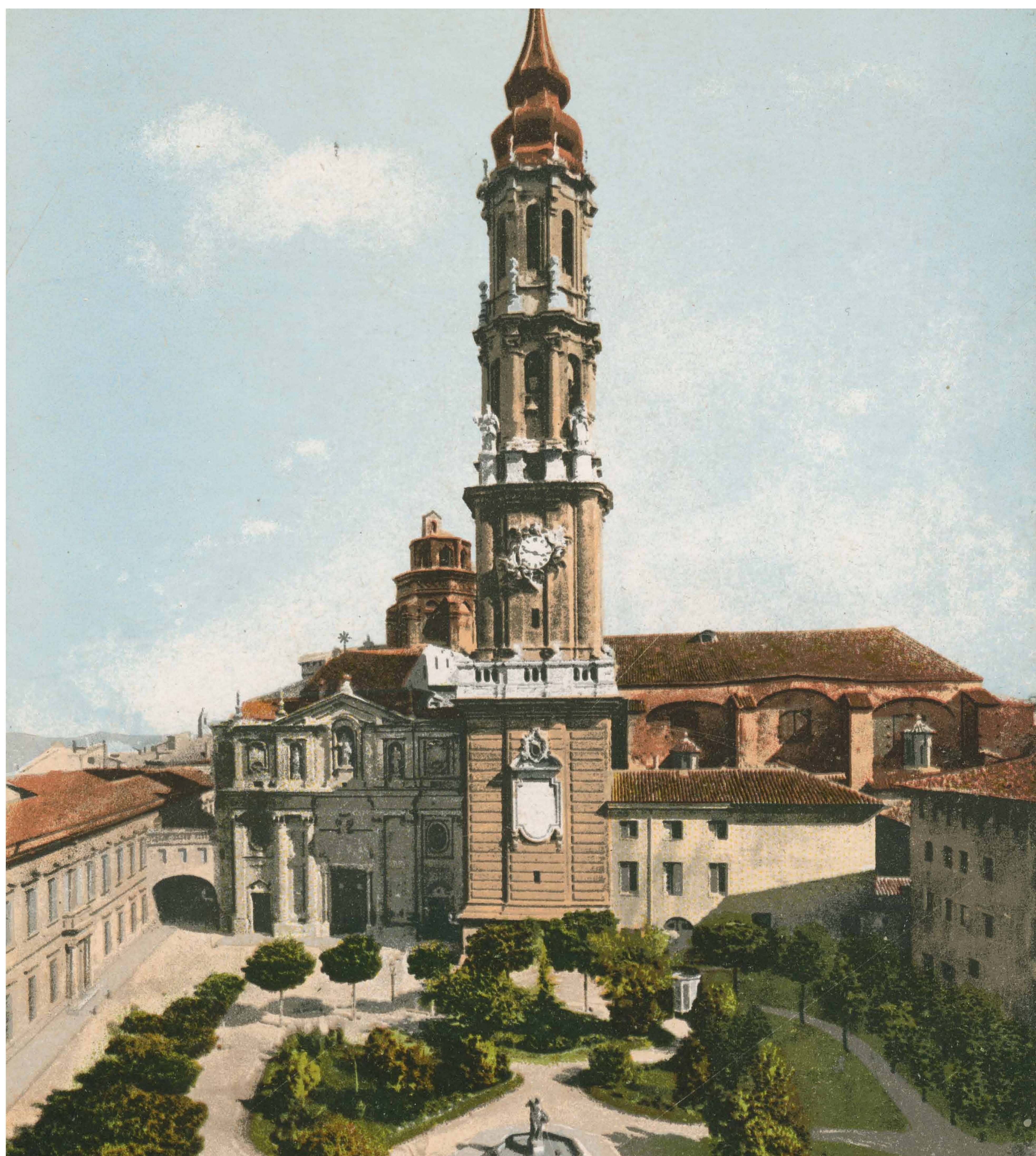
Postal de la plaza de la Seo, con Palacio episcopal y Catedral de San Salvador. Edita Cecilio Gasca, Zaragoza. Archivo Municipal de Zaragoza, 4-1_0085

A PALAFOX/ Al gran Caudillo defensor de Zaragoza/ en los Sitios de 1808 y 1809/ LA PATRIA Y LA CIUDAD/ por él/ gloriosamente defendidas./ 1er. Centenario de los Sitios (À PALAFOX, grand défenseur de Saragosse lors des sièges de 1808 et 1809, ayant glorieusement défendu la patrie et la ville. 1er Centenaire des Sièges)