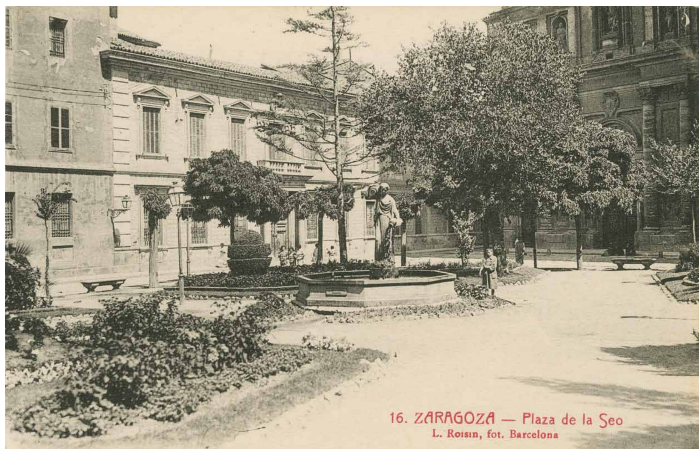
Plaza de la Seo con la fuente de la Samaritana y Palacio Arzobispal.

Pendant les Sièges, l'actuel palais épiscopal était le quartier général de Palafox. Du haut du bâtiment, il pouvait suivre en détail le sort de son détachement dans l'Arrabal, de l'autre côté de la rivière. Ses archives conservent encore des documents de l'époque, brisés par les éclats de canons et les impacts de balles.