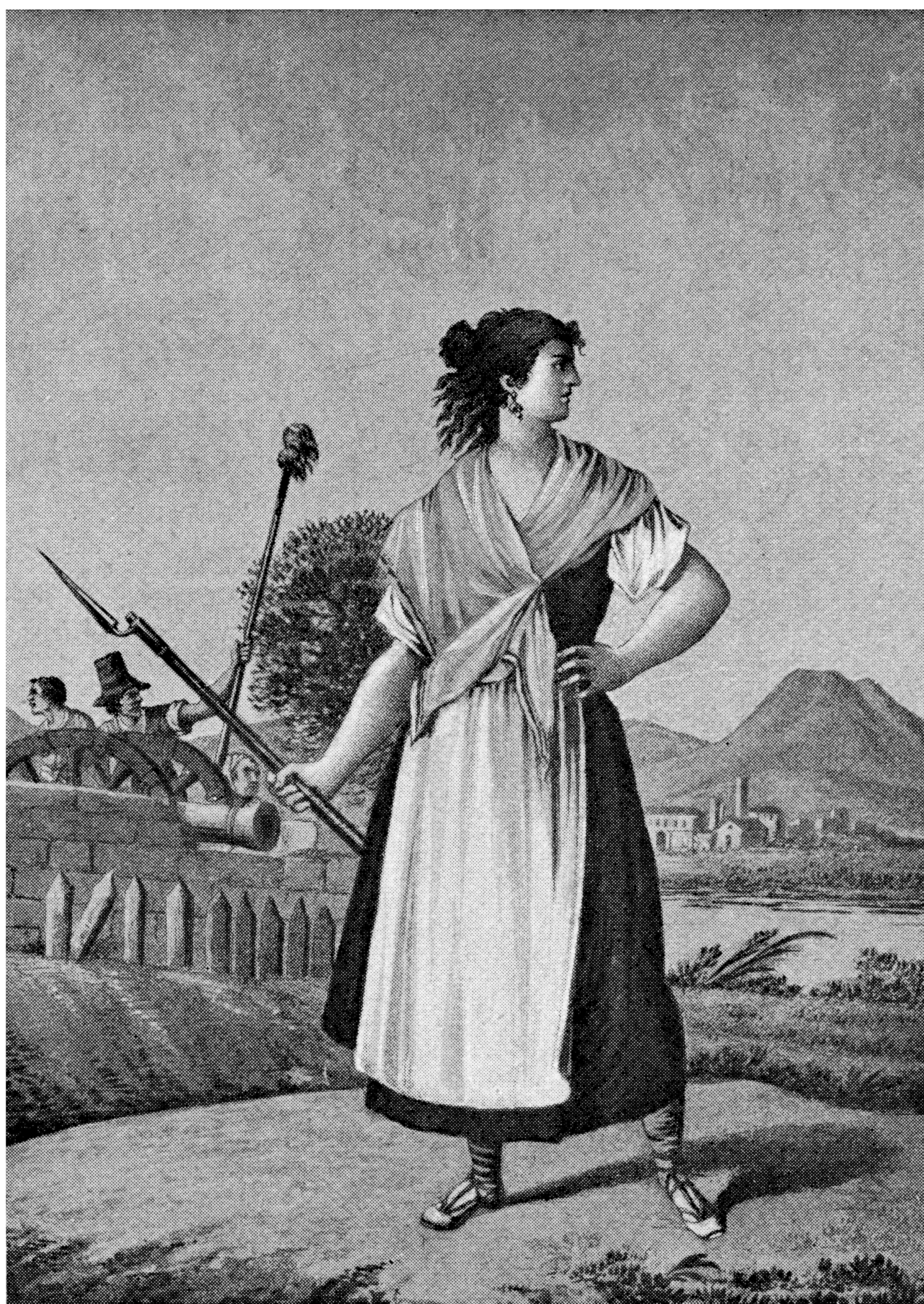
Casta Álvarez de Zaragoza: Heroína que defendió con notable valor y bizarría la batería de la Puerta de Sancho. Archivo Municipal de Zaragoza, 4-1_0282.

Les environs de la place actuelle ont été le scénario d'importantes batailles lors des sièges de Saragosse en 1808-1809.