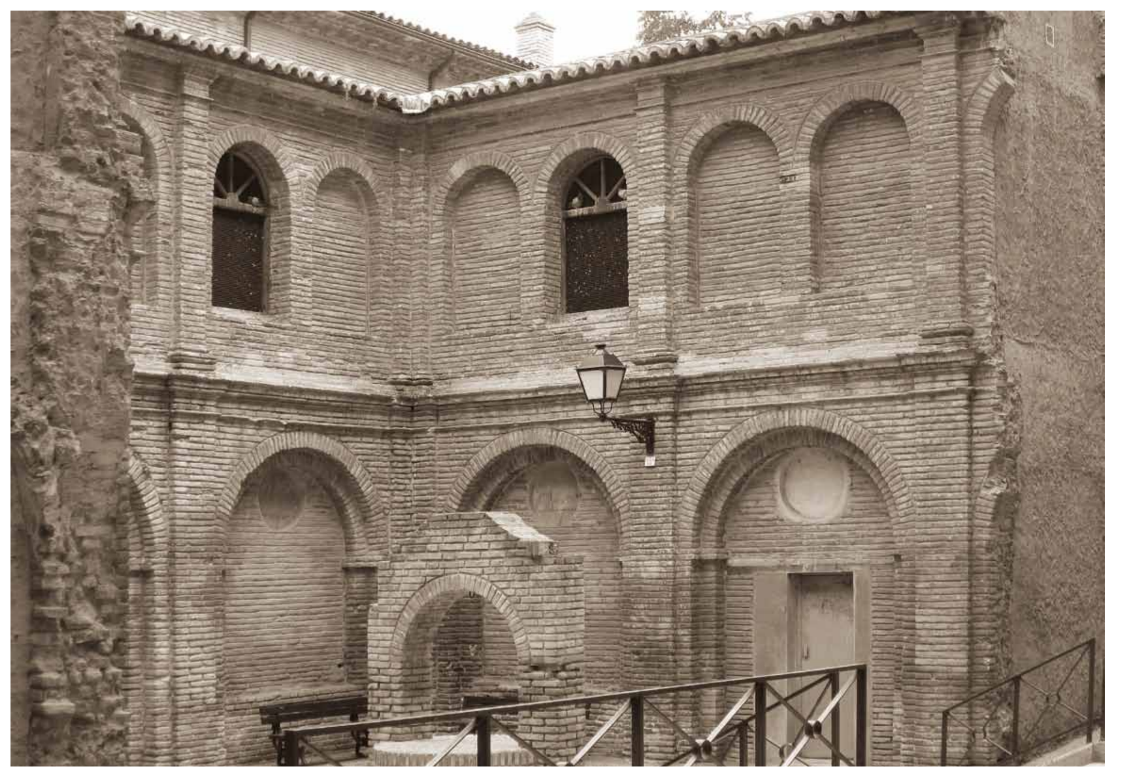
Claustro de la iglesia de Las Fecetas, antiguo convento de Carmelitas Descalzas de Santa Teresa.

Dans cette zone, au centre d'une grande étendue de potagers, se trouvait le couvent de Carmelitas Descalzas de Santa Teresa, plus connu sous le nom de couvent des Fecetas. Aujourd'hui, il ne reste que son église et une partie de son cloître en briques.