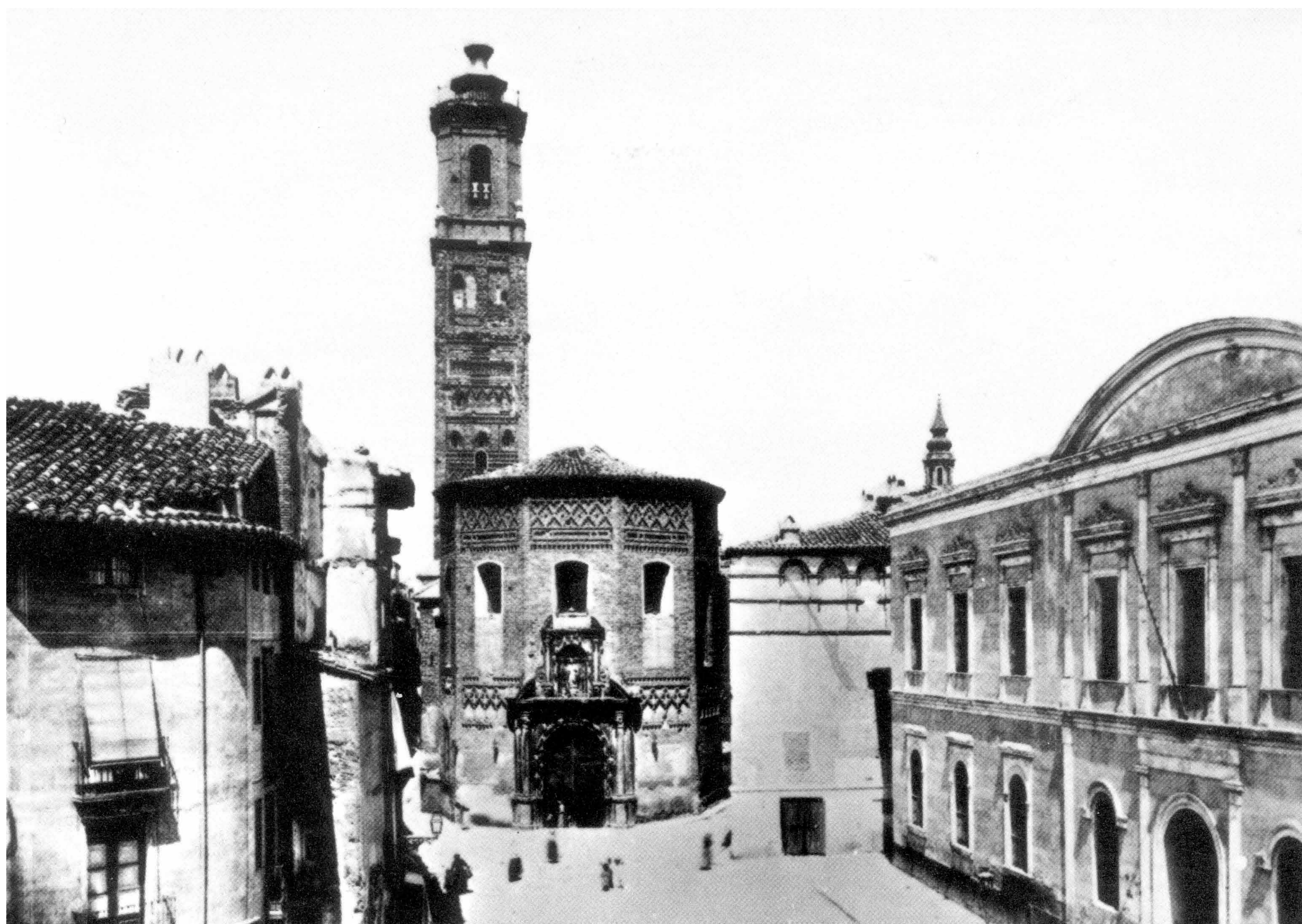
Plaza de la Magdalena con Iglesia y Universidad. Fototipia Castañeira y Álvarez. Archivo Municipal de Zaragoza, 4-1_0224.

Esta plaza fue el máximo punto de avance francés durante el segundo Sitio que Zaragoza sufrió en 1809 en la Guerra de la Independencia. Junto a la calle Doctor Palomar y el convento de San Agustín, fueron los tres principales objetivos que acabaron por hundir la defensa zaragozana por esta zona de la ciudad.