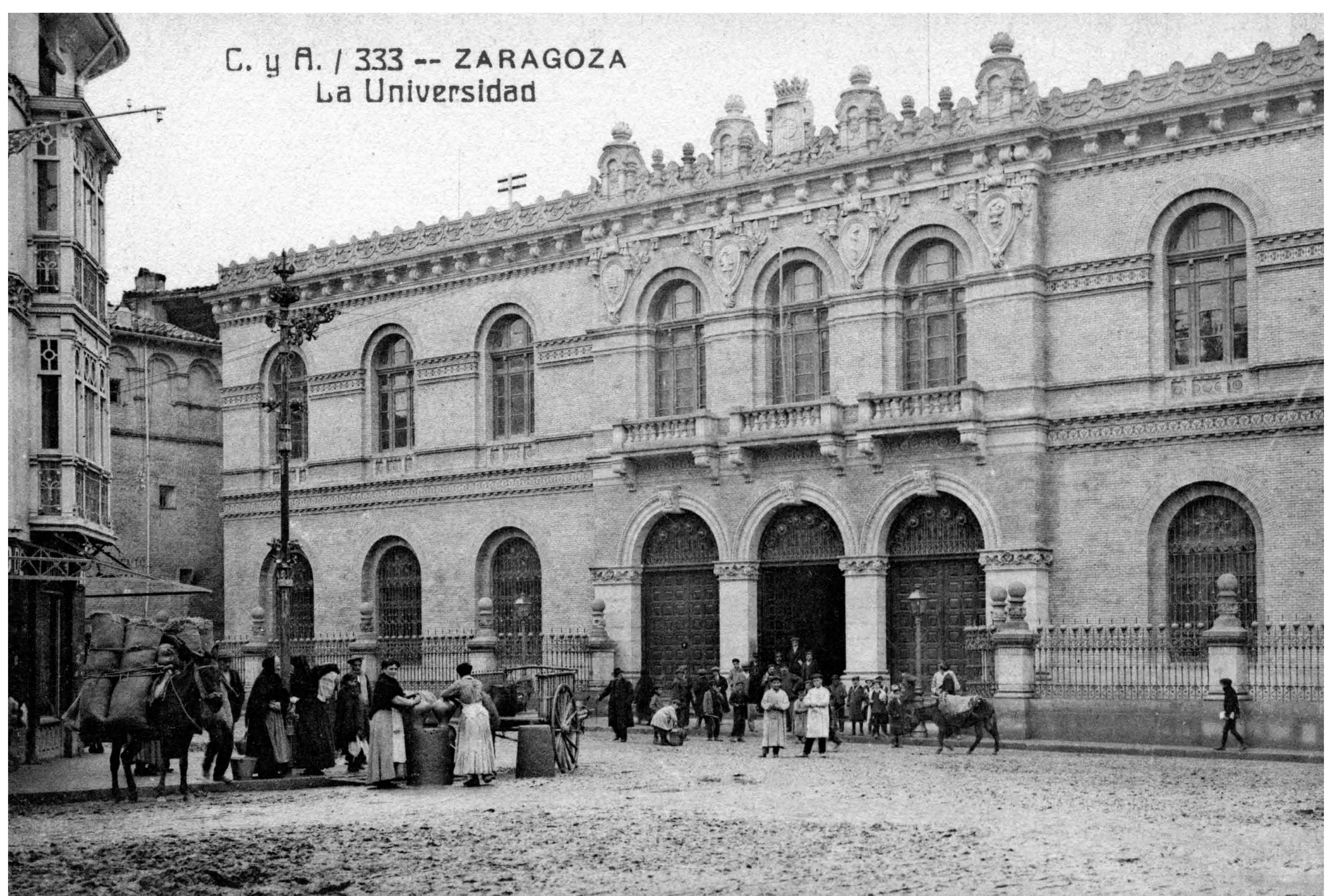
Universidad de Zaragoza. Archivo Municipal de Zaragoza, 4-1_01239.

En esta plaza se ubicó el bello edificio de la antigua Universidad de Zaragoza, en el solar que hoy ocupa un Instituto de Educación Secundaria. Unas placas en su valla nos muestran cómo era en la época de los Sitios.