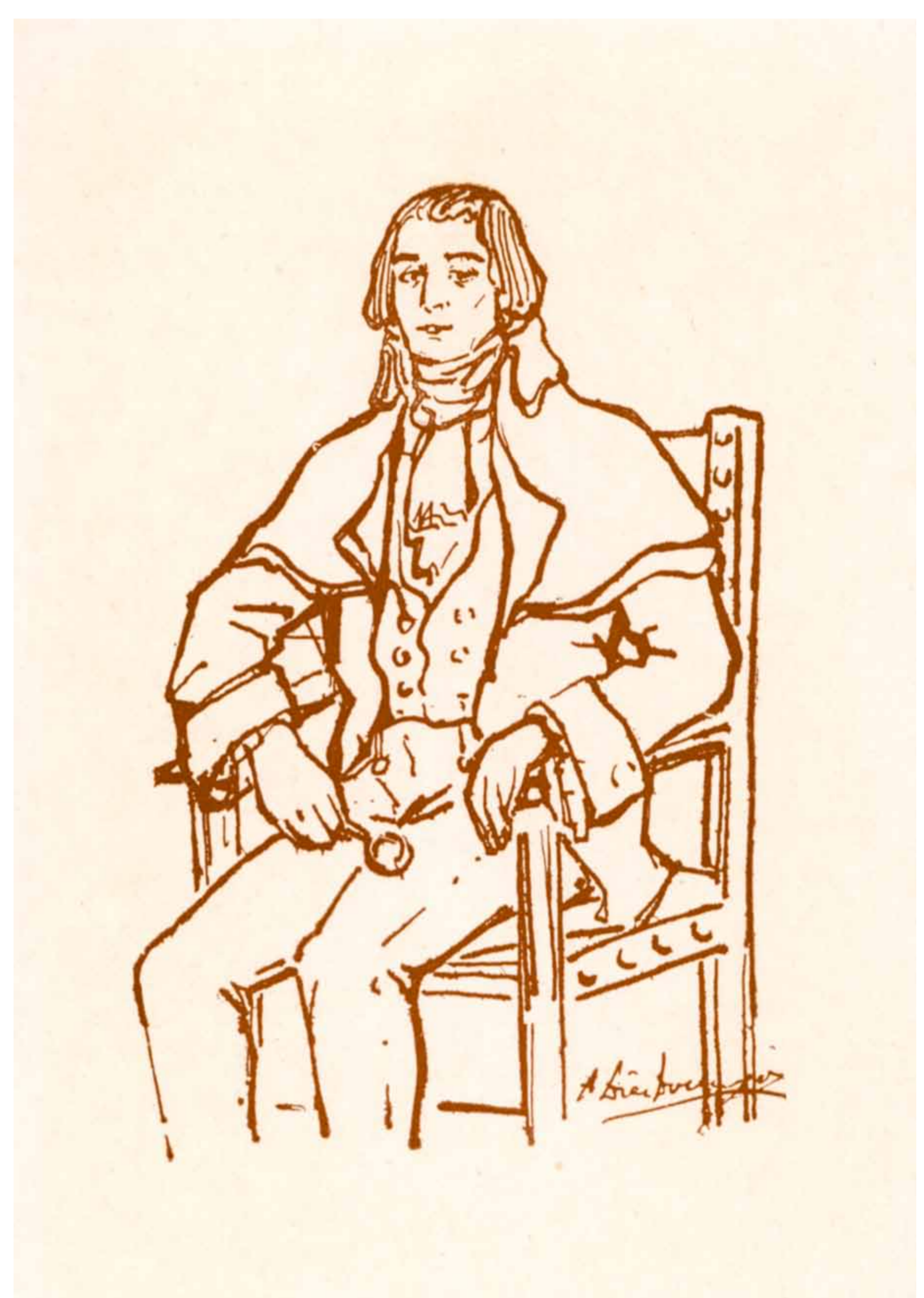
Dibujo de Ignacio Jordán de Asso. Archivo Municipal de Zaragoza, G4174.

Durante los dos Sitios de Zaragoza, fue asesor del general Palafox y redactó la Gaceta Extraordinaria de Zaragoza , contribuyendo con sus informaciones a prevenir a la resistencia popular. En la plaza se conserva el palacio Asso, casa infanzona donde vivió el ilustre aragonés.