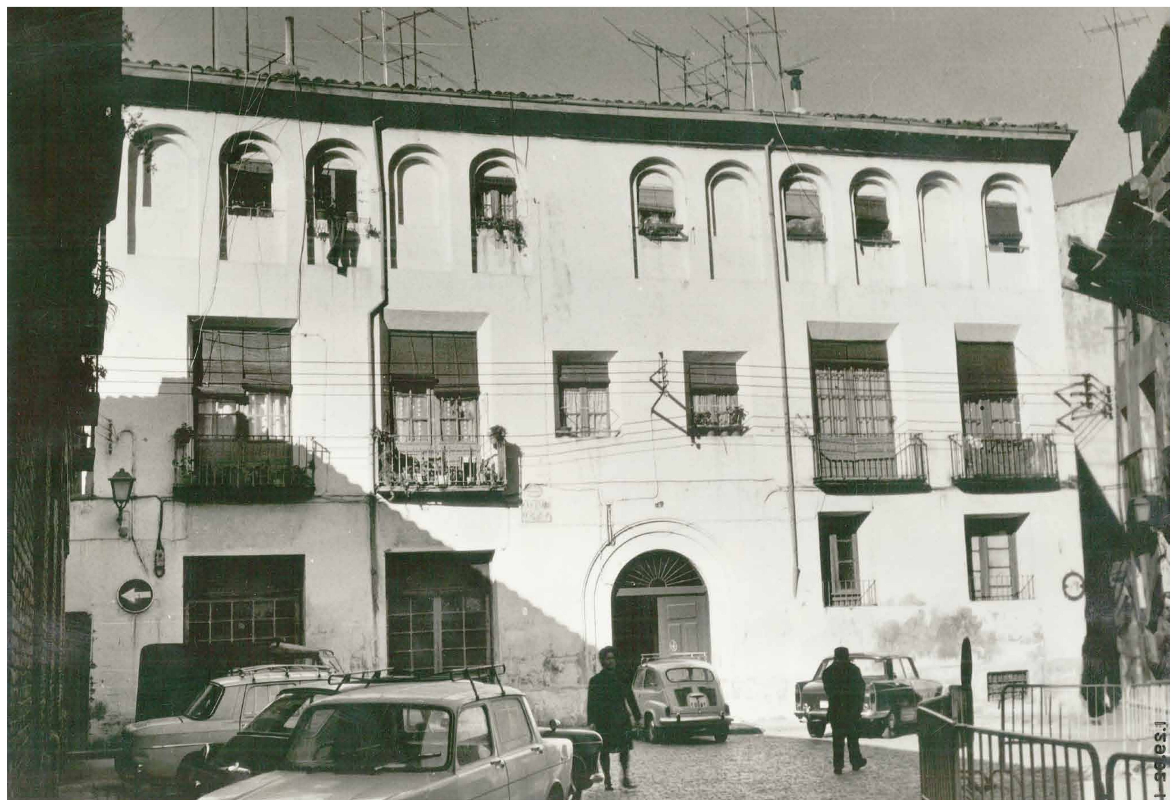
Palacio de Ignacio Jordán de Asso. Plaza de Ignacio Jordán de Asso. Finales de los años 70 del siglo XX. Archivo Municipal de Zaragoza, 4-1_0143307.