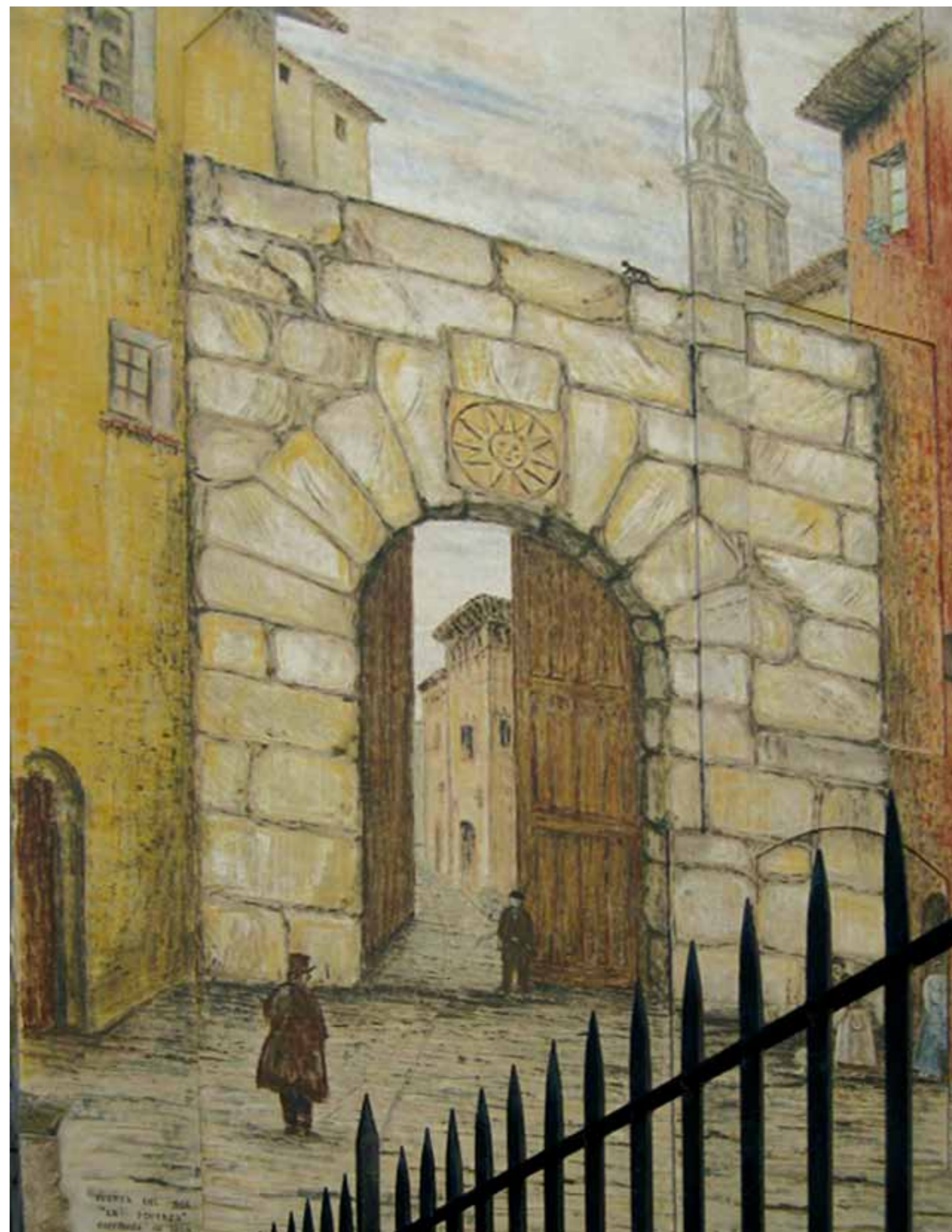
Pintura mural representando la Puerta del Sol.

Además de la de Valencia, otras puertas se abrían en la muralla que rodeaba la ciudad, siendo importantes puntos en la defensa zaragozana. Muy cerca de la plaza se encontraba la puerta del Sol, que dejaba extramuros al barrio de las Tenerías, y en el vecino barrio de San Miguel estaba la puerta Quemada, que pasó a llamarse del Heroísmo tras los Sitios por la dura resistencia que ofrecieron sus vecinos.