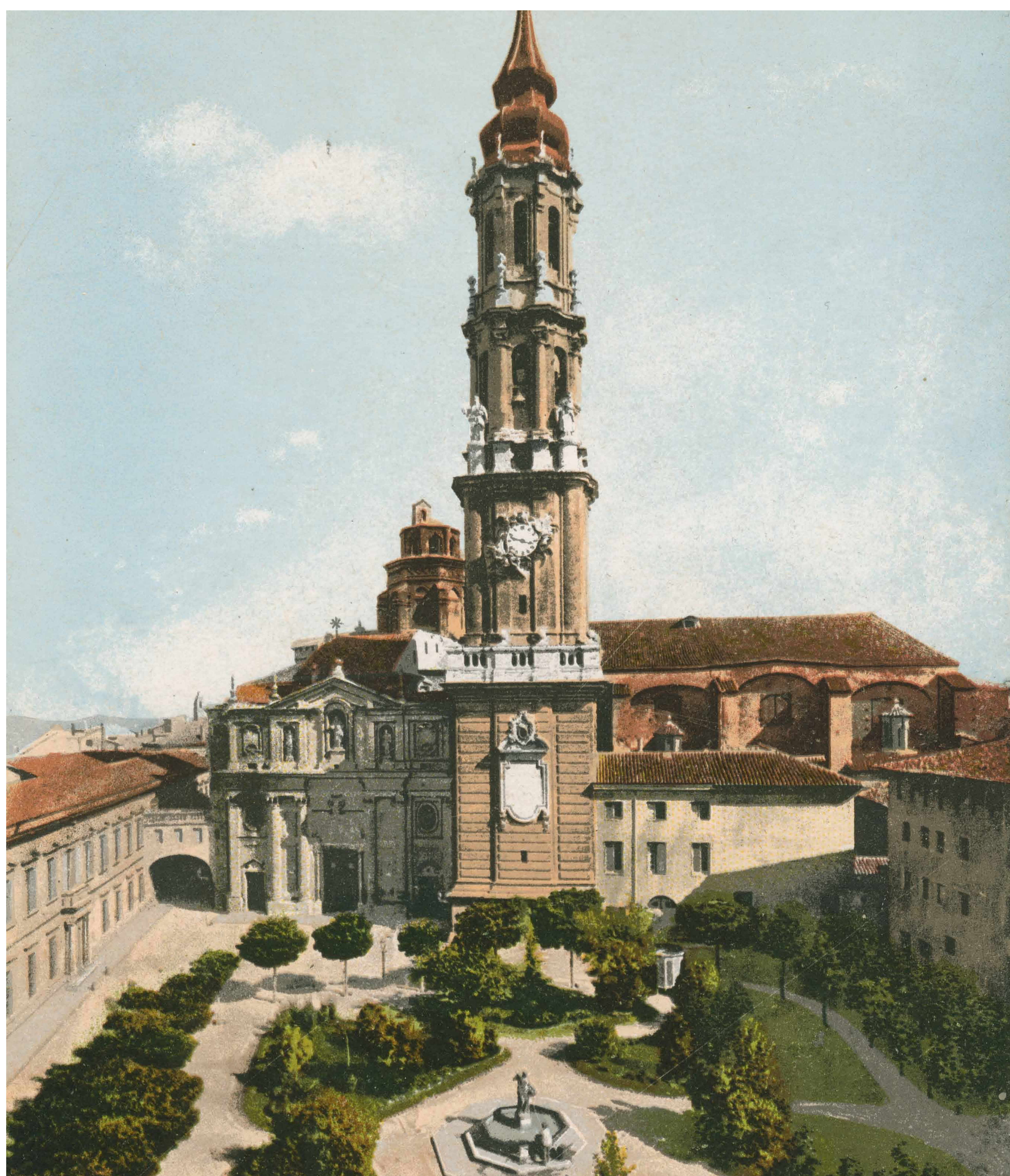
Postal de la plaza de la Seo, con Palacio episcopal y Catedral de San Salvador. Edita Cecilio Gasca, Zaragoza. Archivo Municipal de Zaragoza, 4-1_0085

La casa natal de Palafox, cuando empezaron los asedios, fue convertida en sede de su Estado Mayor hasta ser trasladado a primera línea, al palacio episcopal. Junto a la gran puerta principal, la placa conmemorativa, colocada por la Junta del Centenario, dice: A PALAFOX/ Al gran Caudillo defensor de Zaragoza/ en los Sitios de 1808 y 1809/ LA PATRIA Y LA CIUDAD/ por él/ gloriosamente defendidas./ 1er. Centenario de los Sitios.