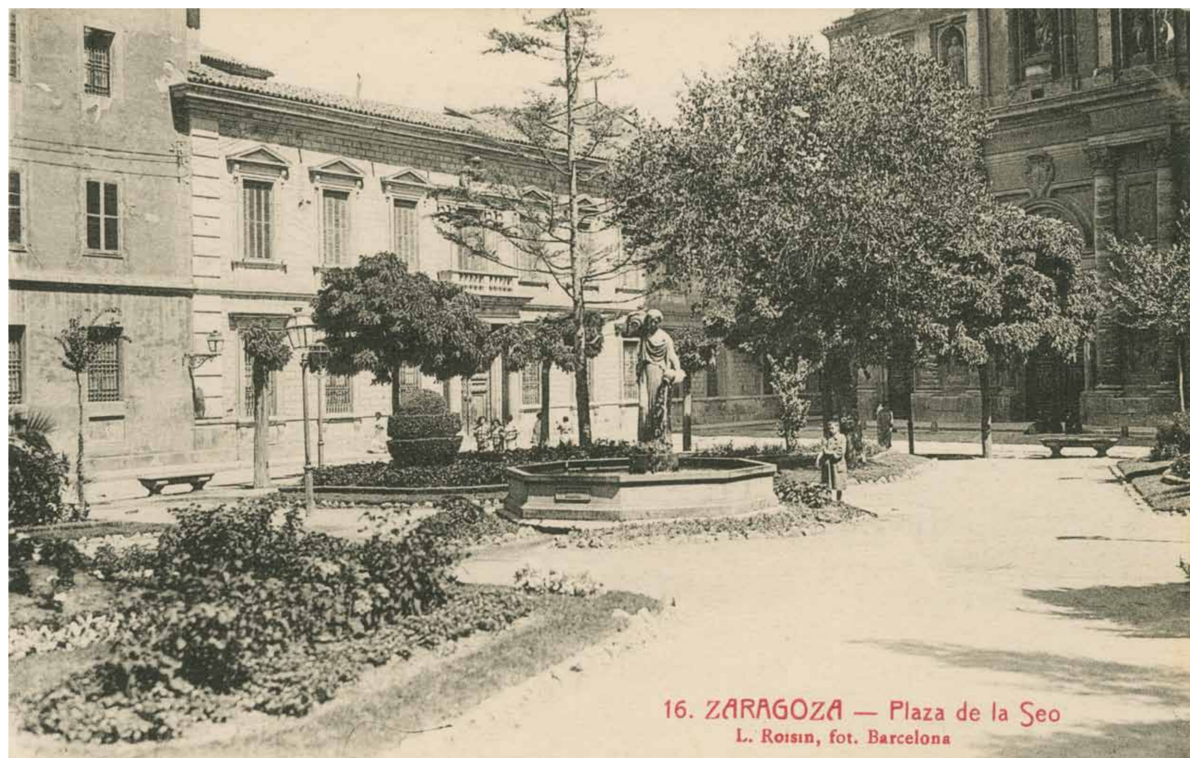
Plaza de la Seo con la fuente de la Samaritana y Palacio Arzobispal.

Durante los Sitios, el actual Palacio Episcopal fue el cuartel general de Palafox. Desde la parte alta del edificio podía seguir con detalle la suerte de su destacamento dispuesto en el Arrabal, al otro lado del río. Sus archivos aún conservan documentos de la época destrozados por la metralla de los cañones y perforaciones de balas.