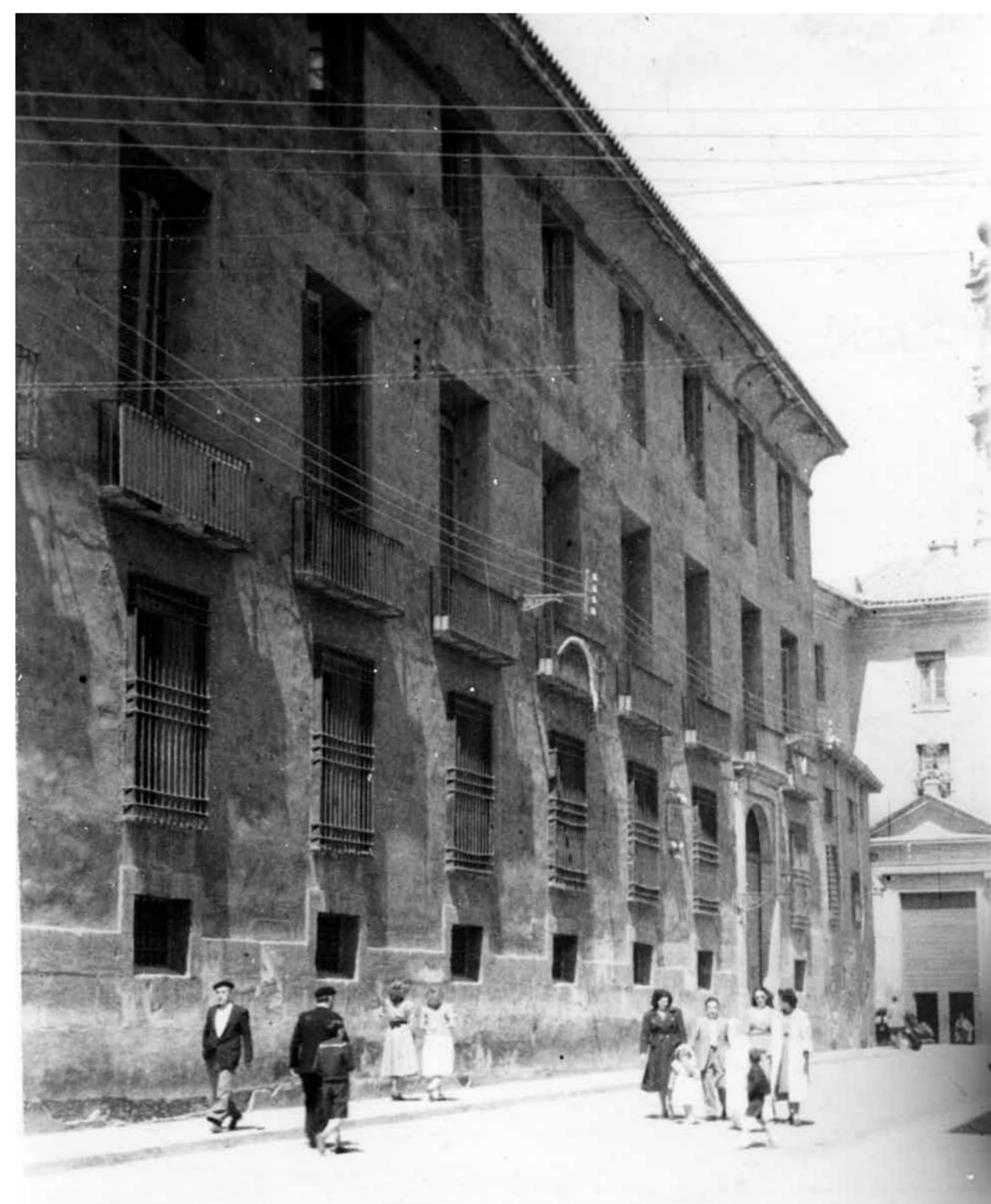
Casa natal de Palafox. Al fondo, la catedral de San Salvador. Juan Mora Insa, 1949. Archivo Municipal de Zaragoza, 4-1_02378.