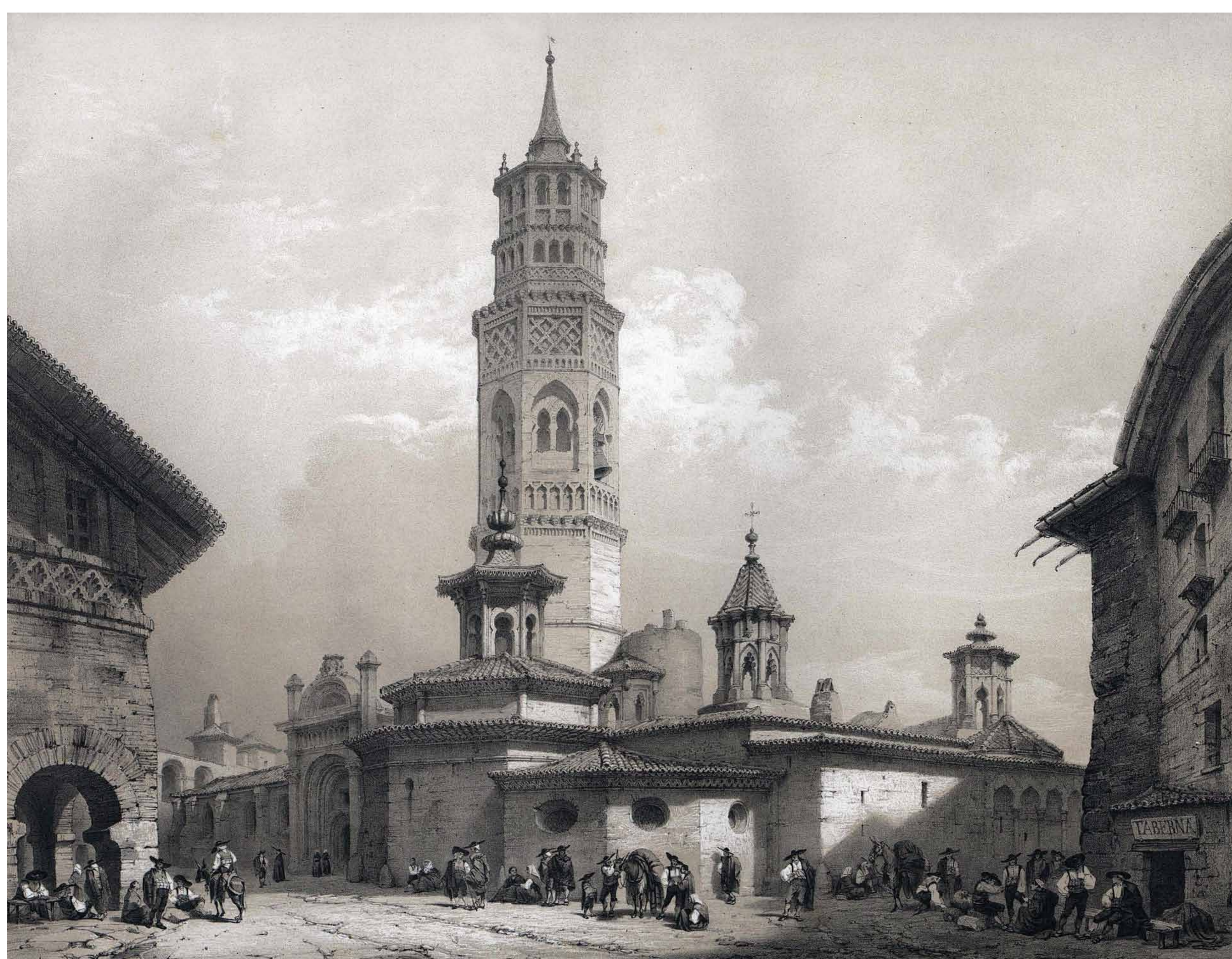
Iglesia de San Pablo, en Zaragoza. España artística y monumental: vistas y descripción de los sitios y monumentos más notables de España (Patricio de la Escosura, tomo tercero, 1850).

También conocido como barrio de El Gancho por la forma de la veleta situada en la espléndida torre mudéjar de su iglesia. Surgió así, en la Edad Media, el primer ensanche de la ciudad, expandiéndose y edificando la llamada entonces Huerta del Rey.