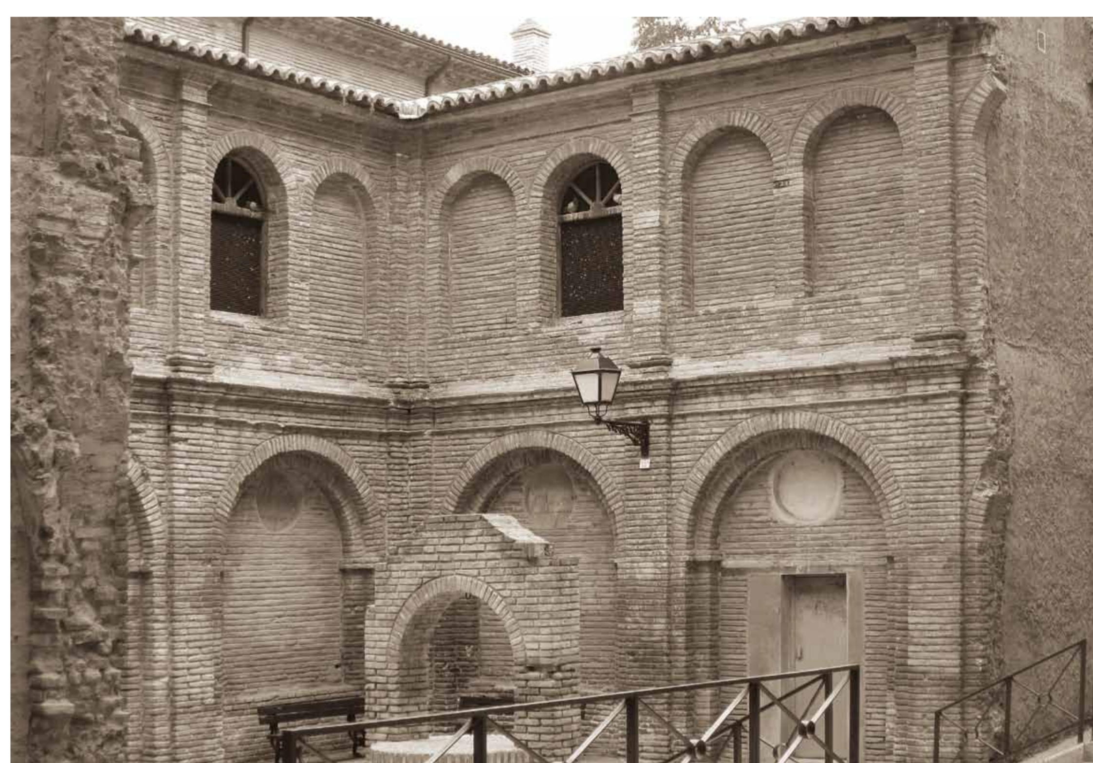
Claustro de la iglesia de Las Fecetas, antiguo convento de Carmelitas Descalzas de Santa Teresa.