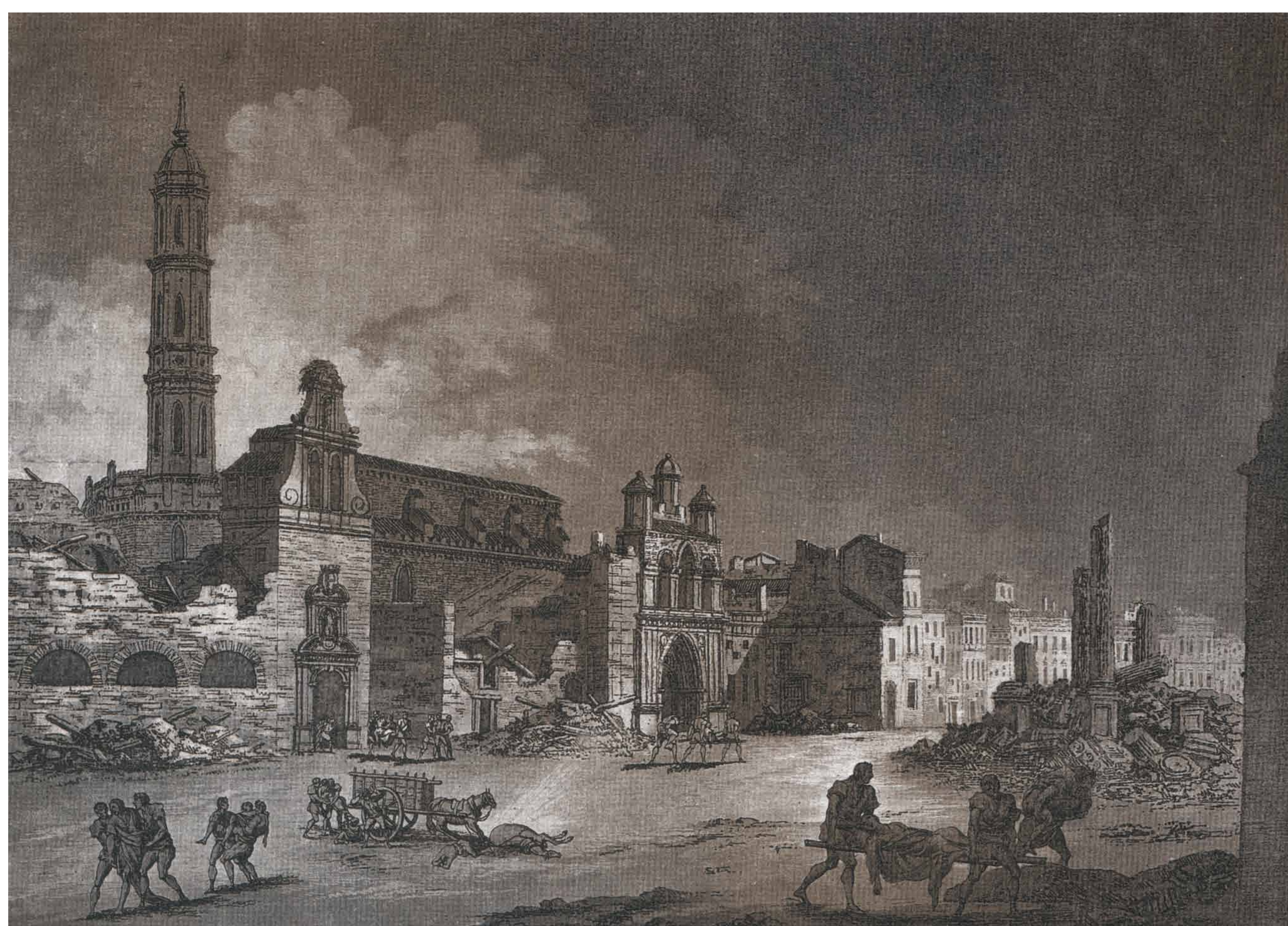
Grabado de Gálvez y Brambila. Vista de la calle del Coso.

La actual plaza de España se llamaba plaza de San Francisco en la época de los Sitios. Es una zona donde se libraron decisivas batallas, punto de máxima penetración francesa en el primer Sitio.