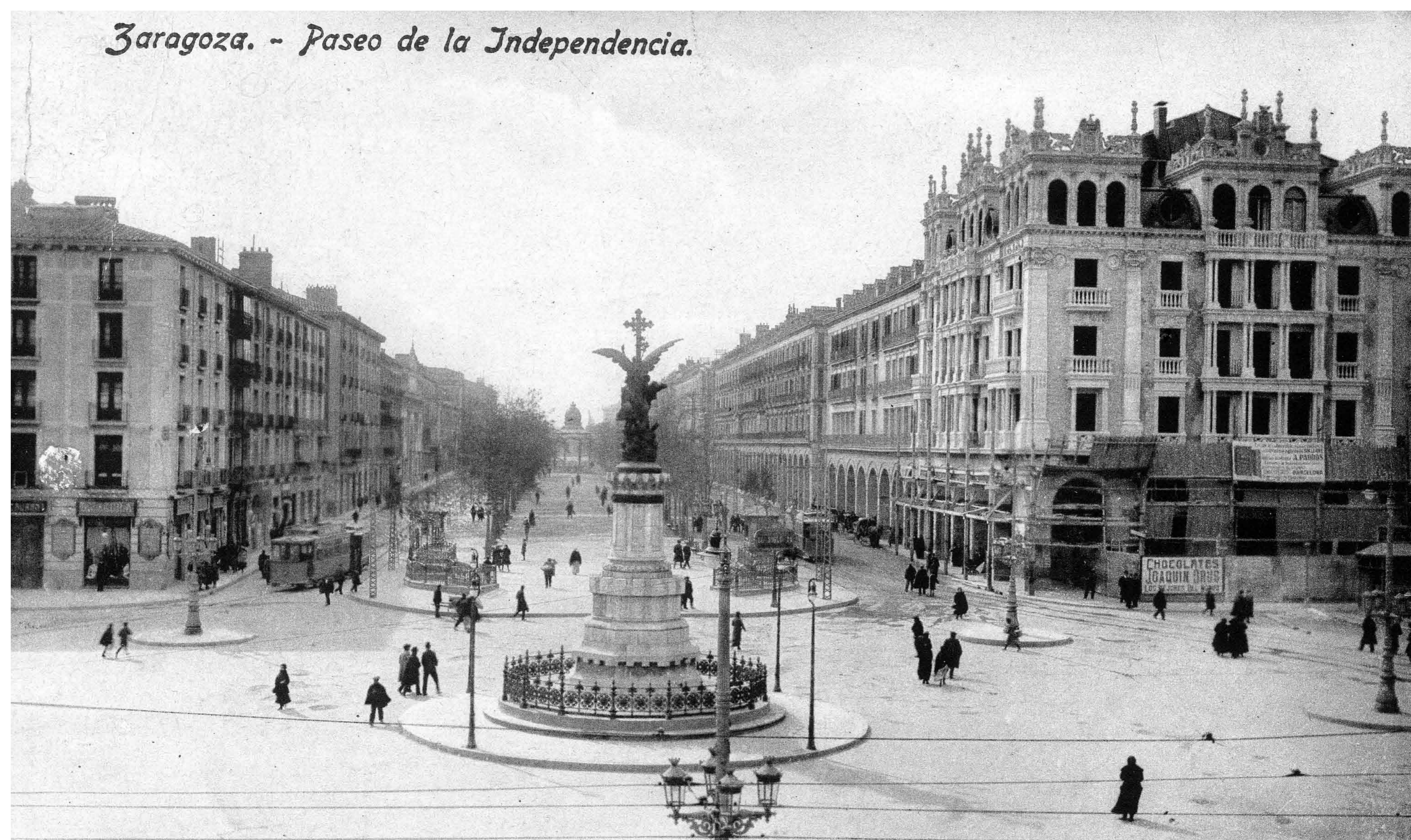
El Monumento a los Mártires se inauguró el 23 de octubre de 1904. Lo diseñó Ricargo Magdalena y el conjunto escultórico, fundido en bronce, es de Agustín Querol. Archivo Municipal de Zaragoza, 4-1_0148.

A la derecha aparecen las ruinas de la Cruz del Coso, destruida por un disparo de cañón francés durante el primer asedio. Hoy en el mismo punto se alza desde 1908 el monumento a los Mártires de la religión y de la Patria, obra escultórica que representa a la Fe sosteniendo a un defensor herido con el fusil caído a sus pies.