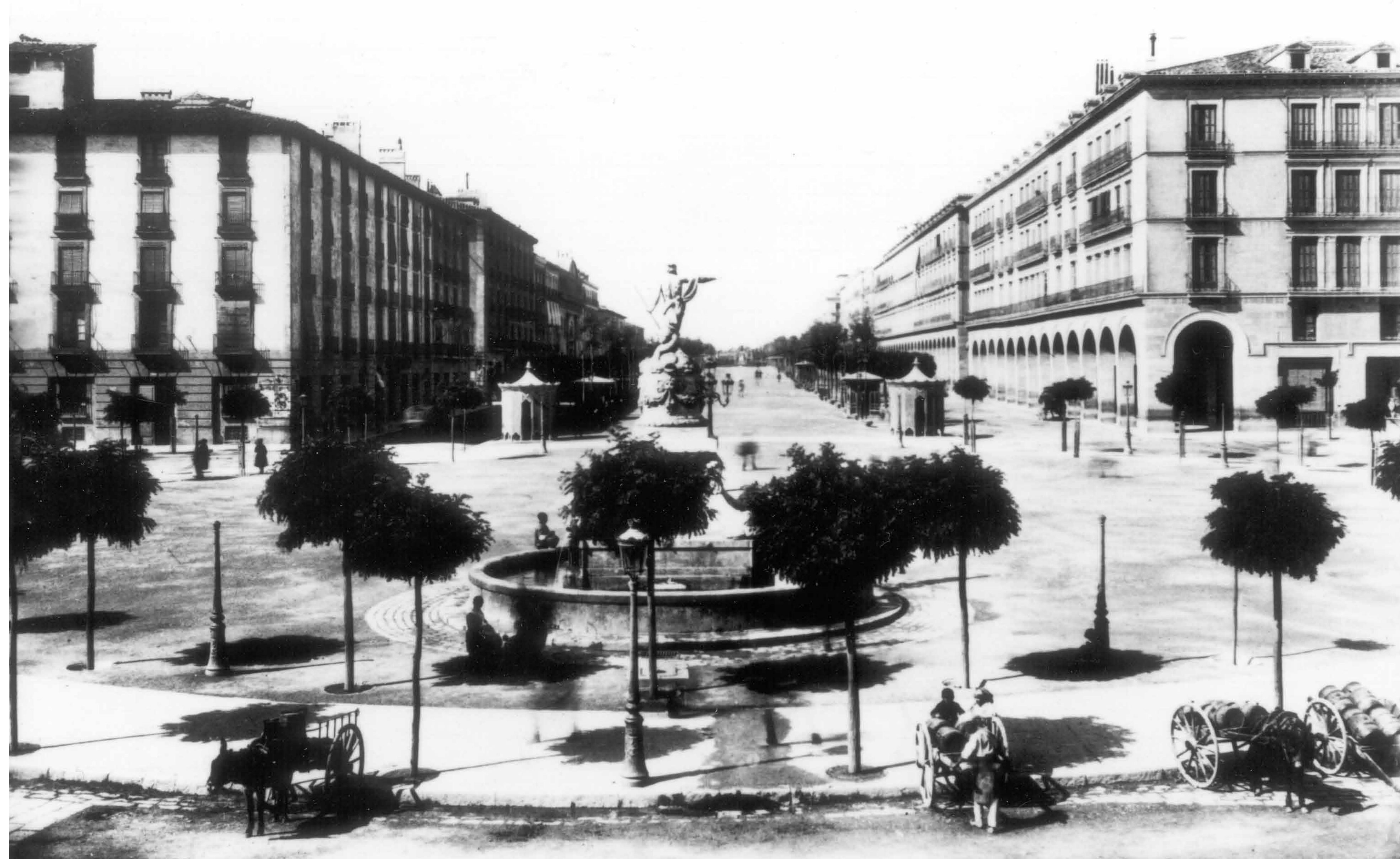
Plaza de la Constitución, actual plaza de España. Paseo de Santa Engracia, actual de la Independencia. Fuente de la Princesa o de Neptuno. Hacia 1900.

En el solar del actual Banco de España se alzaba el Hospital General de Nuestra Señora de Gracia, único gran hospital de la ciudad.