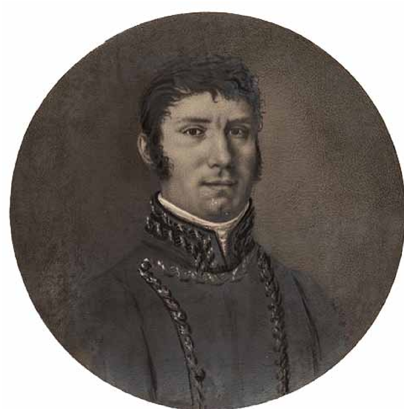
Anónimo. General José de L'Hotellerie de Falloise, barón de Warsage.

Le monument rend également hommage au baron de Warsage, qui était chargé de la défense de l'Arrabal pendant le second Siège et qui fut mortellement blessé par un boulet de canon français le 18 février 1809 alors qu'il tentait de rejoindre l'Arrabal pour prendre le commandement de sa défense.