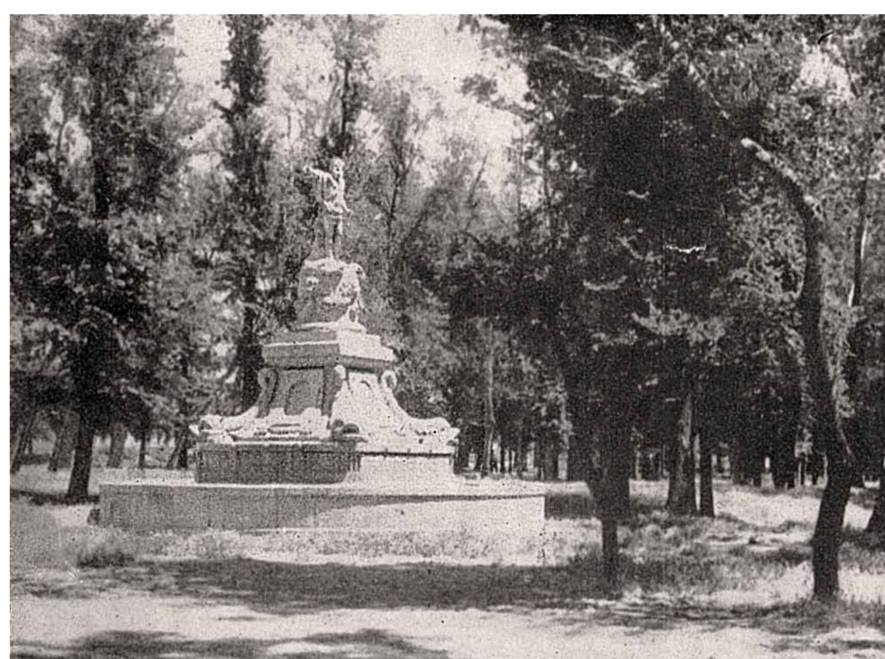
Bois de Macanaz, avec la fontaine de la Princesse communément appelée Neptune. 1935.

Lors du premier siège de 1808, le lieutenant Luciano de Tornos a réussi à arrêter la ruée populaire sur le pont qui s'enfuyait vers la périphérie de la ville après une dure offensive française le 4 août. Tornos, les menaçant d'un canon depuis le couvent de San Lazaro, les fit revenir dans la ville pour combattre.