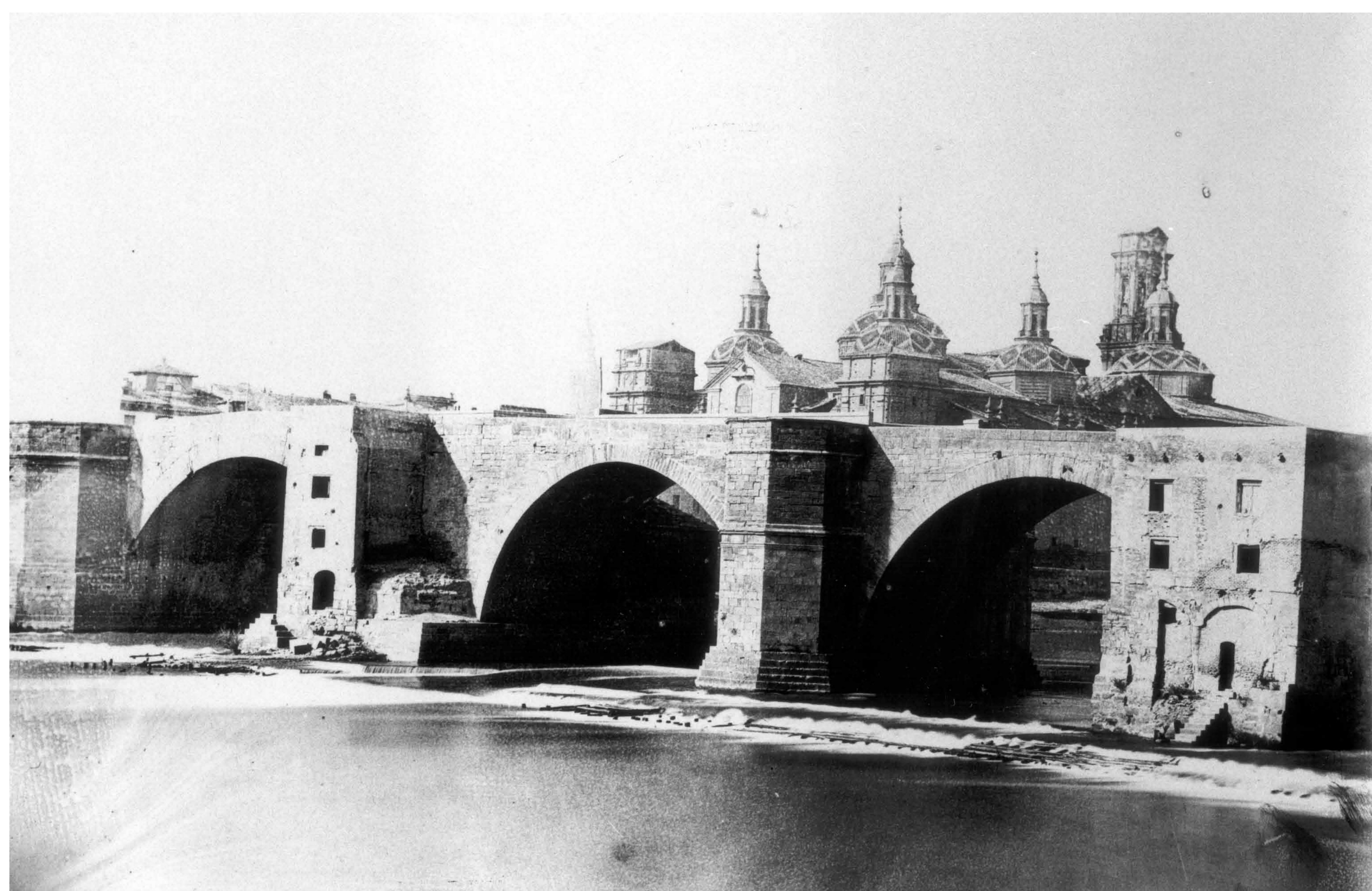
Vue du Pont de Pierre, au fond la Basilique du Pilar depuis la rive gauche du fleuve. Avant 1907.

Le pont le plus emblématique de la ville a subi de nombreuses vicissitudes tout au long de son histoire. Lors des Sièges que Saragosse a subi par les armées napoléoniennes pendant la guerre d'Indépendance, il a également été le scénario de nombreuses batailles et d'événements féroces.