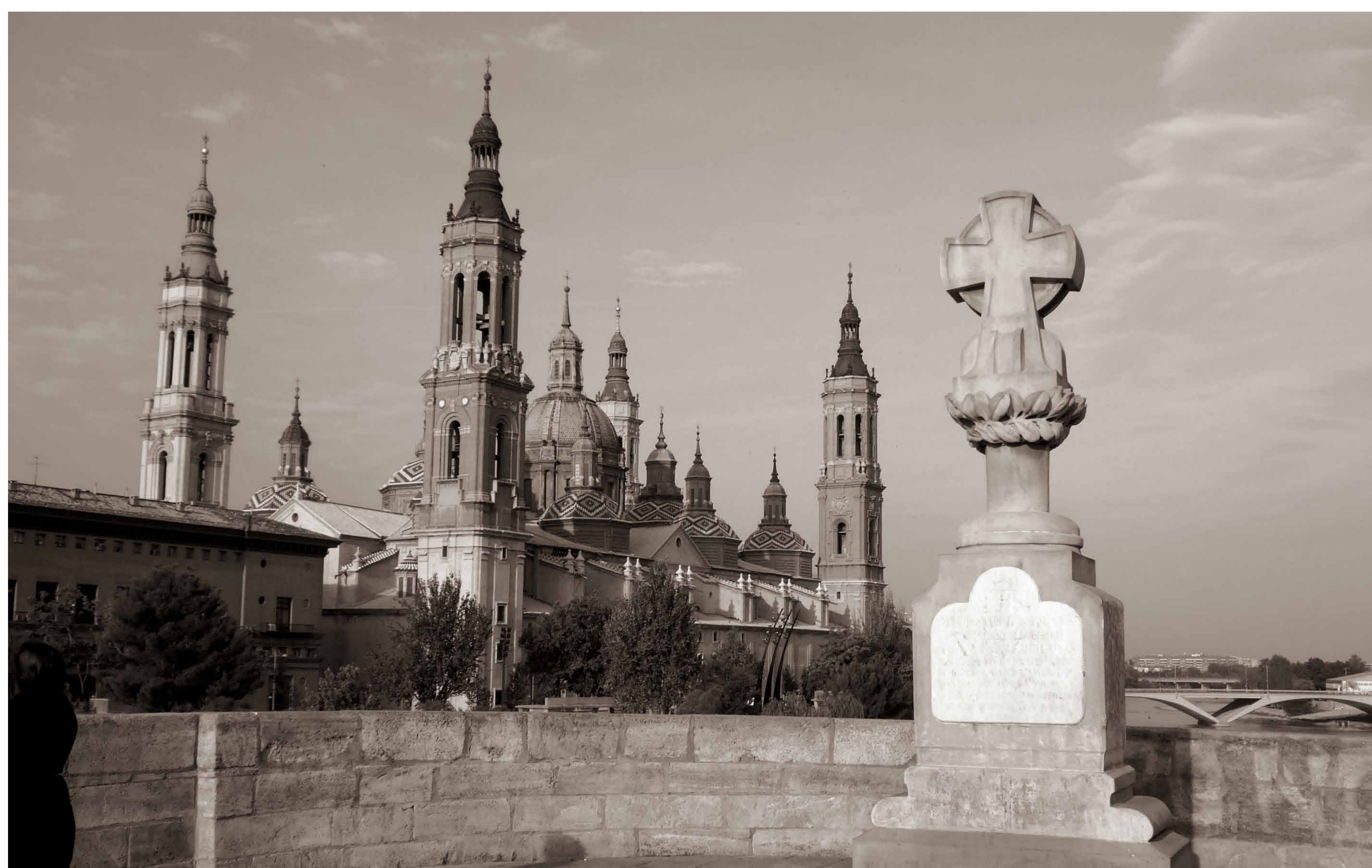
Vue depuis la Croix indiquant le lieu de l'assassinat des prêtres Boggiero et Sas.

Le fleuve Èbre a également joué un rôle important dans la défense de la ville. En plus de s'imposer comme un moyen de communication lors de l'avancée des Français vers la capitale, il avait également une grande importance stratégique. Lors du second Siège, les troupes de Murcie et de Carthagène vinrent en aide à la défense de Saragosse, en patrouillant le fleuve avec leurs canons, assurant la défense de l'Ebre et contrôlant les mouvements de l'ennemi.