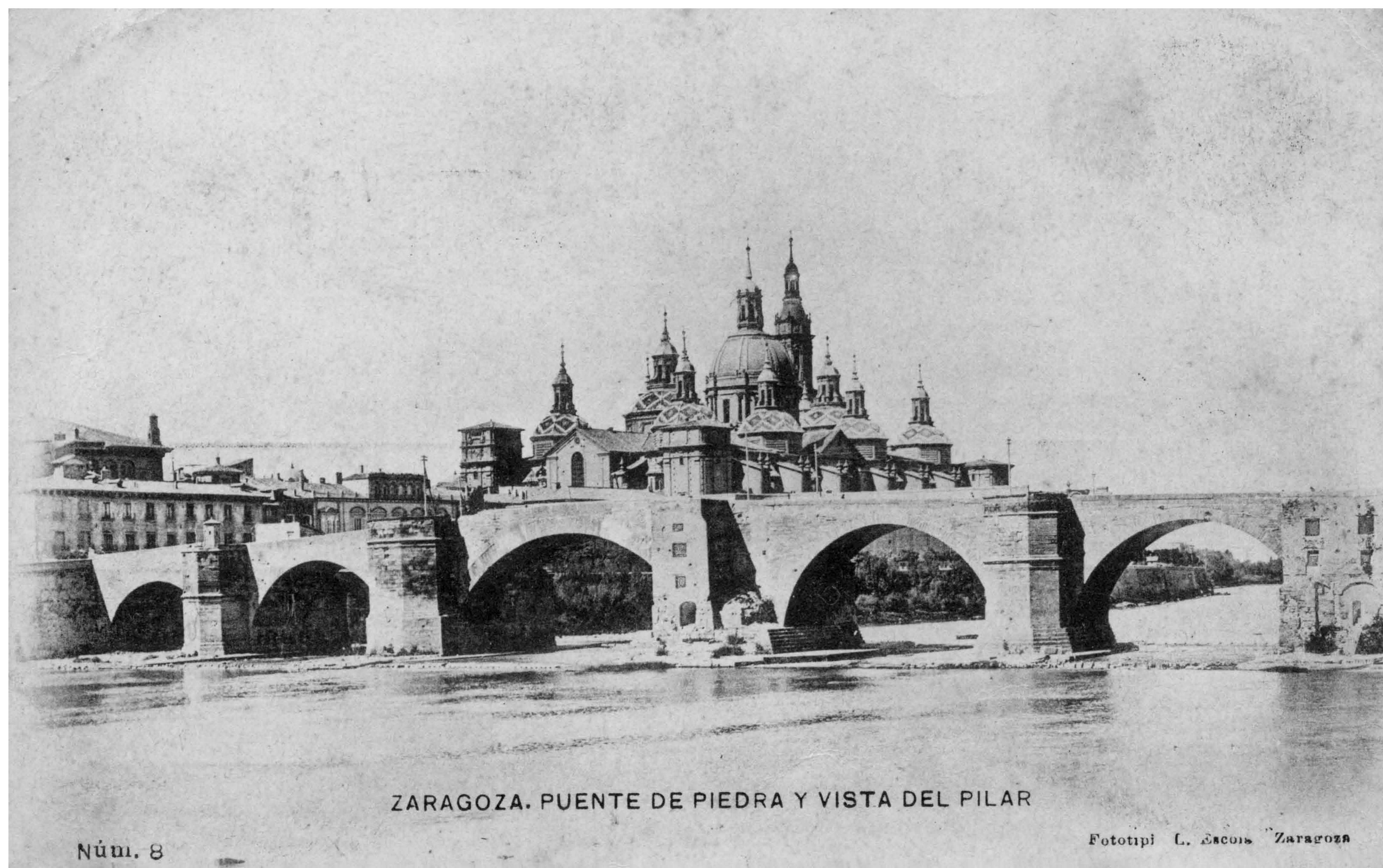
ZARAGOZA. PUENTE DE PIEDRA Y VISTA DEL PILAR

Tout près du pont de Pierre se trouve le bois de Macanaz, un lieu de promenade et de loisirs pour les Saragossais depuis des siècles et où, en 1809, après les sièges, les restes de milliers de défenseurs ont été enterrés dans une fosse commune.