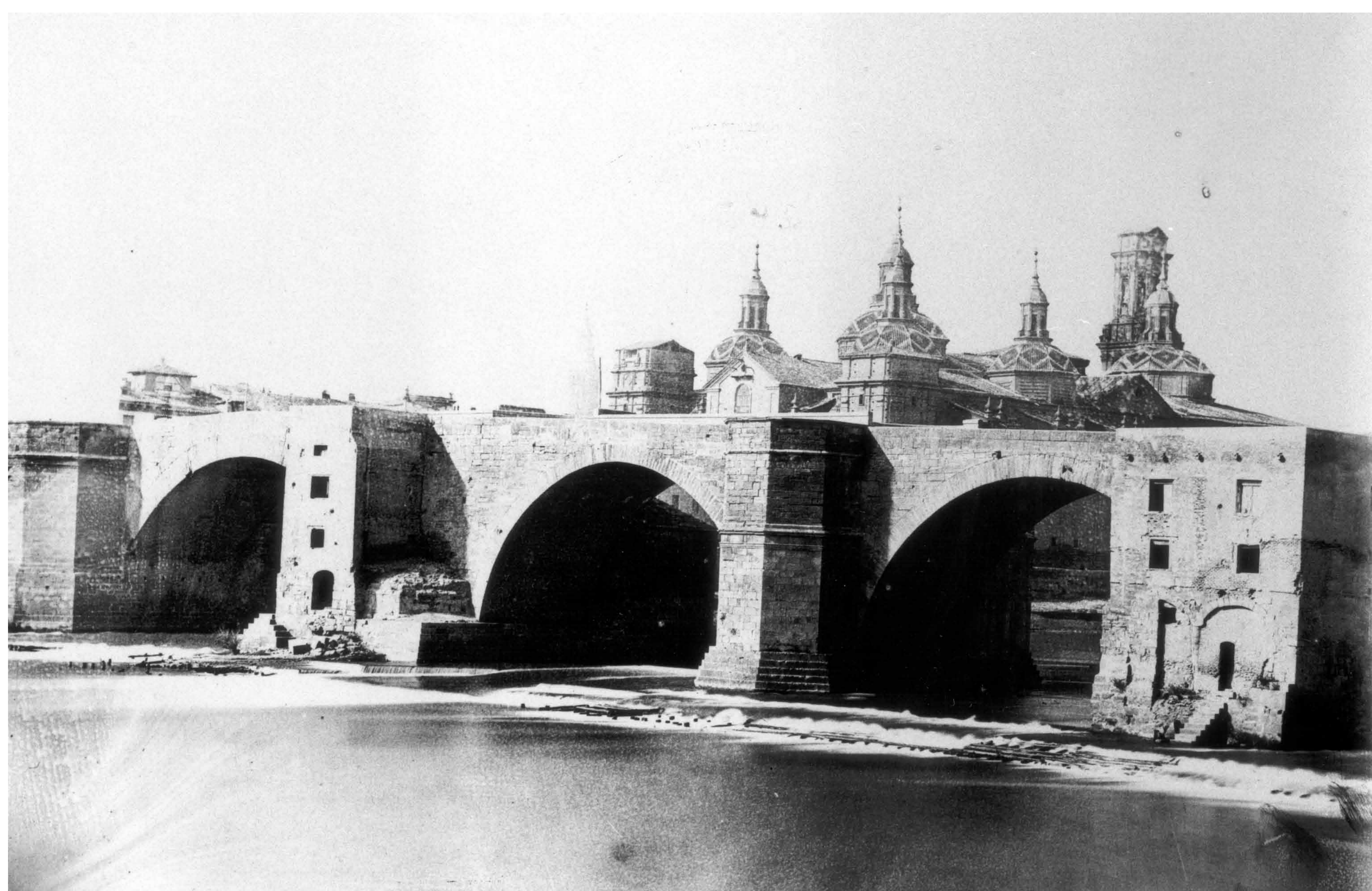
Vista del puente de Piedra, al fondo la Basilica del Pilar desde la margen izquierda del río. L. Escolá. Anterior a 1907. Archivo Municipal de Zaragoza, 4-1_02929.

El puente más emblemático de la ciudad ha experimentado numerosos avatares a lo largo de su historia. Durante los asedios que sufrió Zaragoza por los ejércitos napoleónicos durante la Guerra de la Independencia fue también escenario de múltiples combates y feroces sucesos.