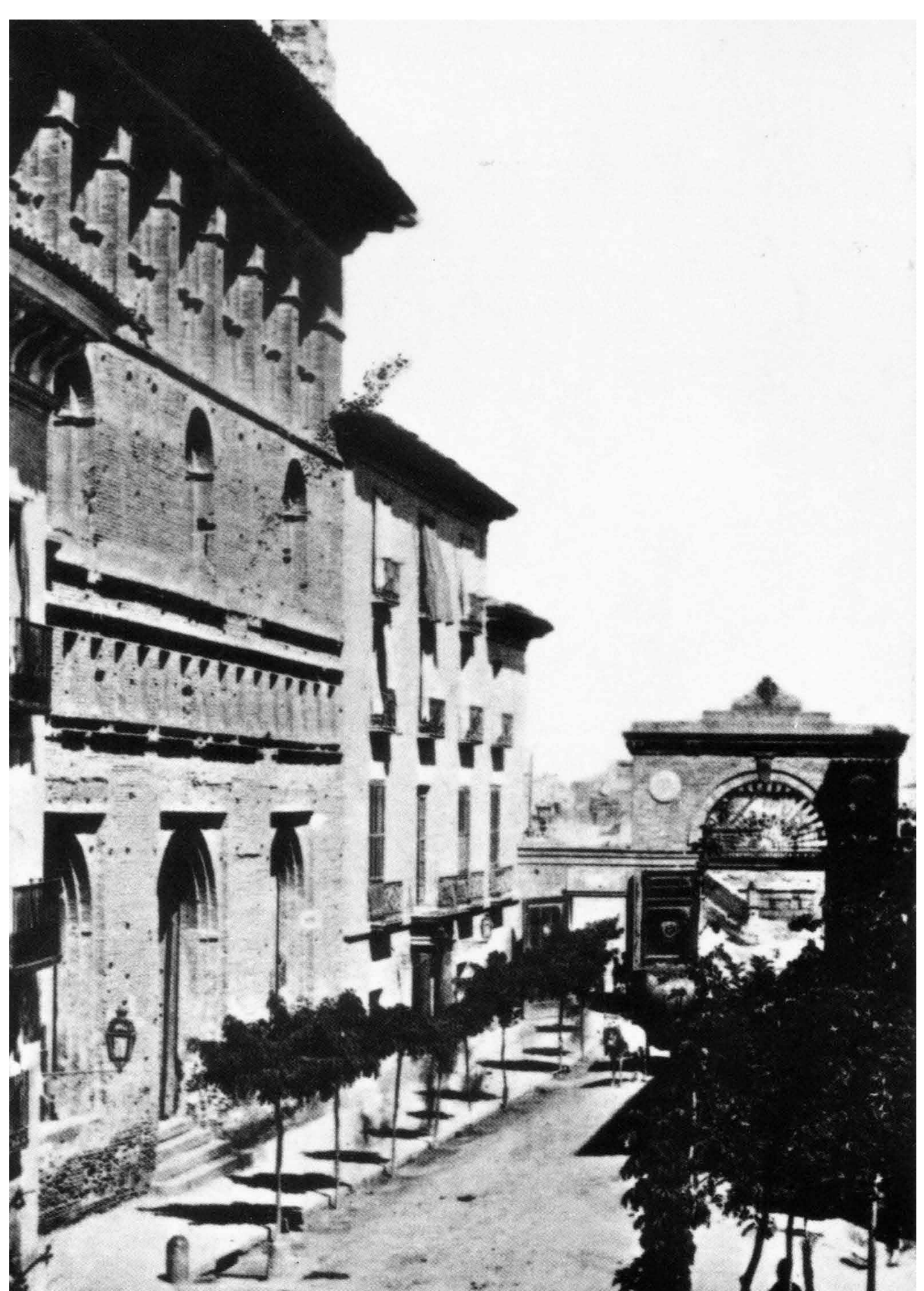
Lonja, Ayuntamiento y Puerta del Ángel. Anterior a 1867. Archivo Municipal de Zaragoza, 4-1_0196.

La actual calle de Alfonso I era en la época de los asedios apenas un callejón que terminaba en esta plaza, que hoy lleva el nombre de Santiago Sas.