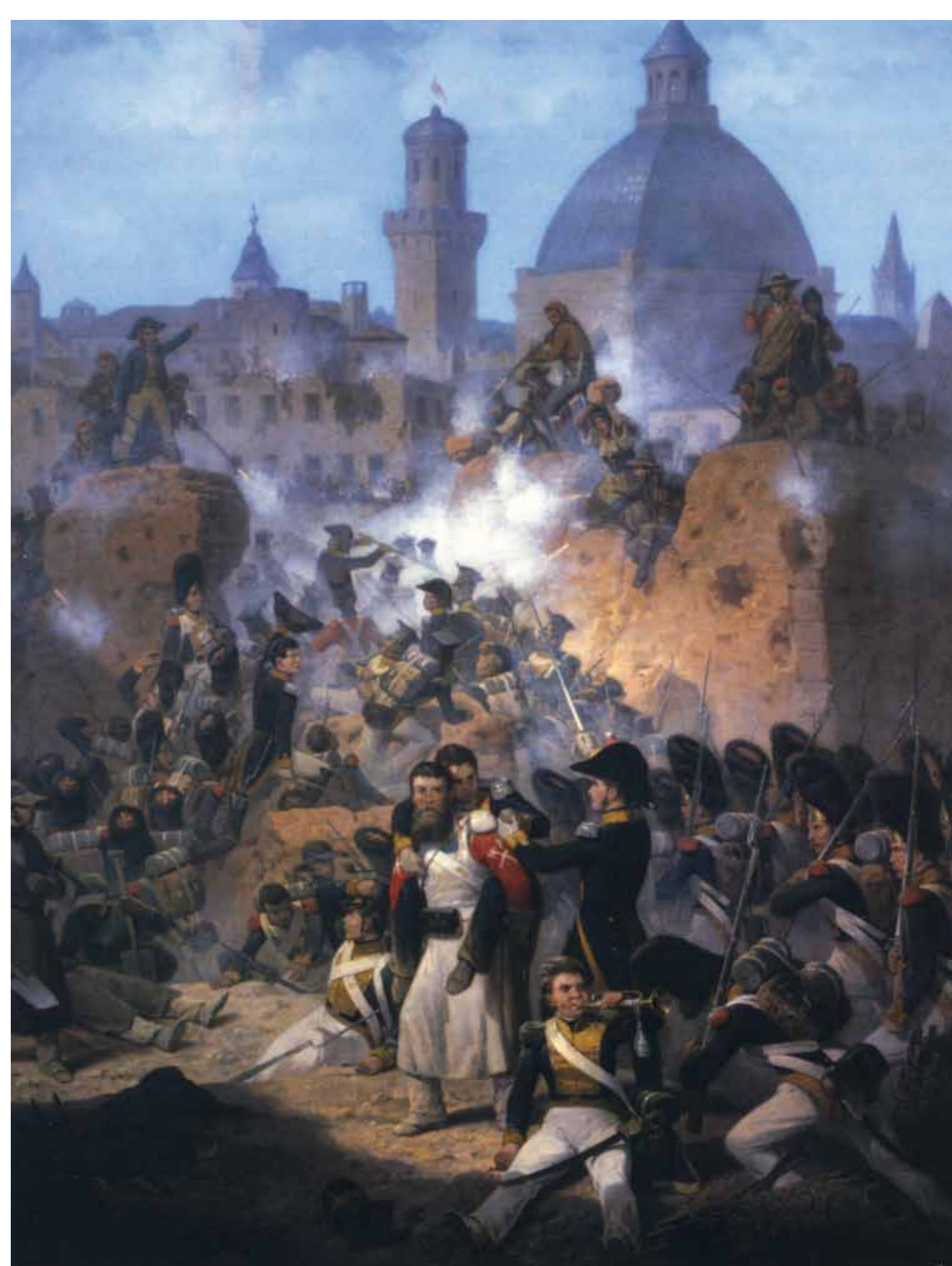
Asalto a Zaragoza, 1809. January Suchodolsky, 1870. Muzeum Wojska Polskiego, Varsovia.

Murió tres días después de la capitulación de la ciudad, asesinado por los franceses, a pesar de que el documento de capitulación reflejara el respeto de las vidas. Su cuerpo fue arrojado al río Ebro por el puente de Piedra, junto al del padre Basilio Boggiero. En el lugar del puente de piedra donde fueron asesinados, un monolito los recuerda.