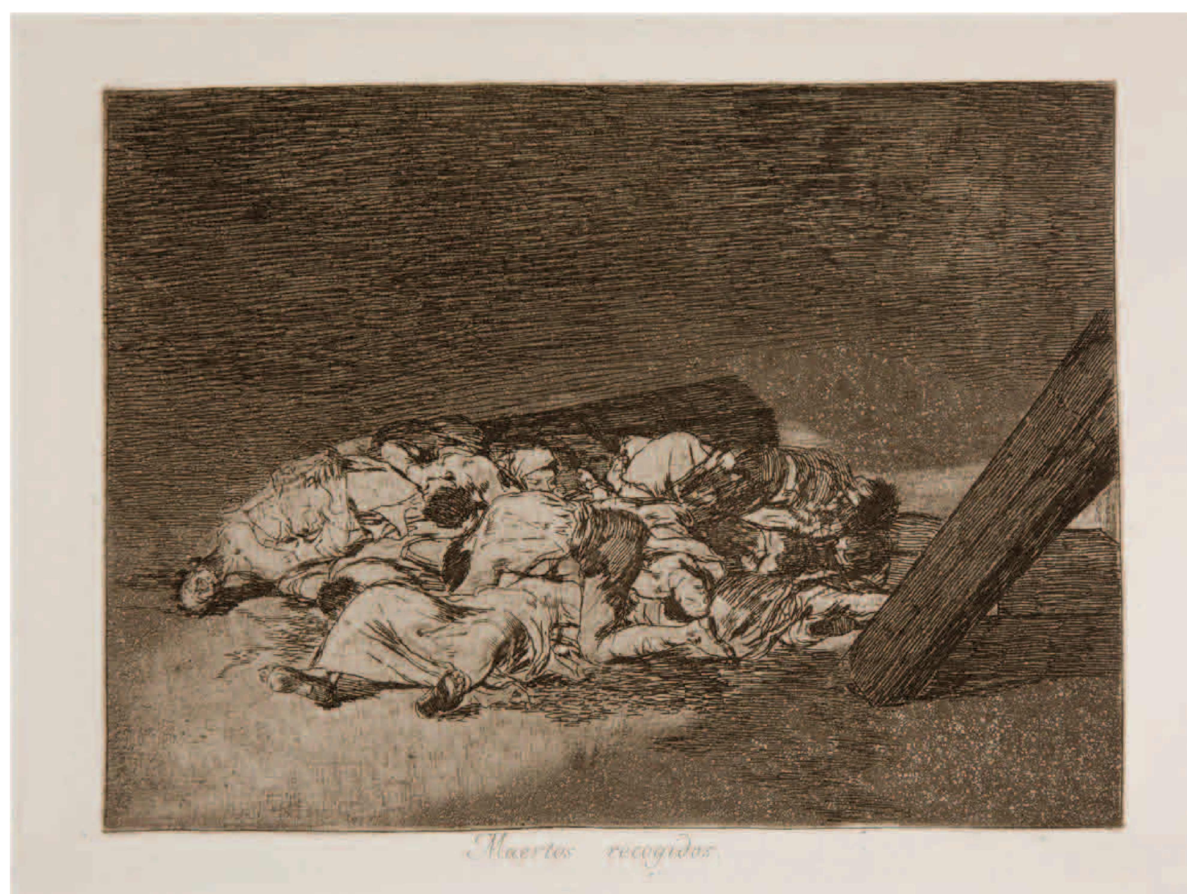
Francisco de Goya, “Muertos recogidos”, Los desastres de la guerra (Desastre 63)

“ZARAGOZA HONRA A SUS DEFENSORES ANÓNIMOS AQUÍ ENTERRADOS POR MILES, VÍCTIMAS DE LA GUERRA Y LA ENFERMEDAD, EN LOS SITIOS QUE SUFRIÓ LA CIUDAD EN 1808 Y 1809”