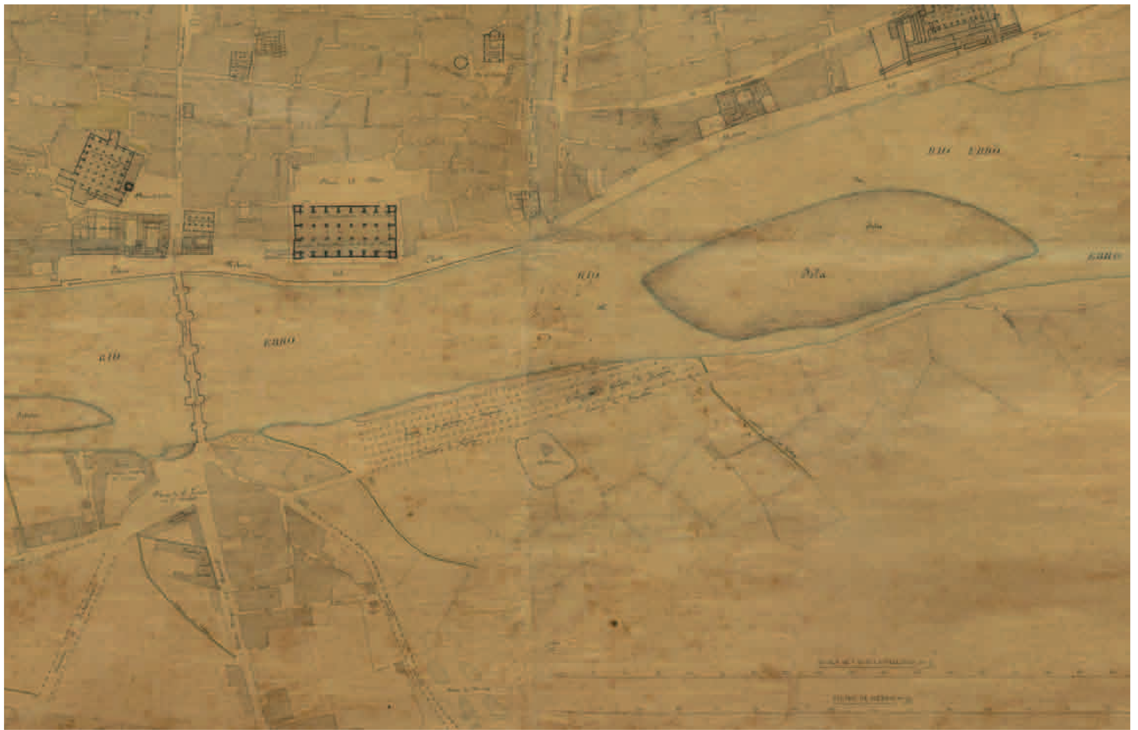
José de Yarza, Plano de Zaragoza (1861). Detalle con la ubicación de la Salitrería de Macanaz

En el momento de la capitulación de Zaragoza, el 21 de febrero de 1809, el estado de la ciudad era dantesco, con las calles llenas de miles de cadáveres provocados tanto por los combates como, sobre todo por la epidemia de tifus declarada durante el asedio. Para favorecer el saneamiento de la ciudad, el 7 de marzo de 1809, el Mariscal Lannes ordenó trasladar fuera de la misma tanto estos cadáveres como los que se produjesen en adelante, y para ello se abrieron dos grandes fosas para acoger los cuerpos de los miles de fallecidos.