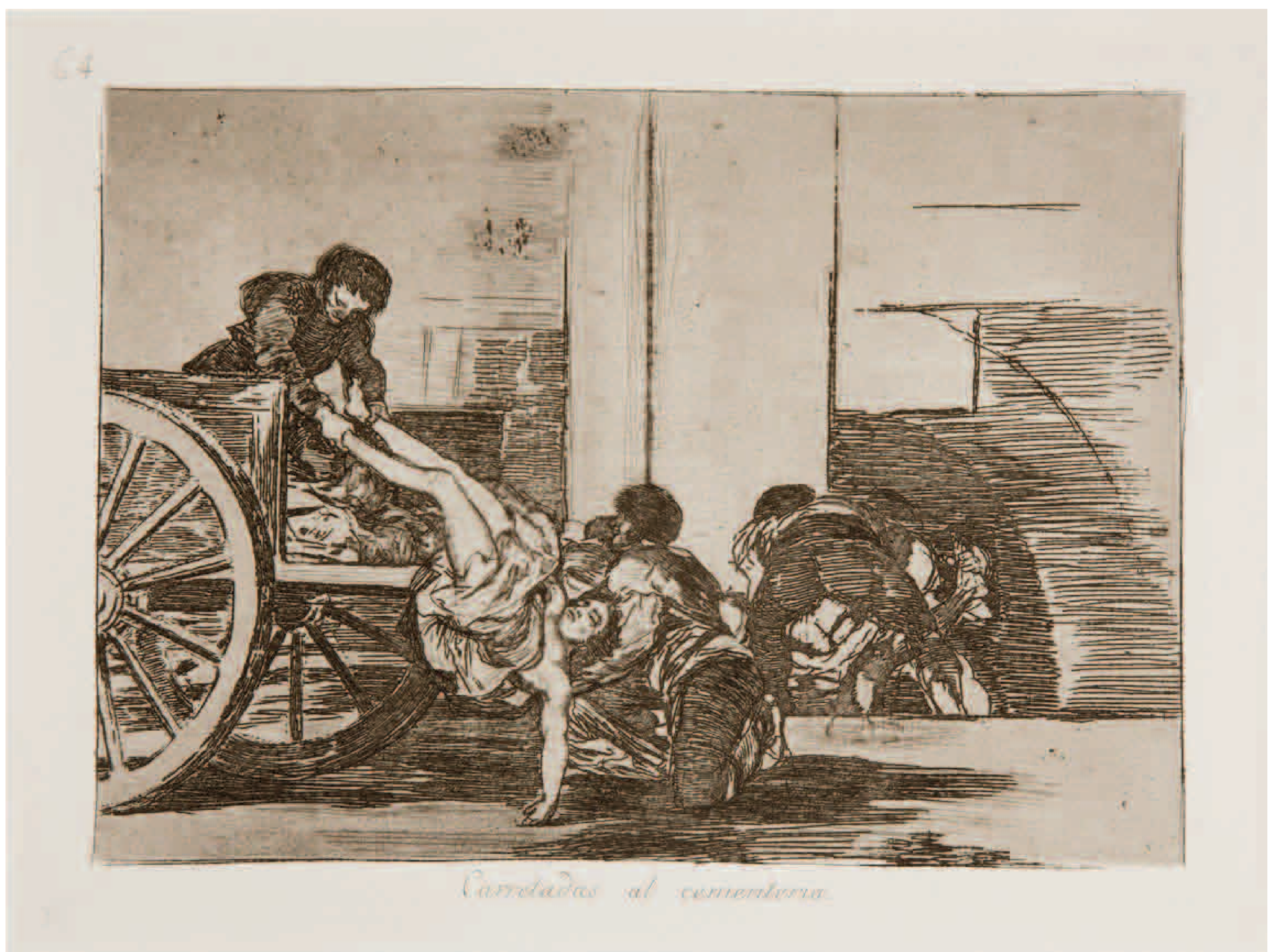
Francisco de Goya, "Carretadas al cementerio", Los desastres de la guerra (Desastre 65)

La segunda y mayor de las fosas consistía, según los diarios de Faustino Casamayor, en “una zanja muy honda” que se abrió en la denominada Salitrería de la arboleda de Macanaz, un gran edificio para la obtención de salitre que durante el Segundo Sitio cerraba la línea defensiva del Arrabal. Esta fosa, en la que se depositaron más de 10.000 cadáveres, se encontraría en el entorno de las actuales calles García Arista, Arquitecto Aguilera y Avenida de los Pirineos.