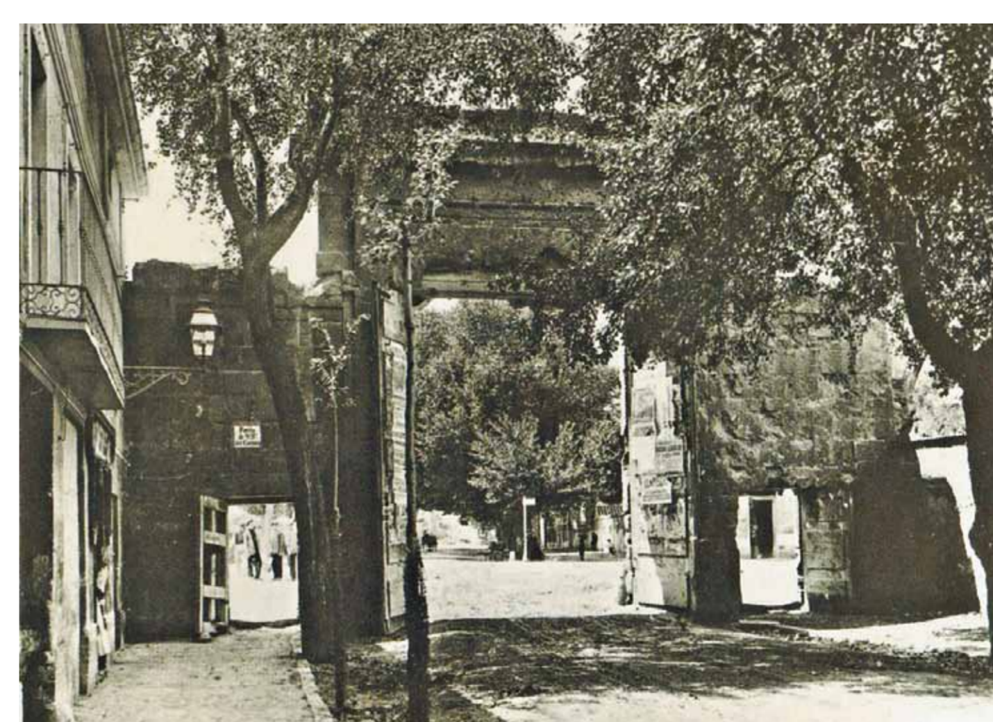
Vista de la Puerta del Carmen desde el interior.