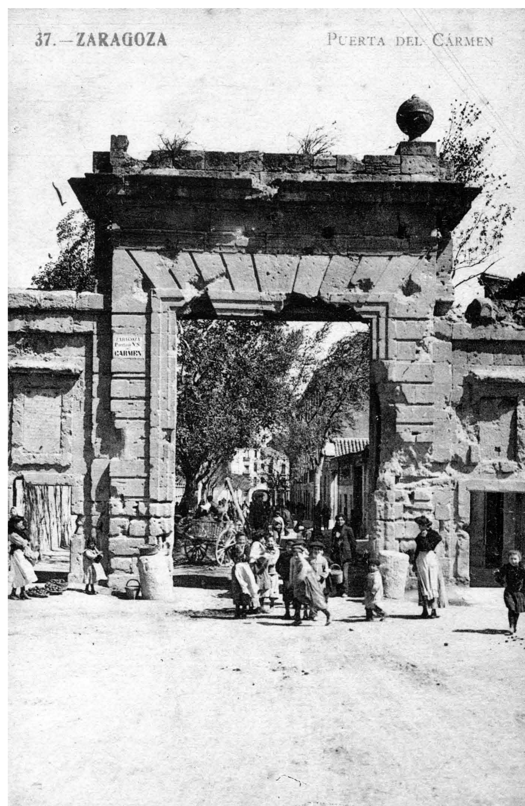
Zaragoza. Puerta del Carmen